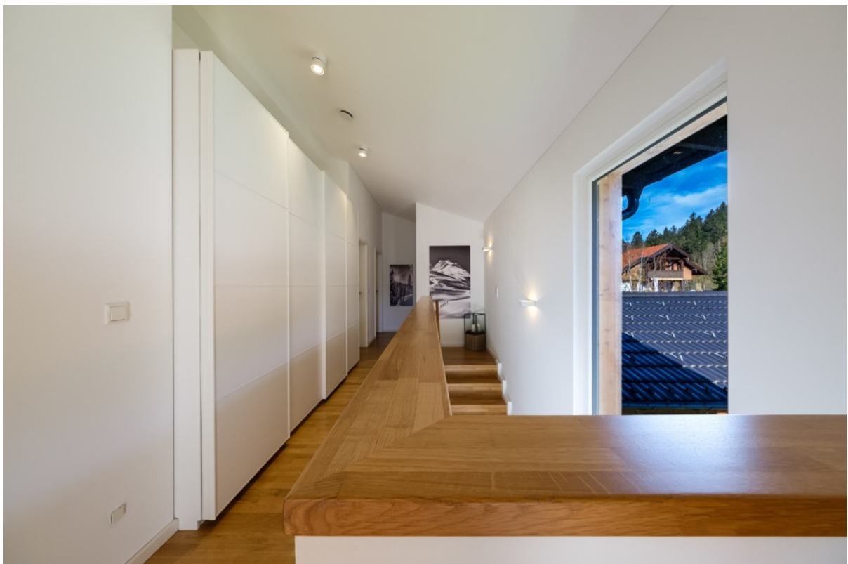
Alpen Immo Bahnhofstraße 5 Aur