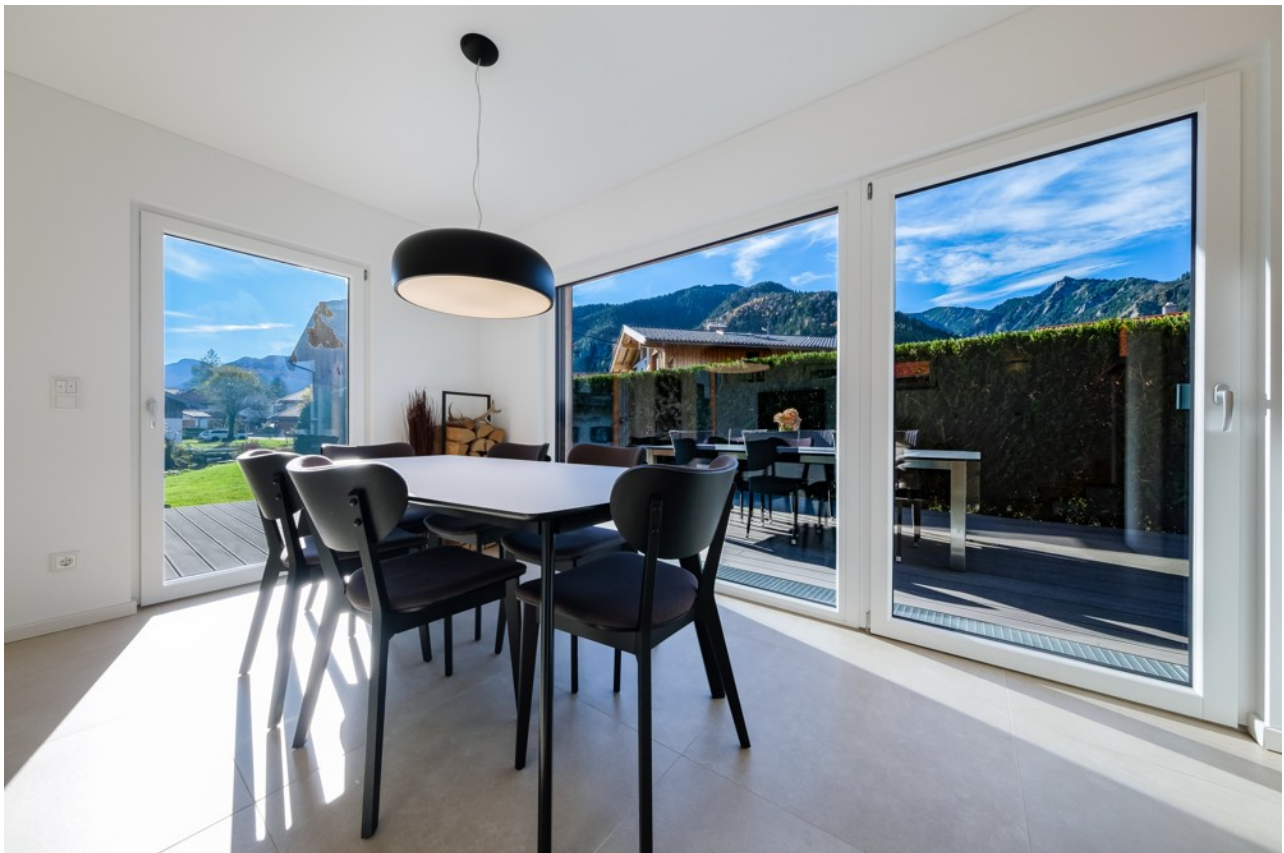
Alpen Immo Bahnhofstraße 5 Aur