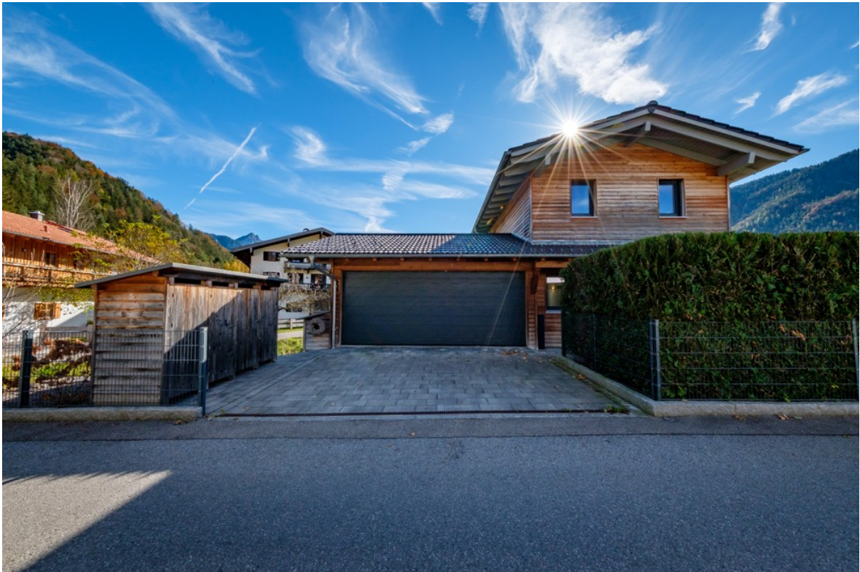
Alpen Immo Bahnhofstraße 5 Aur