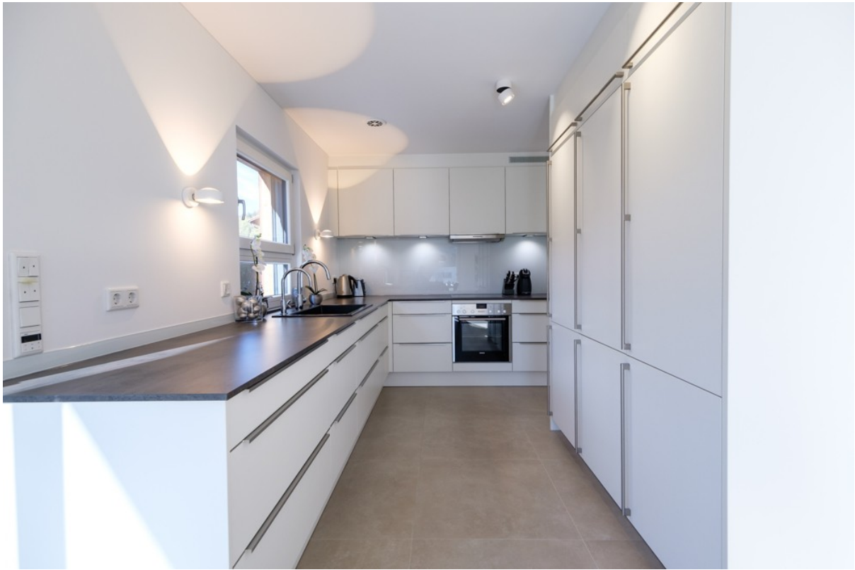
Alpen Immo Bahnhofstraße 5 Aur