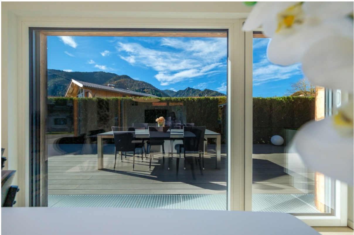
Alpen Immo Bahnhofstraße 5 Aur