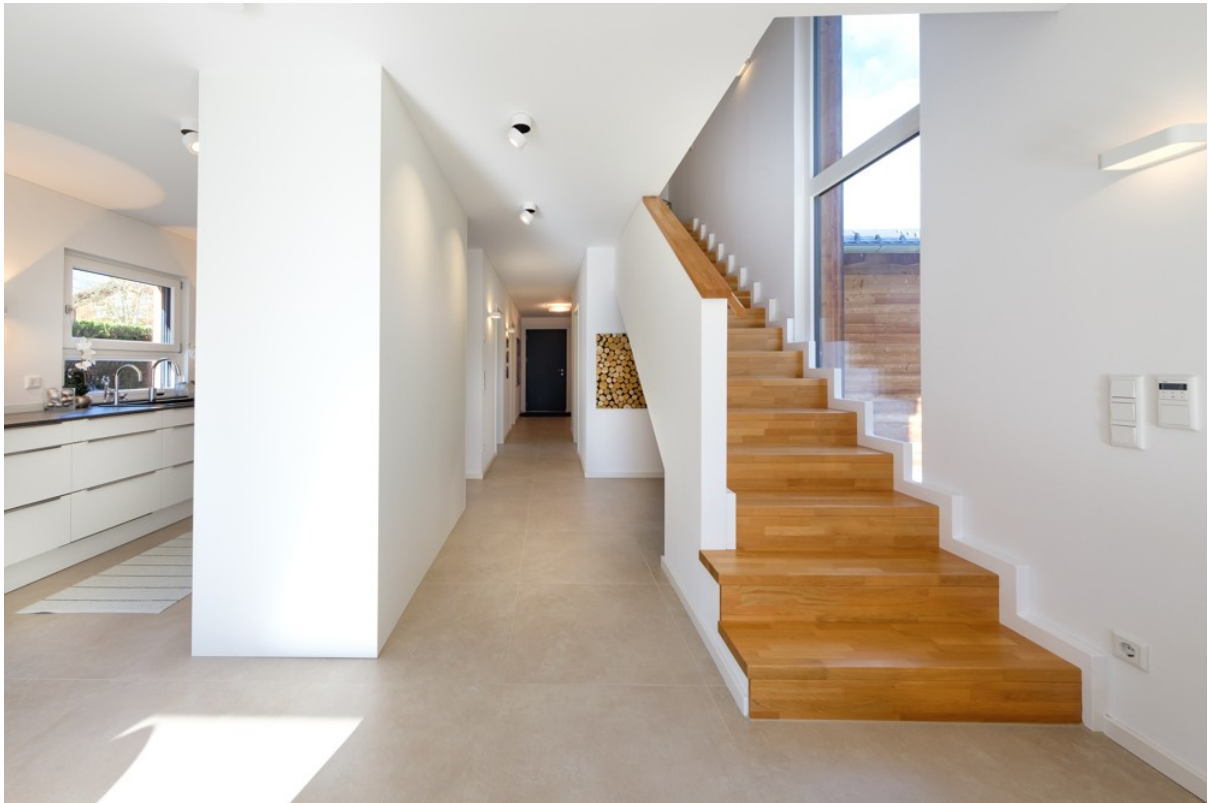
Alpen Immo Bahnhofstraße 5 Aur