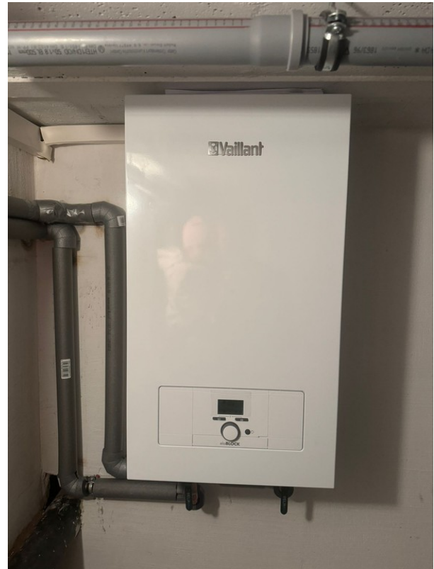
neue Heizung Vaillant