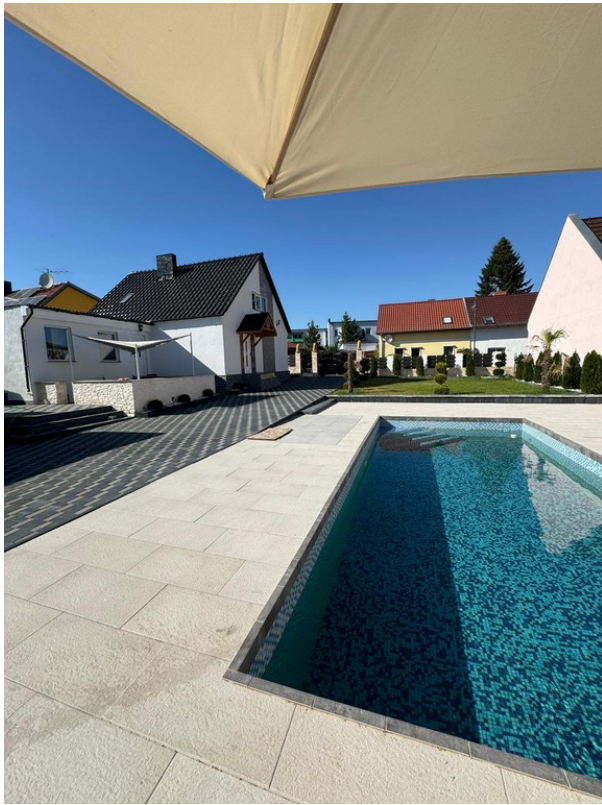
Hausansicht mit Pool