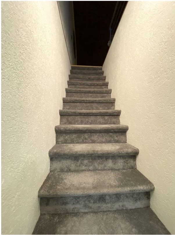
Treppe zum Dachboden