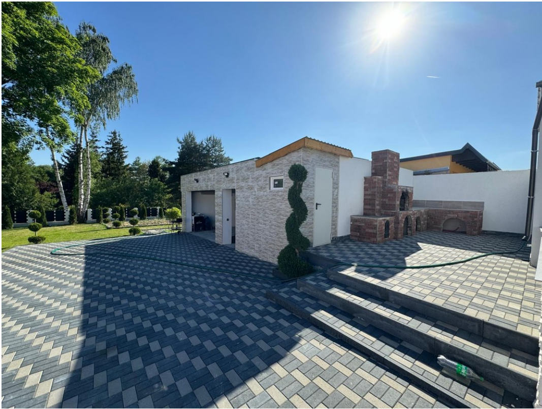
Garage & Steinofen