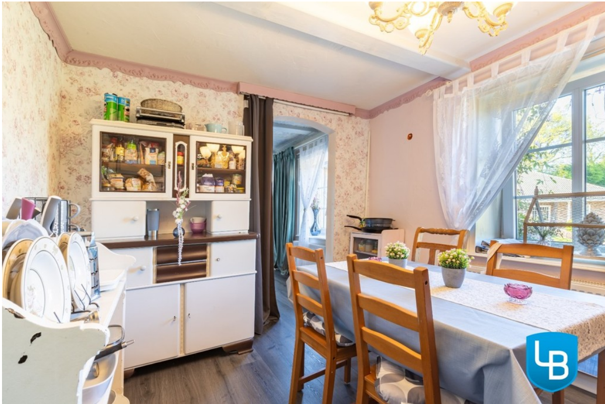
Mit Platz für einen Esstisch