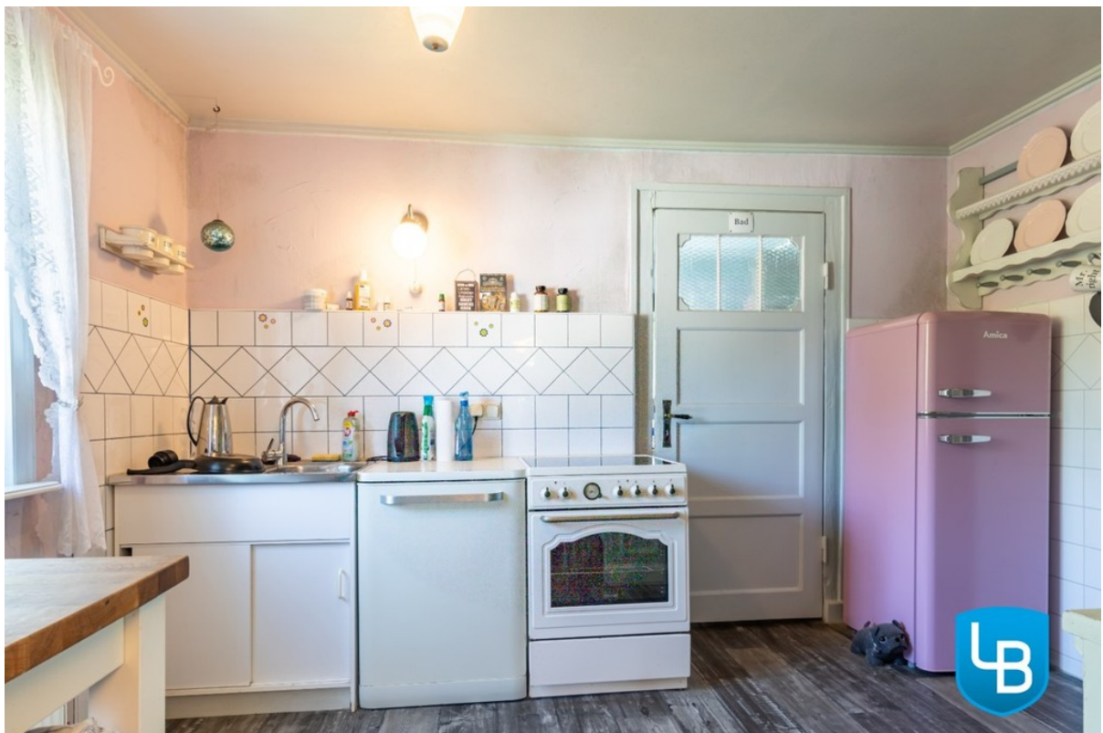
Platz zum Kochen