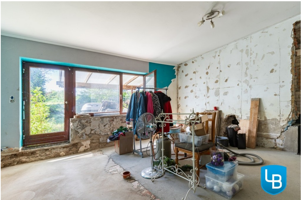
Hier können Sie...