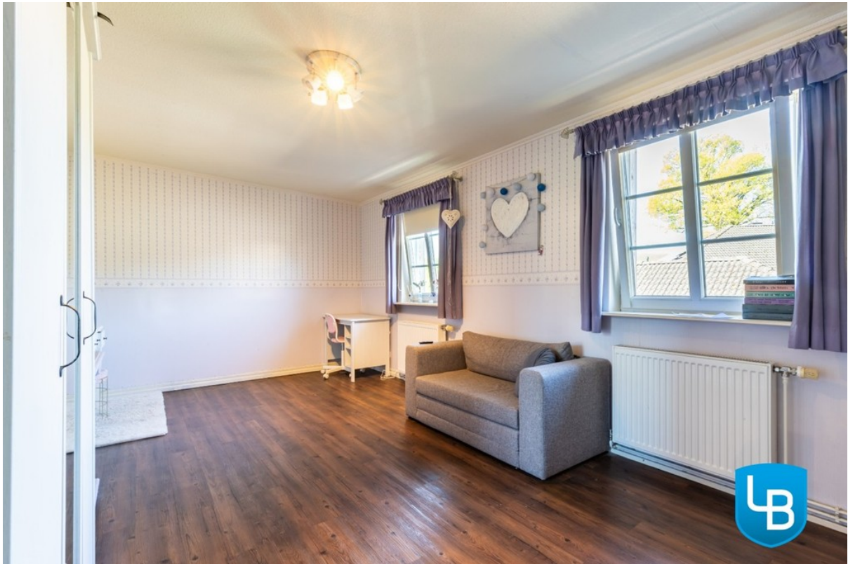
Mit viel Platz