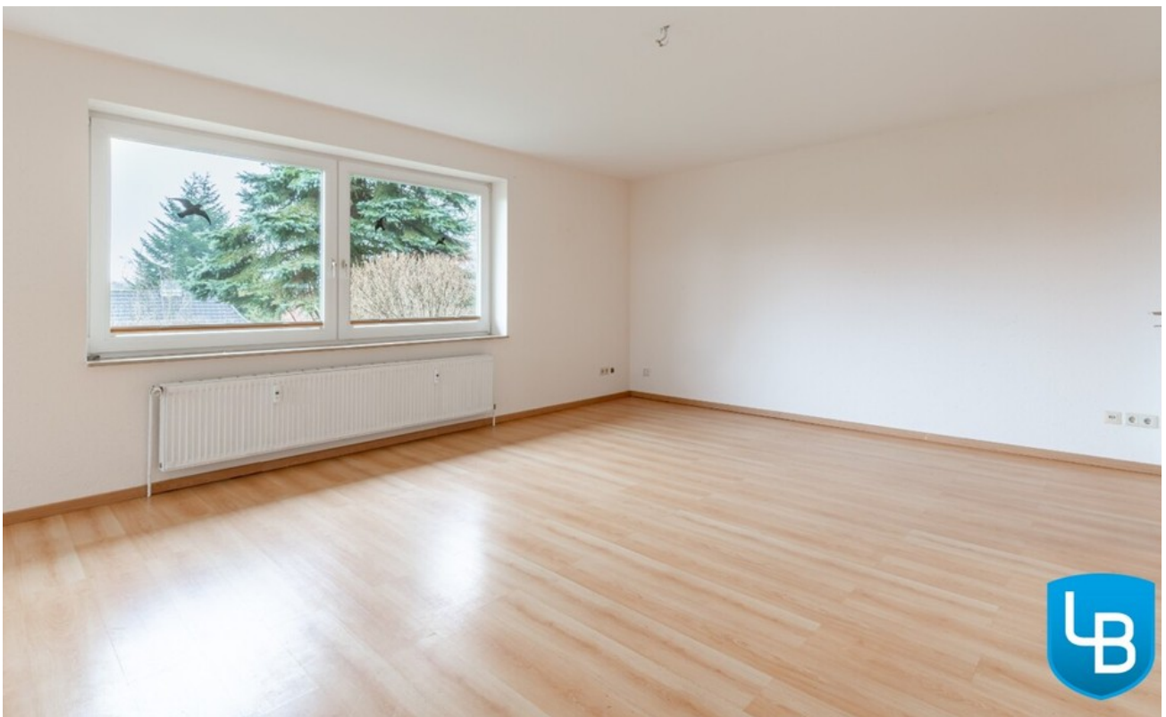
Platz zum Wohnen und Wohlfühle