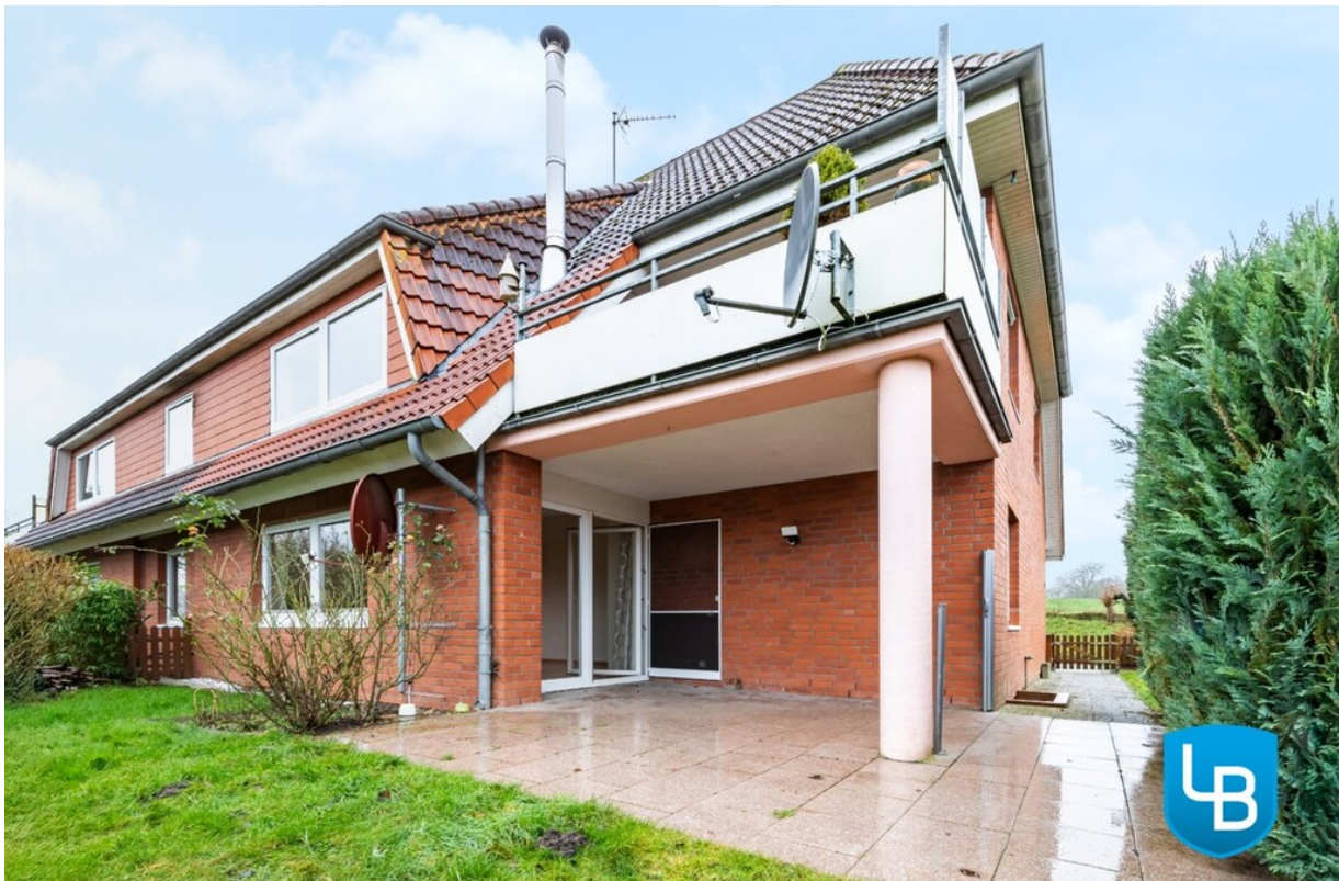
Hausansicht aus dem Garten