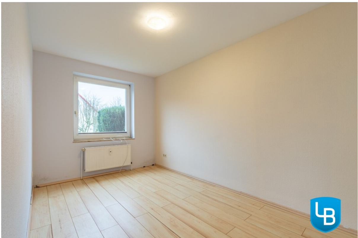
Platz für Bett und Schrank