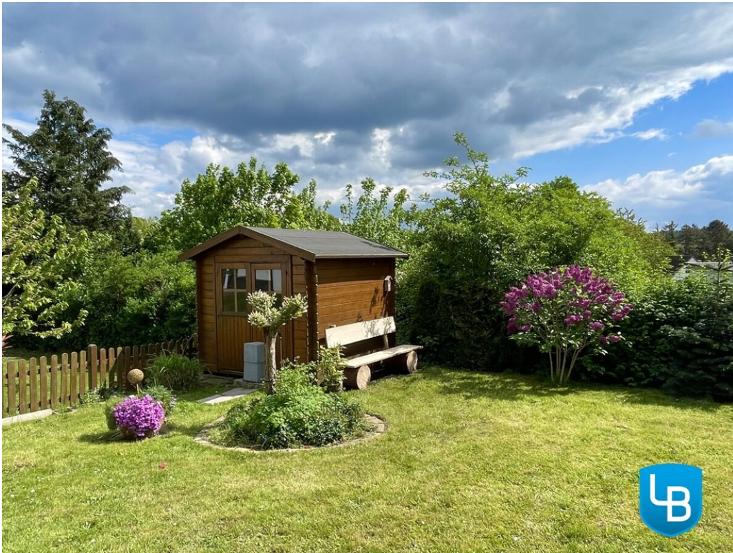
Garten im Sommer