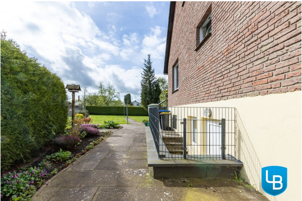
Zugang zum Kellergeschoss