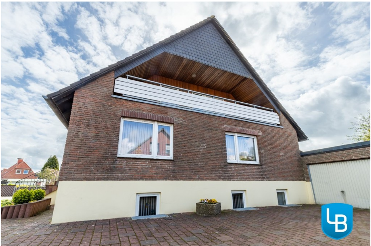
Hausseite mit Loggia