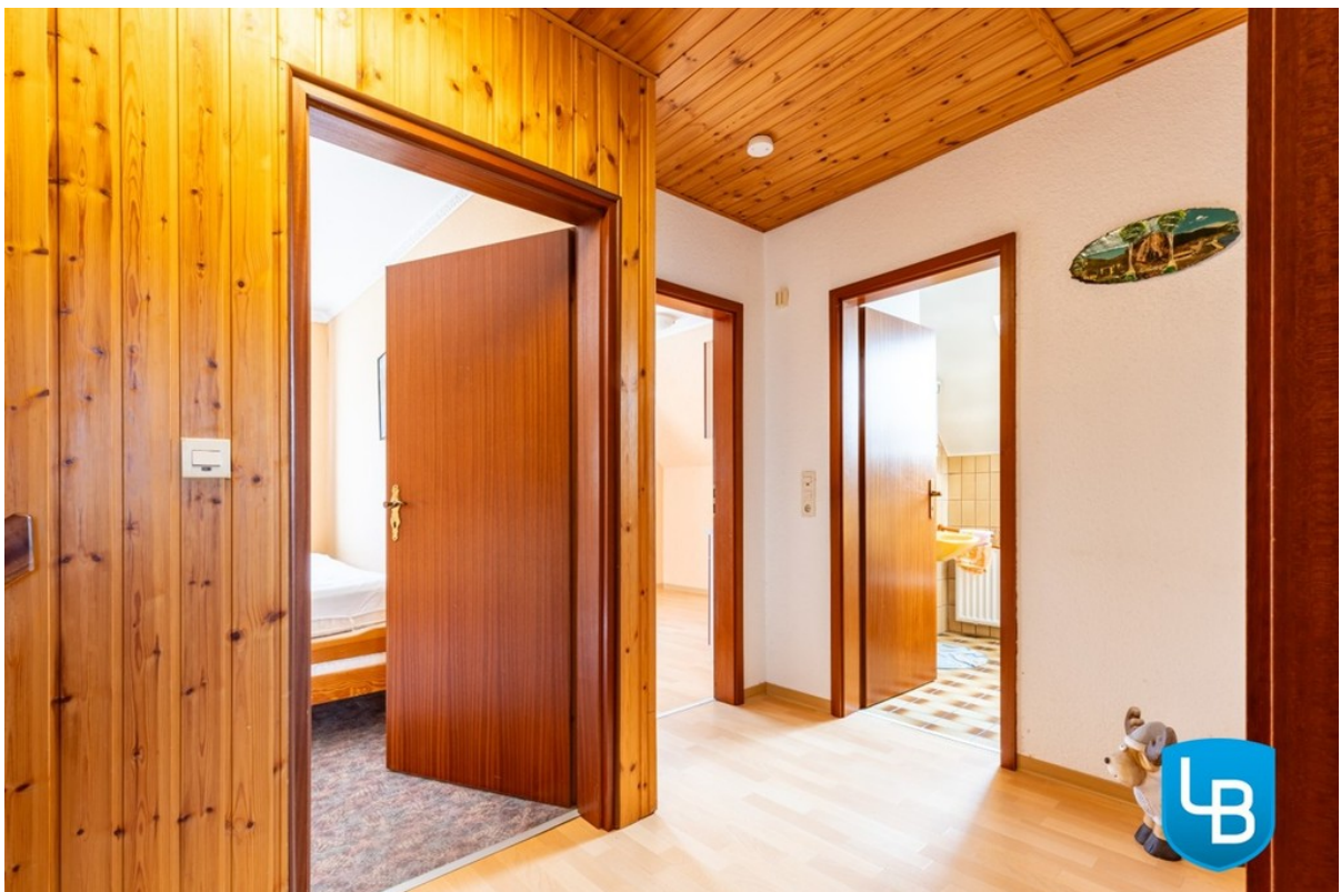
Flur im DG