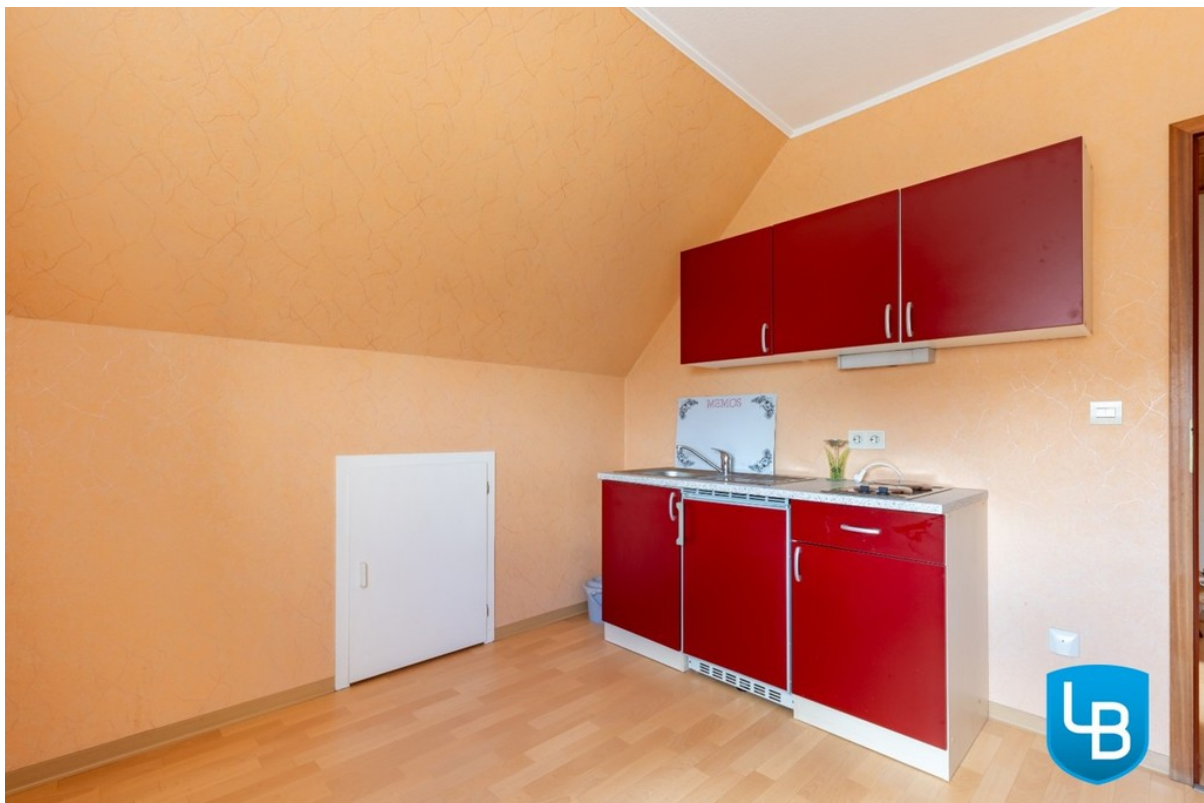
Küche im DG