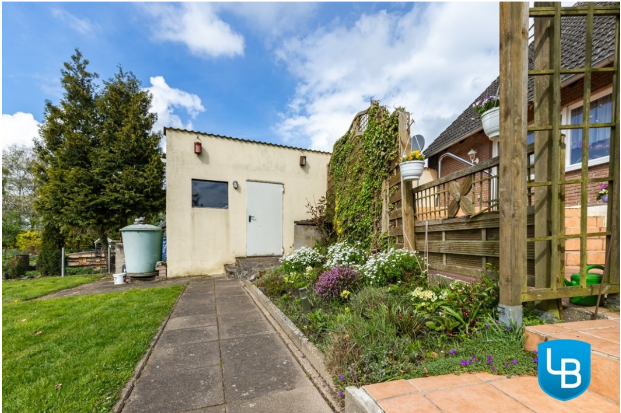
Blick zur Garage