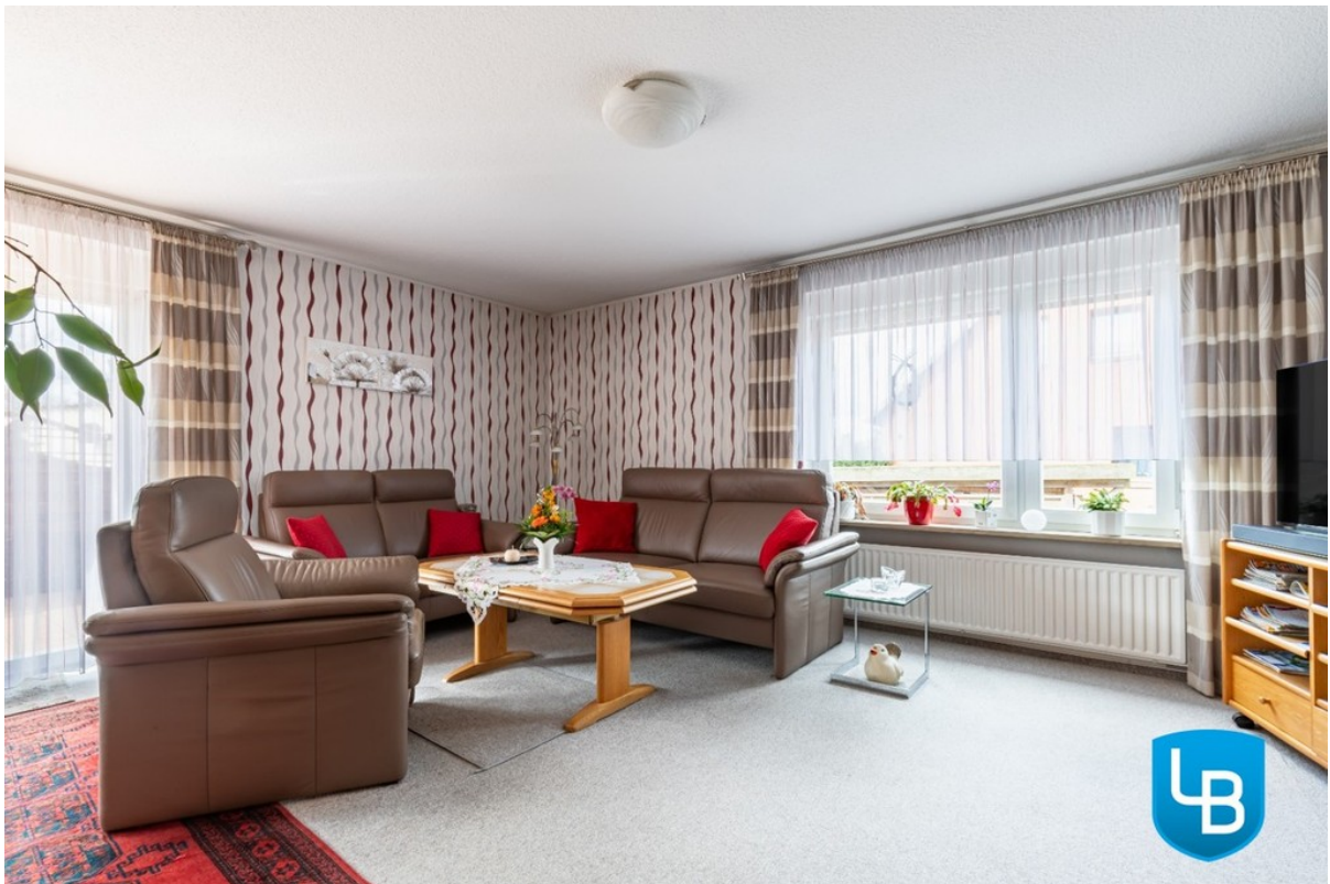
... mit Zugang zur Terrasse