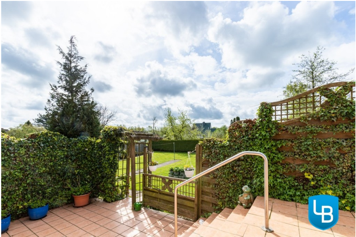
Terrasse mit Gartenzugang