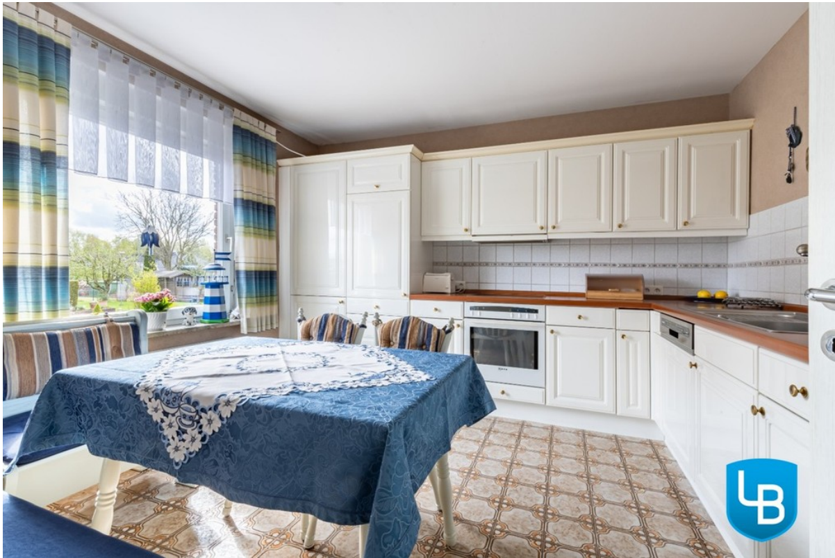
Helle Küche mit Sitzgelegenheit