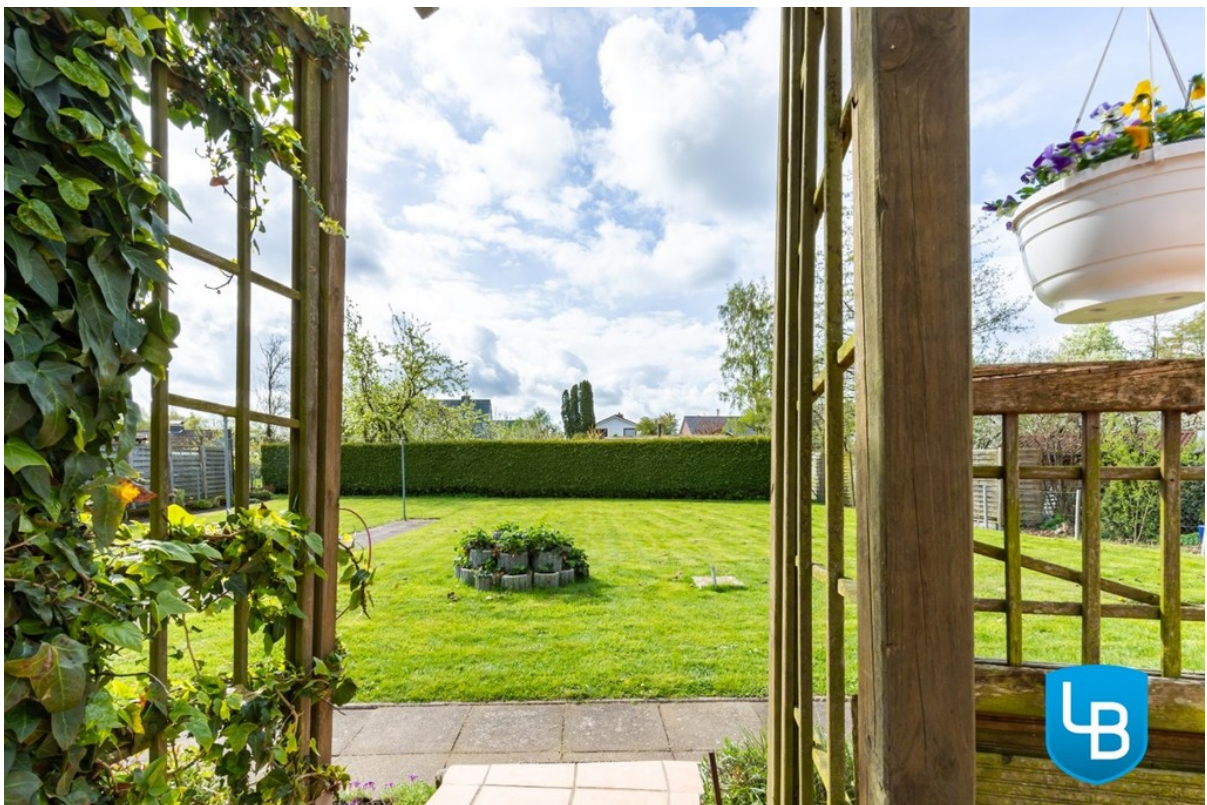
Zugang zum Garten