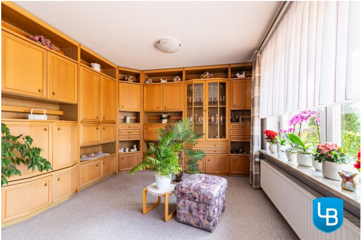
.. und Lichtdurchflutet