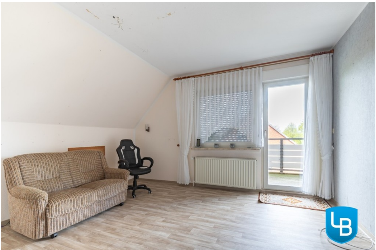
Schlafzimmer mit Zugang zur Lo