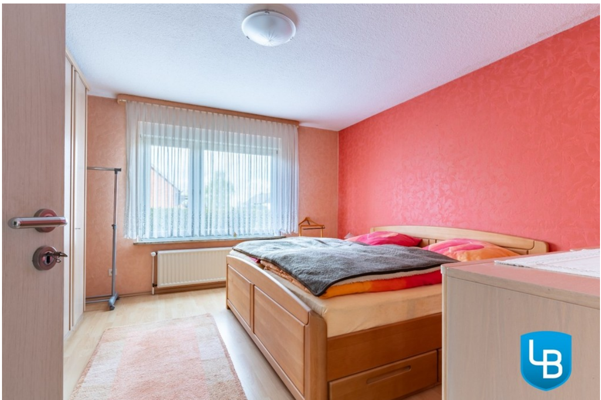
Schlafzimmer im EG