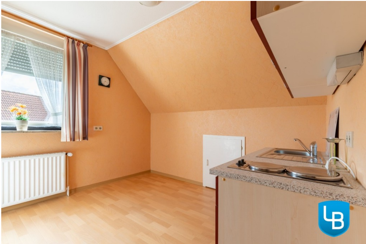
... mit Platz für einen Esstis