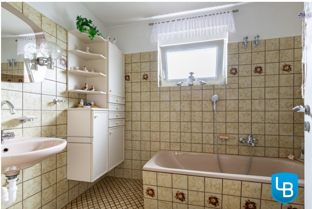
Wannenbad im EG