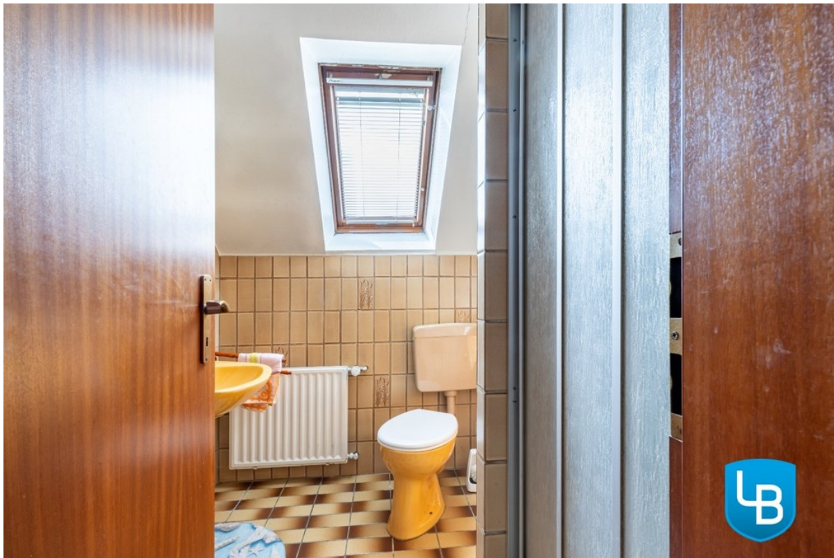
Duschbad im DG