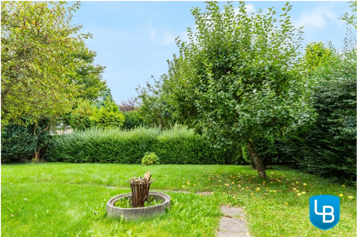
Gepflegter Garten zum entspann