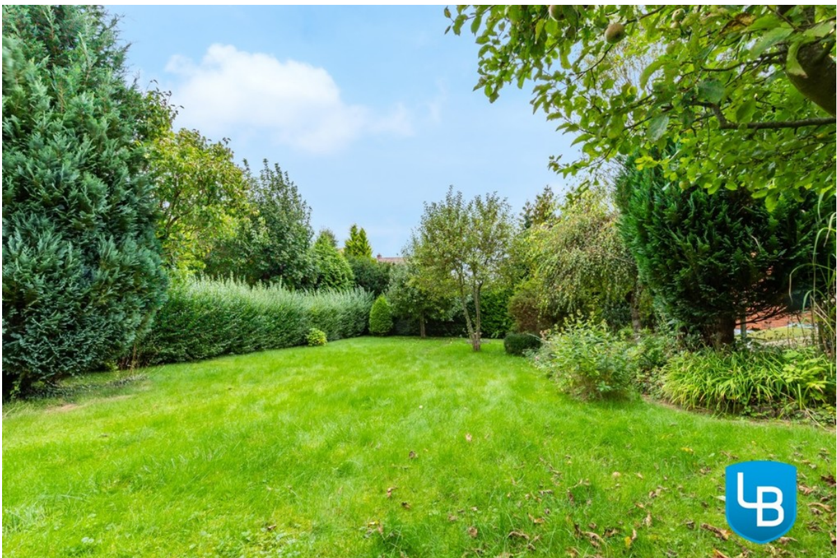
Garten mit viel Grün