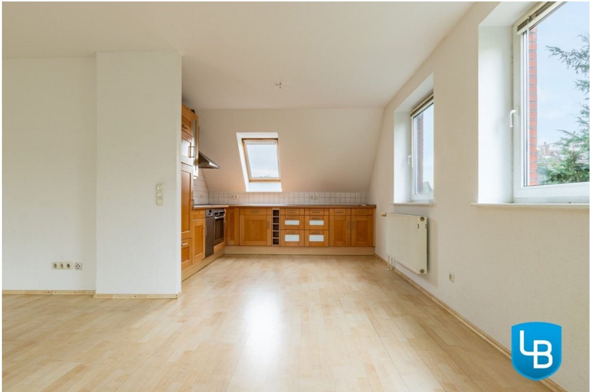
Wohnbereich mit Küche