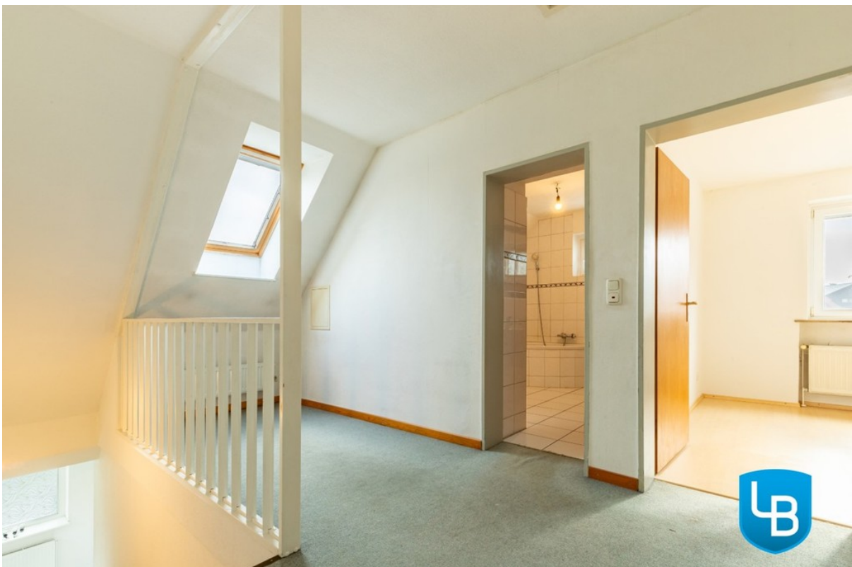
Flur im Dachgeschoss