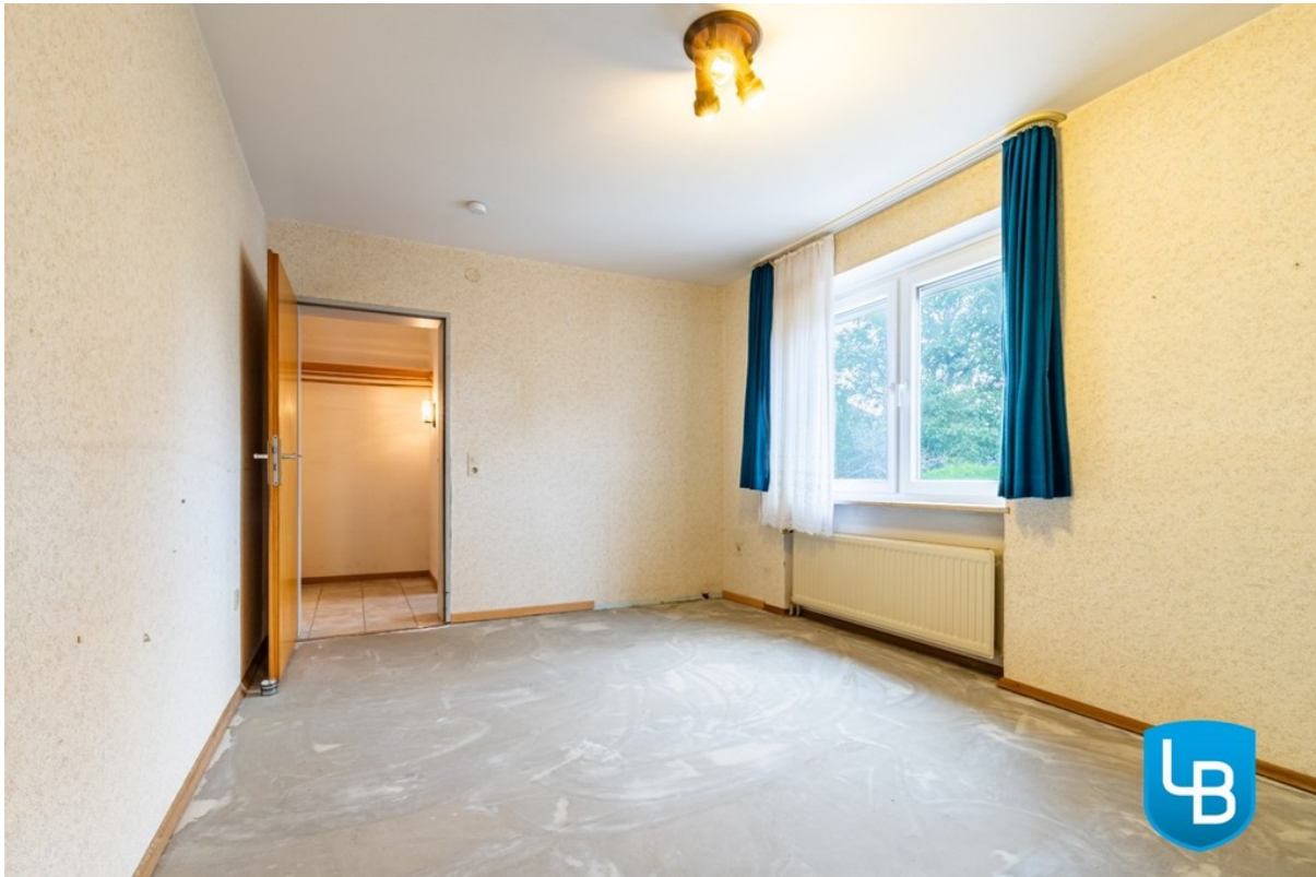
Schlafzimmer mit angrenzendem