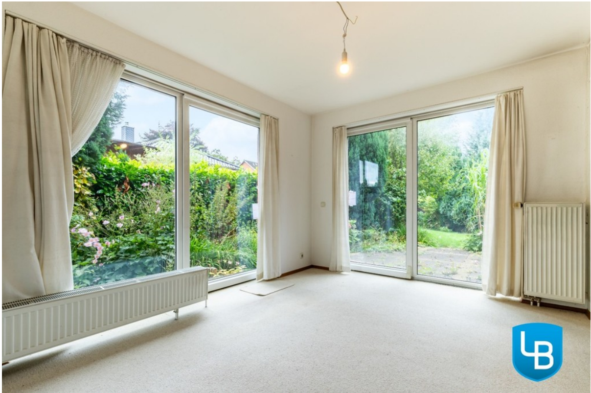
Blick auf die Terrasse und in