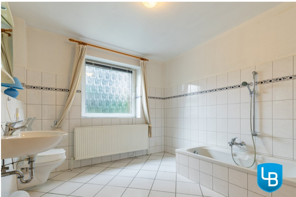
Helles Vollbad mit Tageslicht