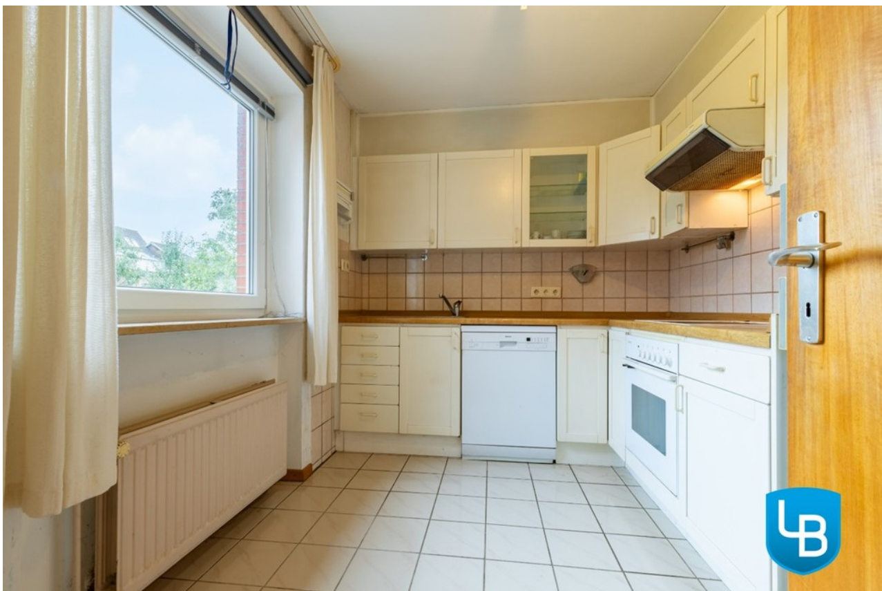
Freundliche Küche mit viel Lic