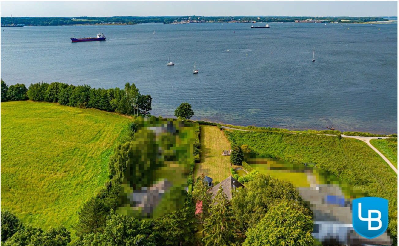
Mehr Meerblick geht nicht