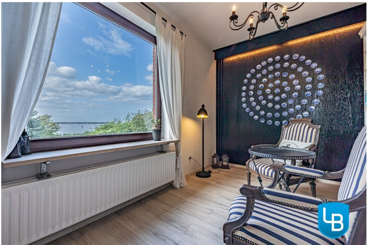
Ausblick der Extraklasse