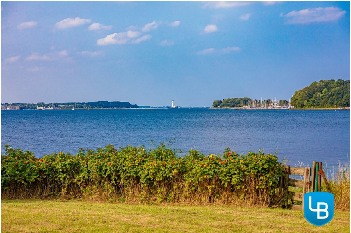
Ihr Weg zum Meer