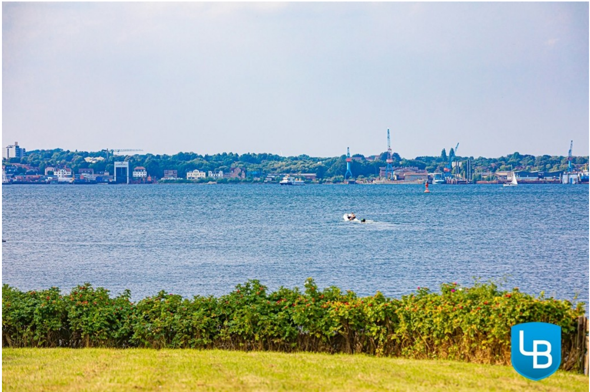
Me(e)hr geht nicht