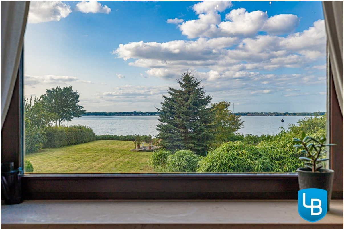
Fördeblick aus dem Wohnzimmer