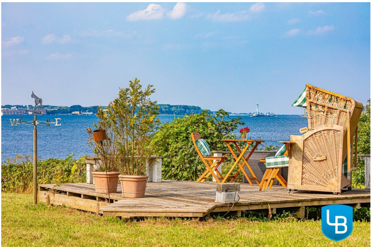
Ihr Platz an der Sonne