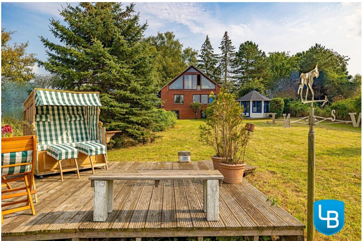
Terrasse in Wassernähe