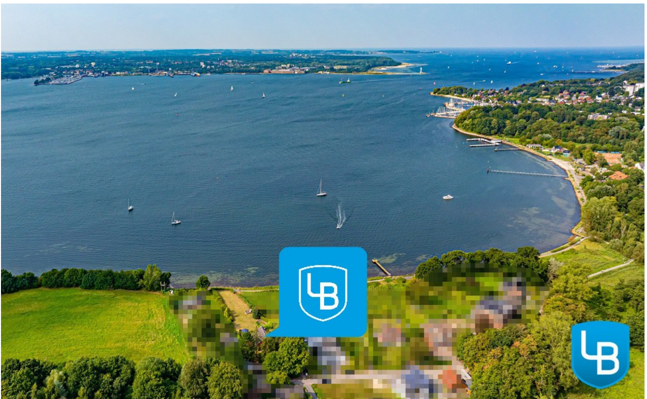
Vor Ihrer Haustür