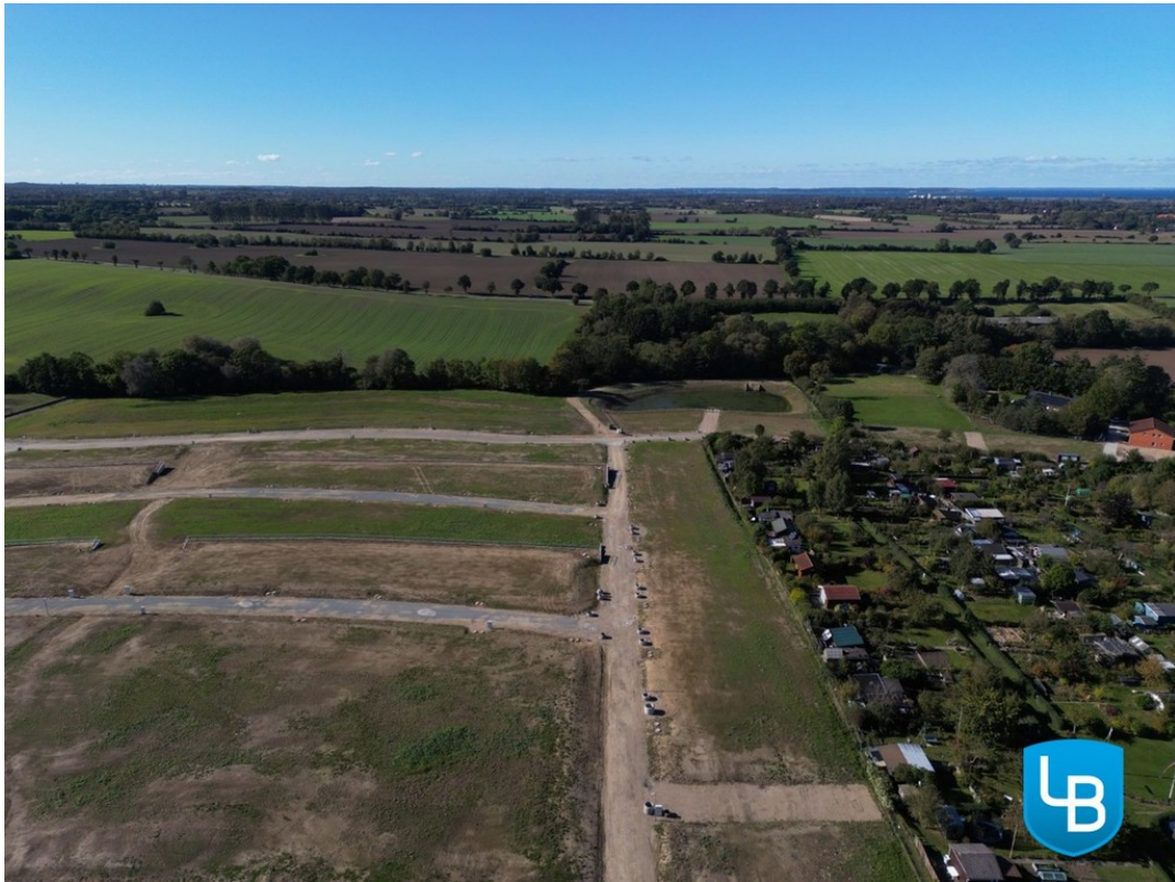
Optimale Infrastruktur im Ort