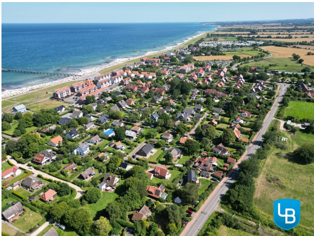
..lädt zu Spaziergängen ein