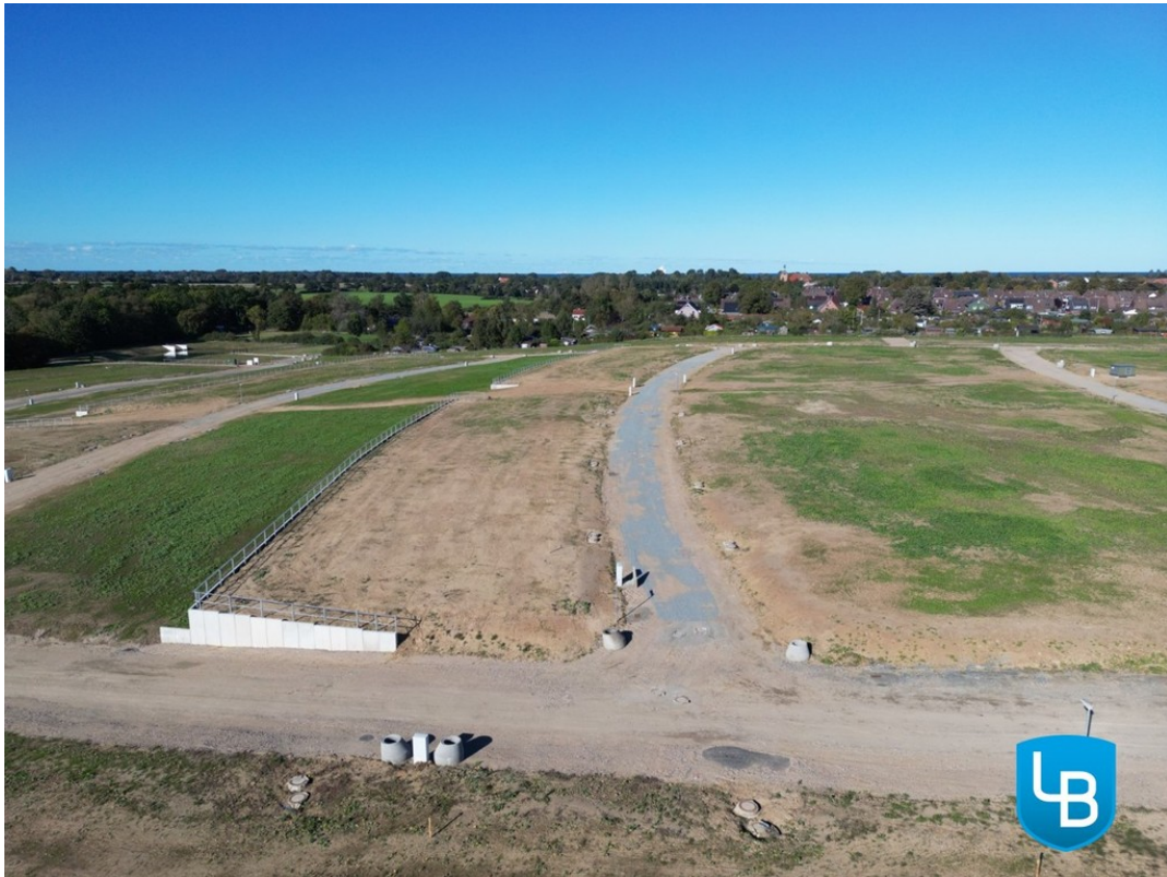
Platz für Träume in schöner Um