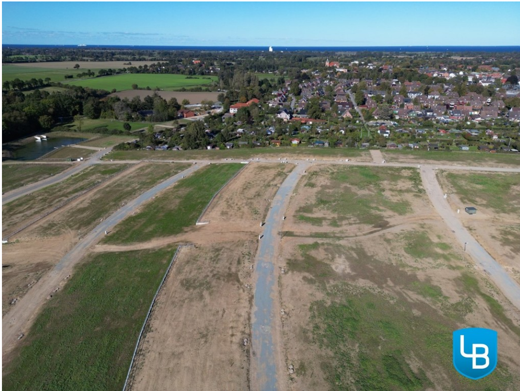
Grundstück in Top-Lage