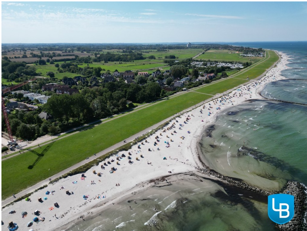
Der weitläufige Schönberger St