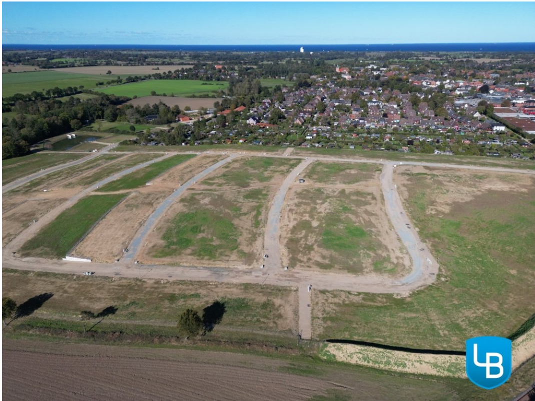
Grundstück in zentraler Lage