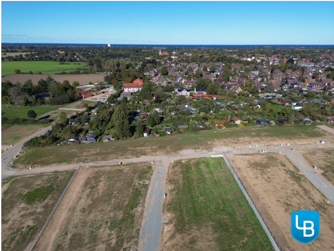
In Strandnähe im hohen Norden