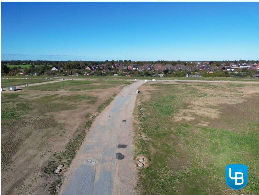
Ihre neue Nachbarschaft wartet