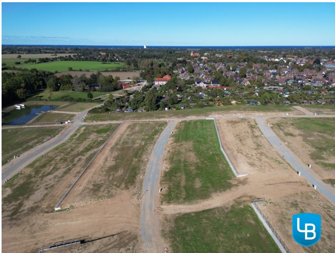
Grundstück mit optimalen Anbin