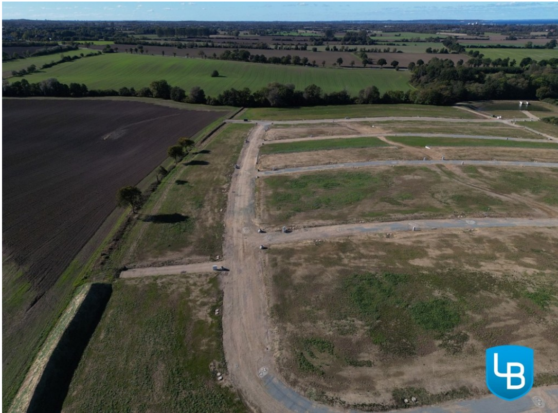
Ihr Rückzugsort an der Ostseek