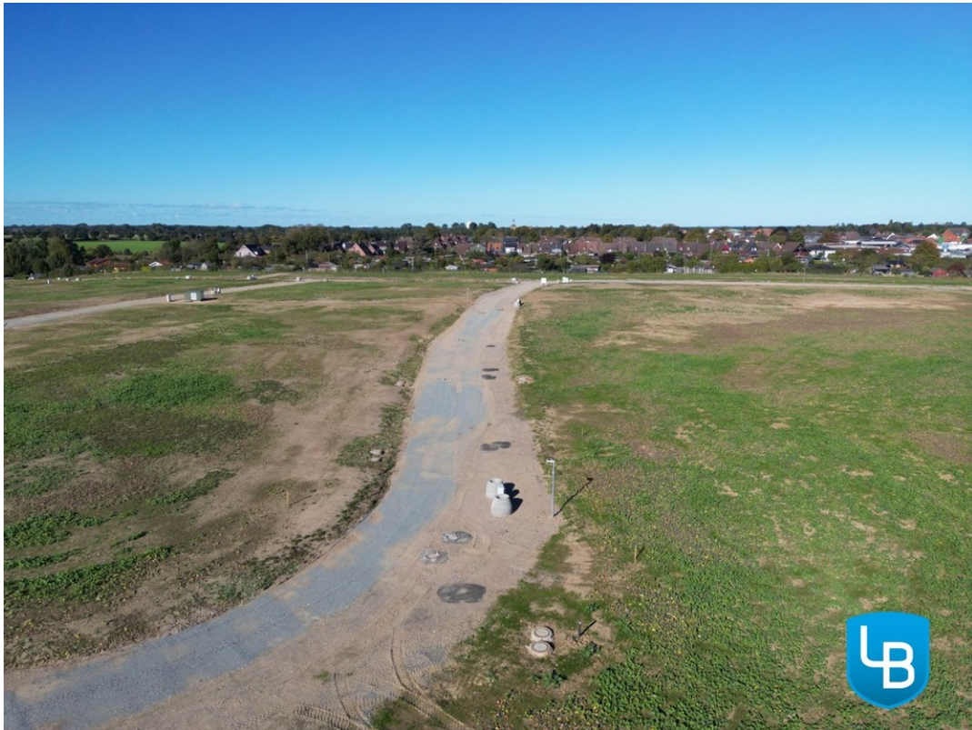
Ein Platz für Ihr Zuhause