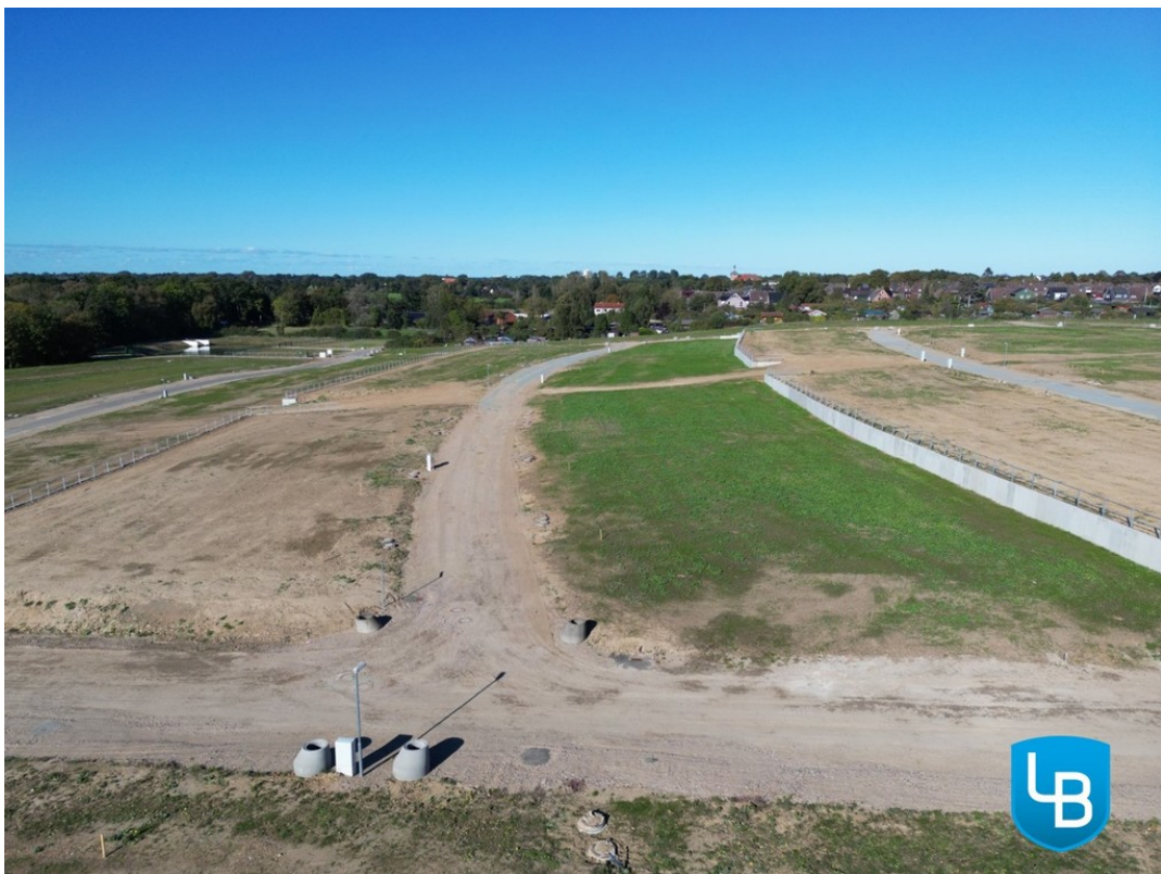
Sonniges Grundstück wartet