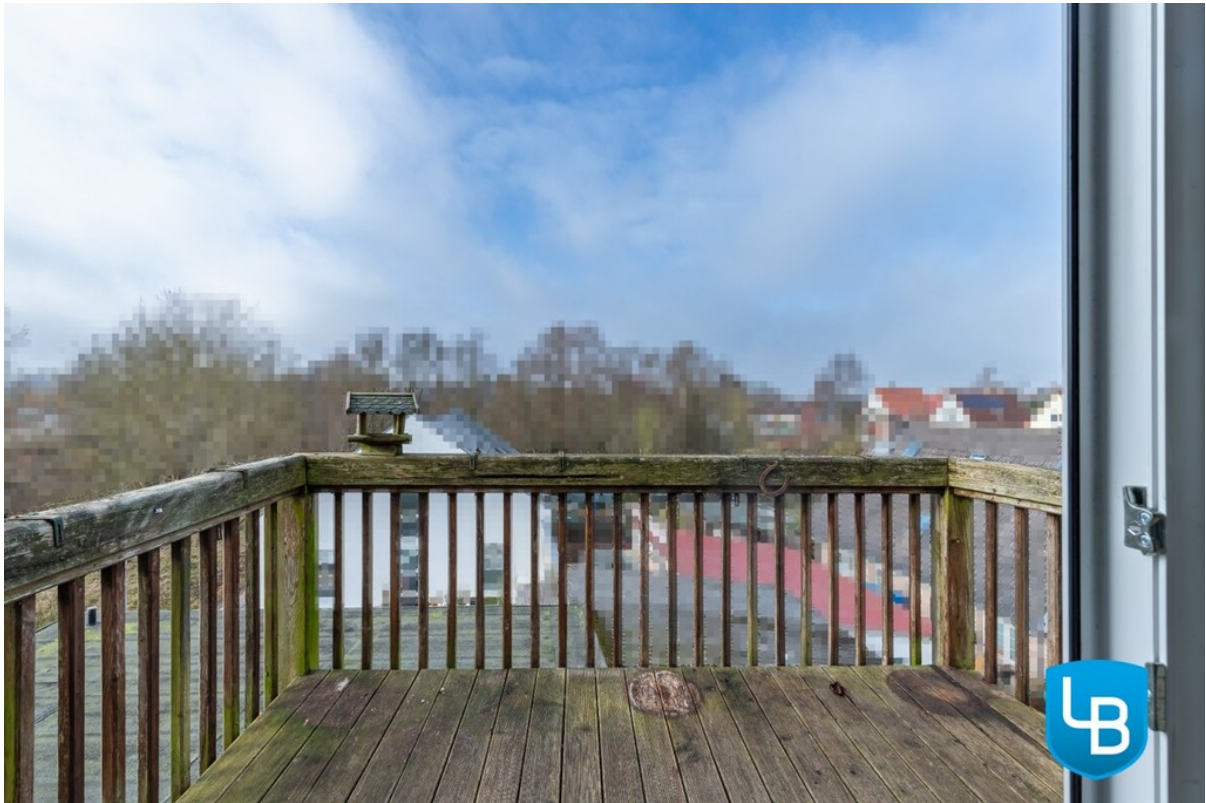
Ihr Platz zum Entspannen