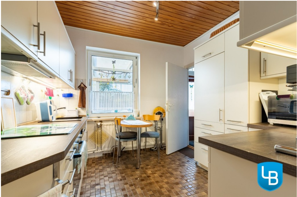
Küche mit Einbauten