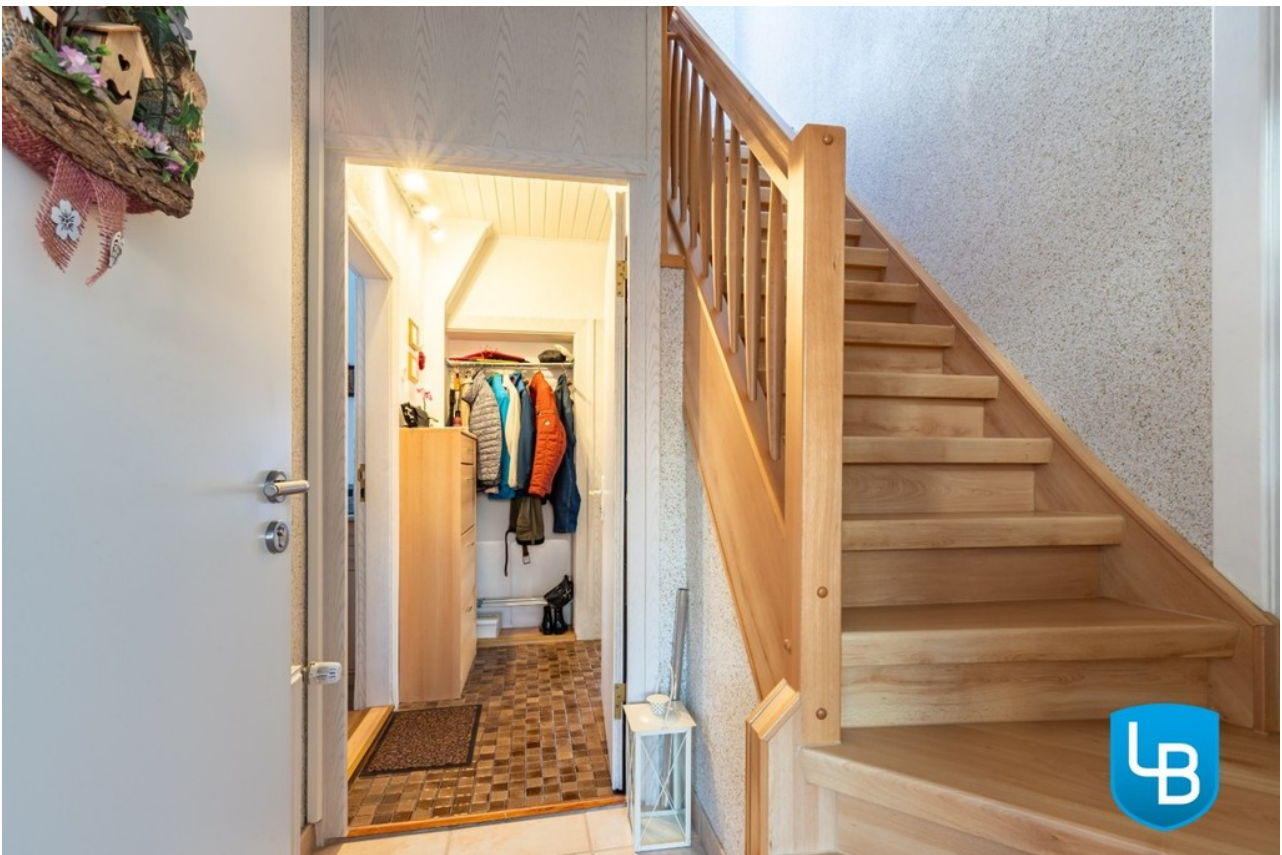
Flur / Treppenaufgang