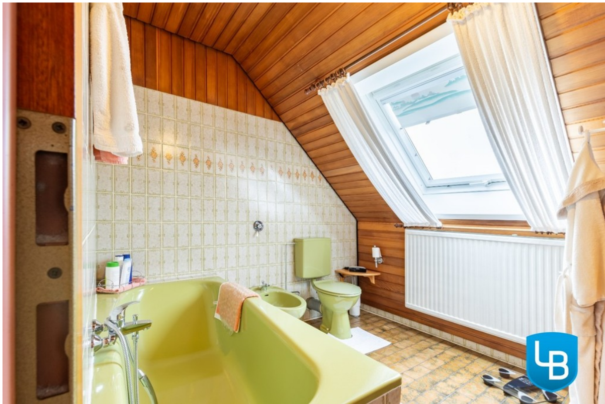
Bad im DG

Ausgezeichnete Beratung rund um Ihre Immobilie.