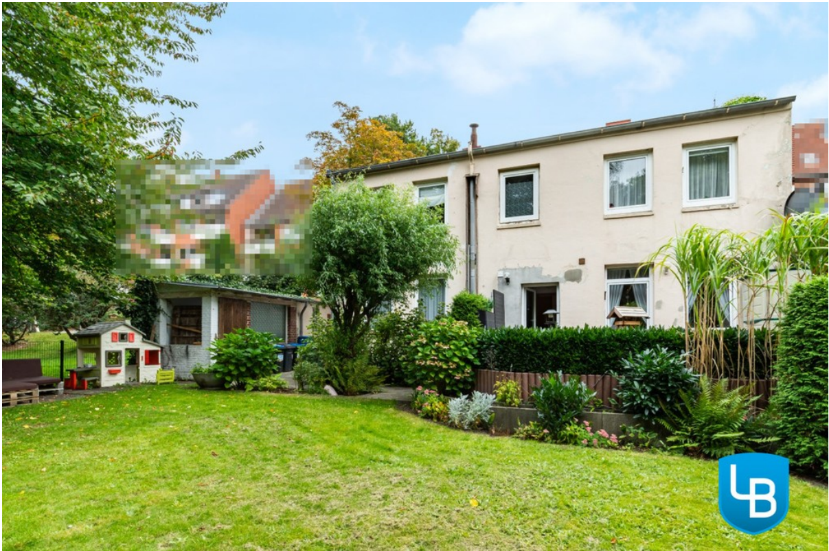
Blick vom Garten