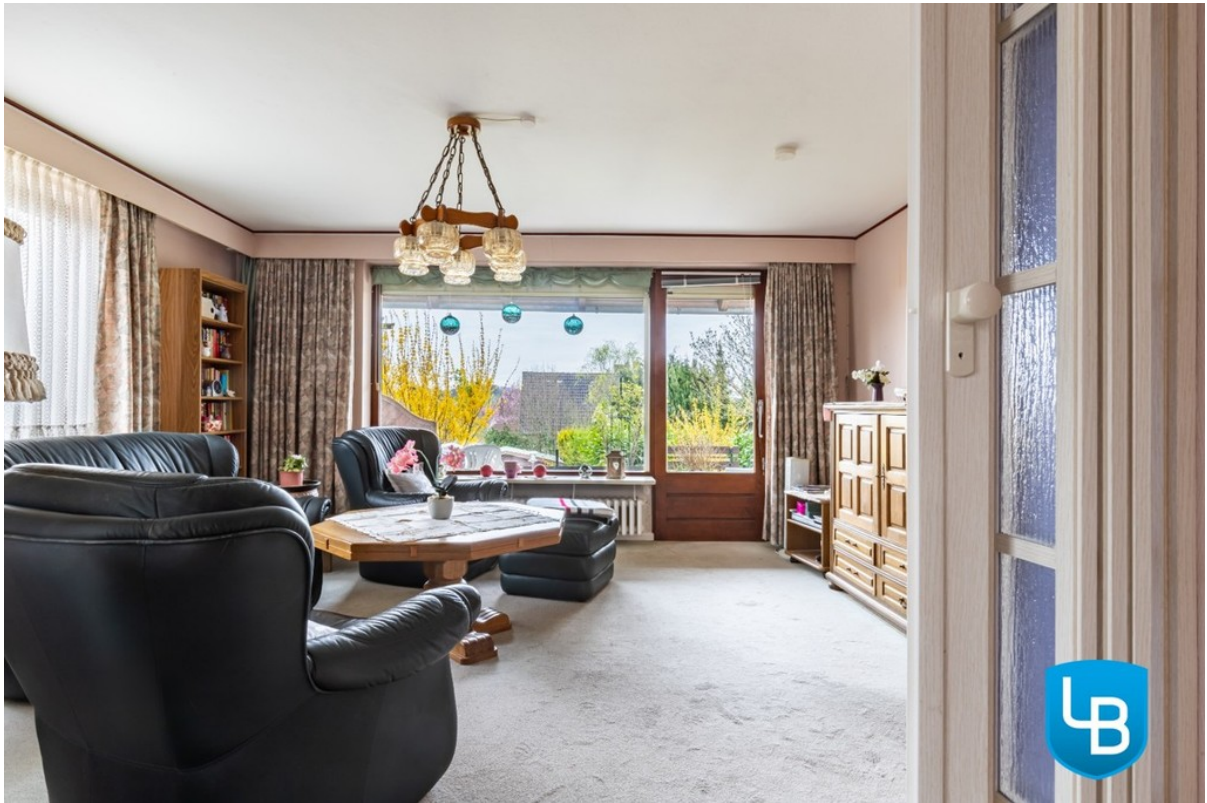
Wohnzimmer rechter Bereich