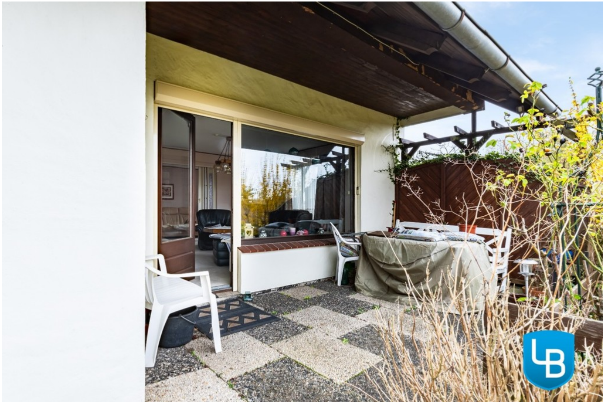
Für gemütliche Abende