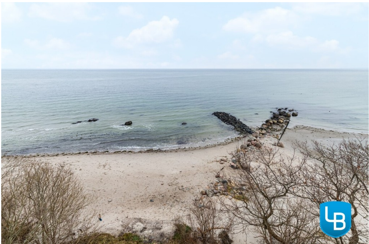
Erholung ganz nah