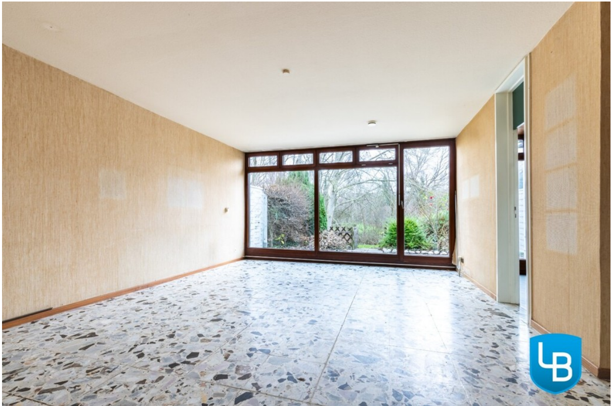
Wohnzimmer mit Zugang zur Terr