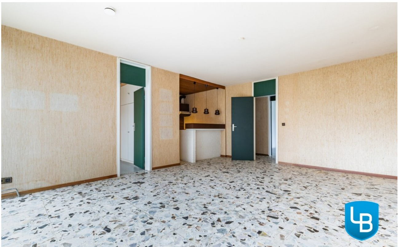
...mit offener Küche...