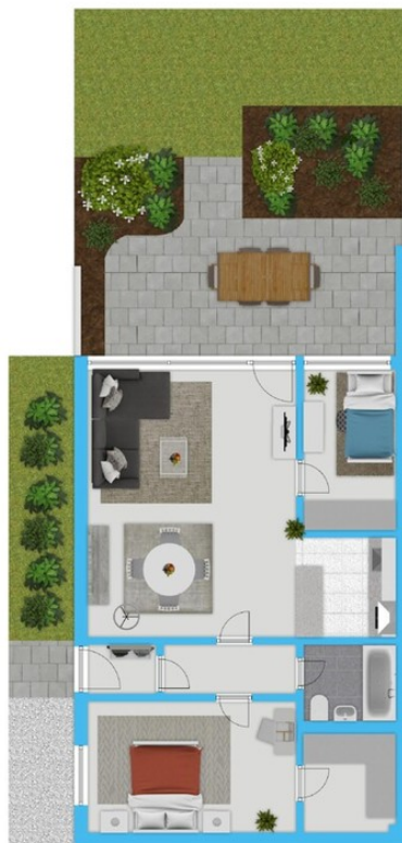
Grundriss mit Außenanlage