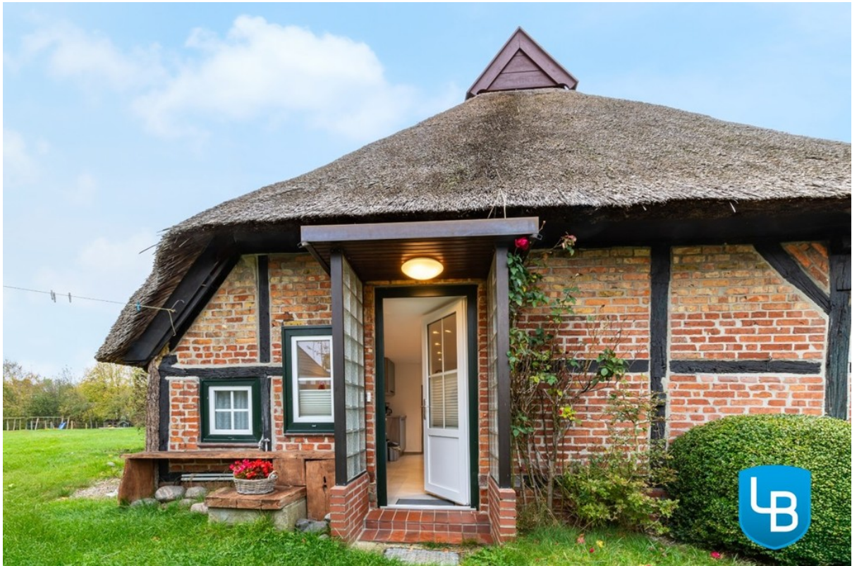
Eingang Wohnung 2