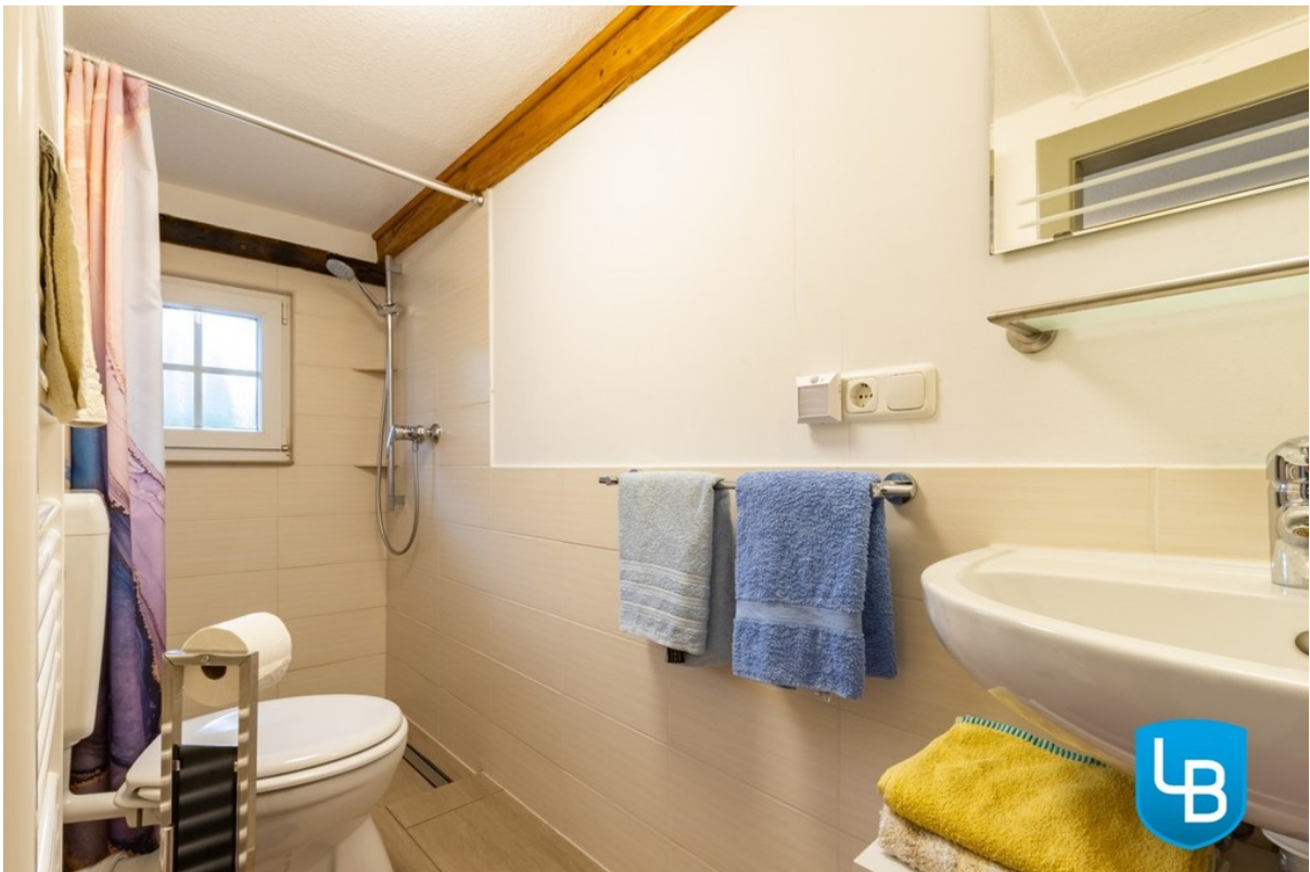
Mit bodentiefer Dusche