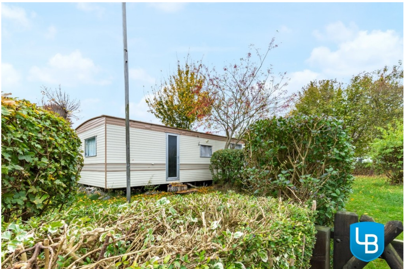
Mit einem Mobilheim