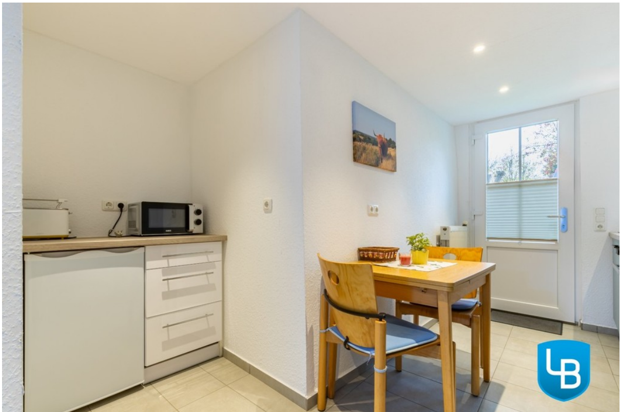
Zeit zum Essen