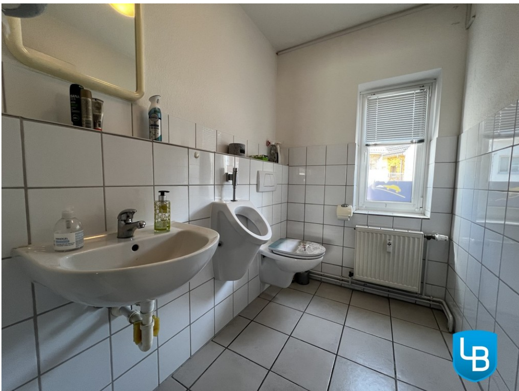
Zur gem. Nutzung