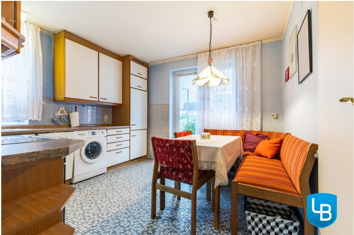
Küche mit Außenzugang