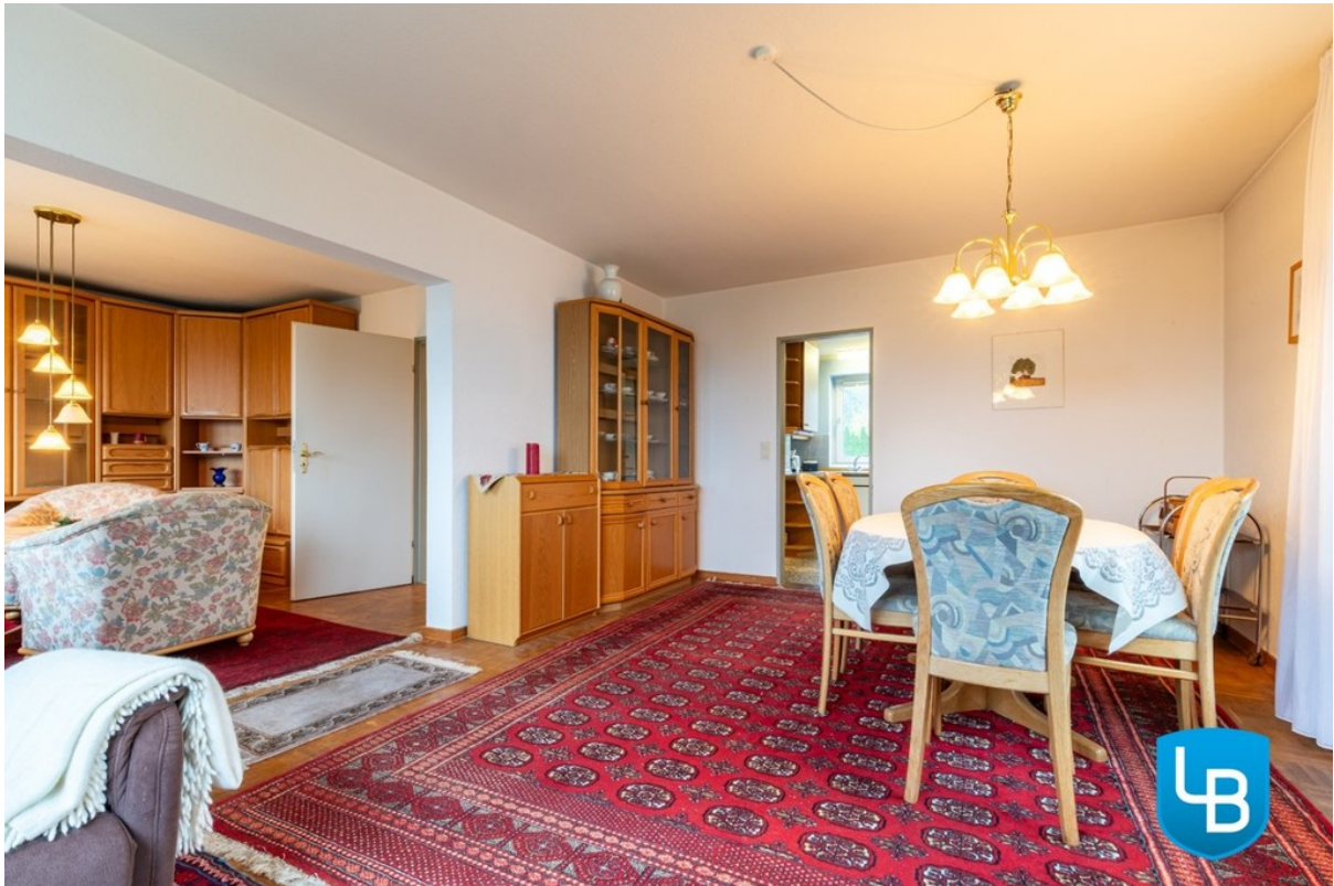
Ess- und Wohnzimmer