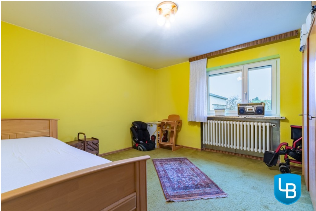
wohlich ausgebautes Zimmer