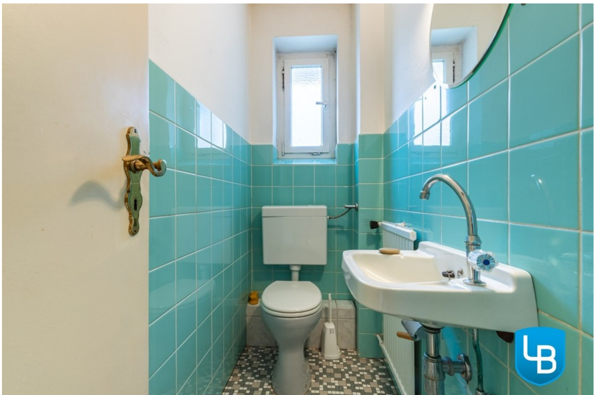
WC im Erdgeschoss