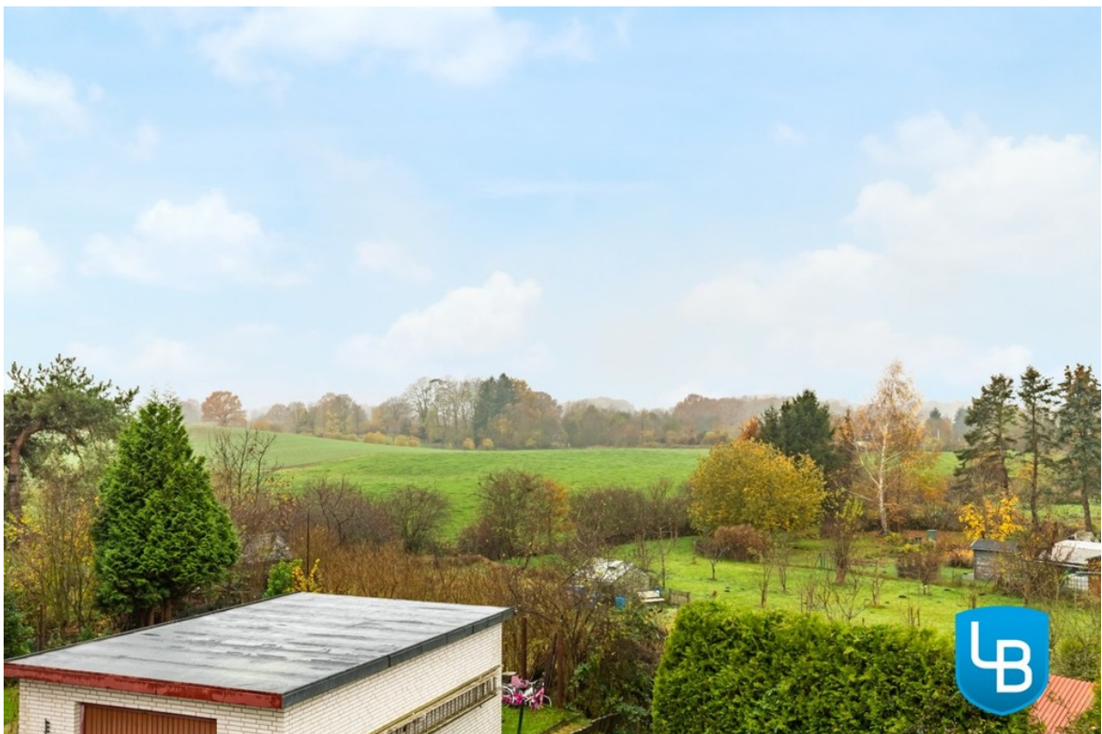
Weitblick über die Felder