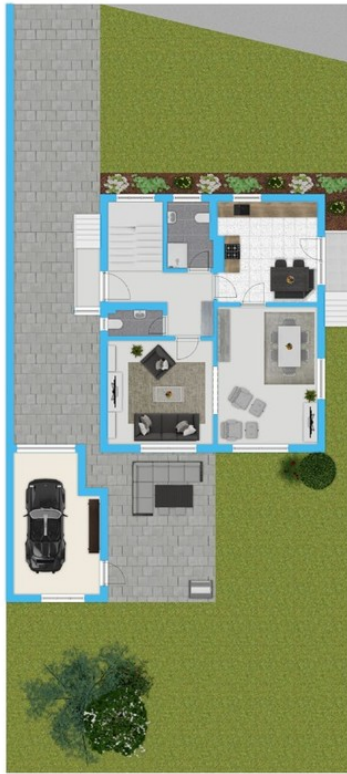
Außenbereich mit Erdgeschoss