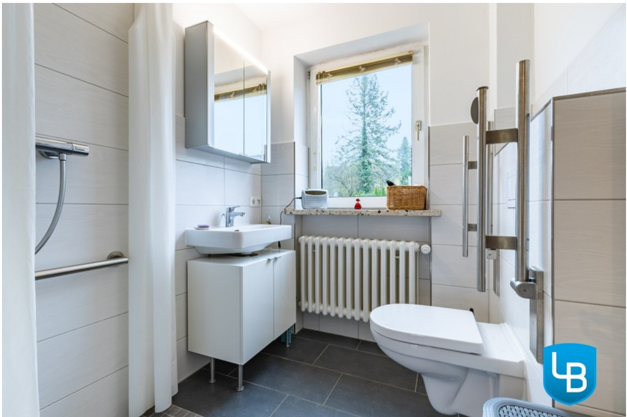
Modernes Duschbad mit WC