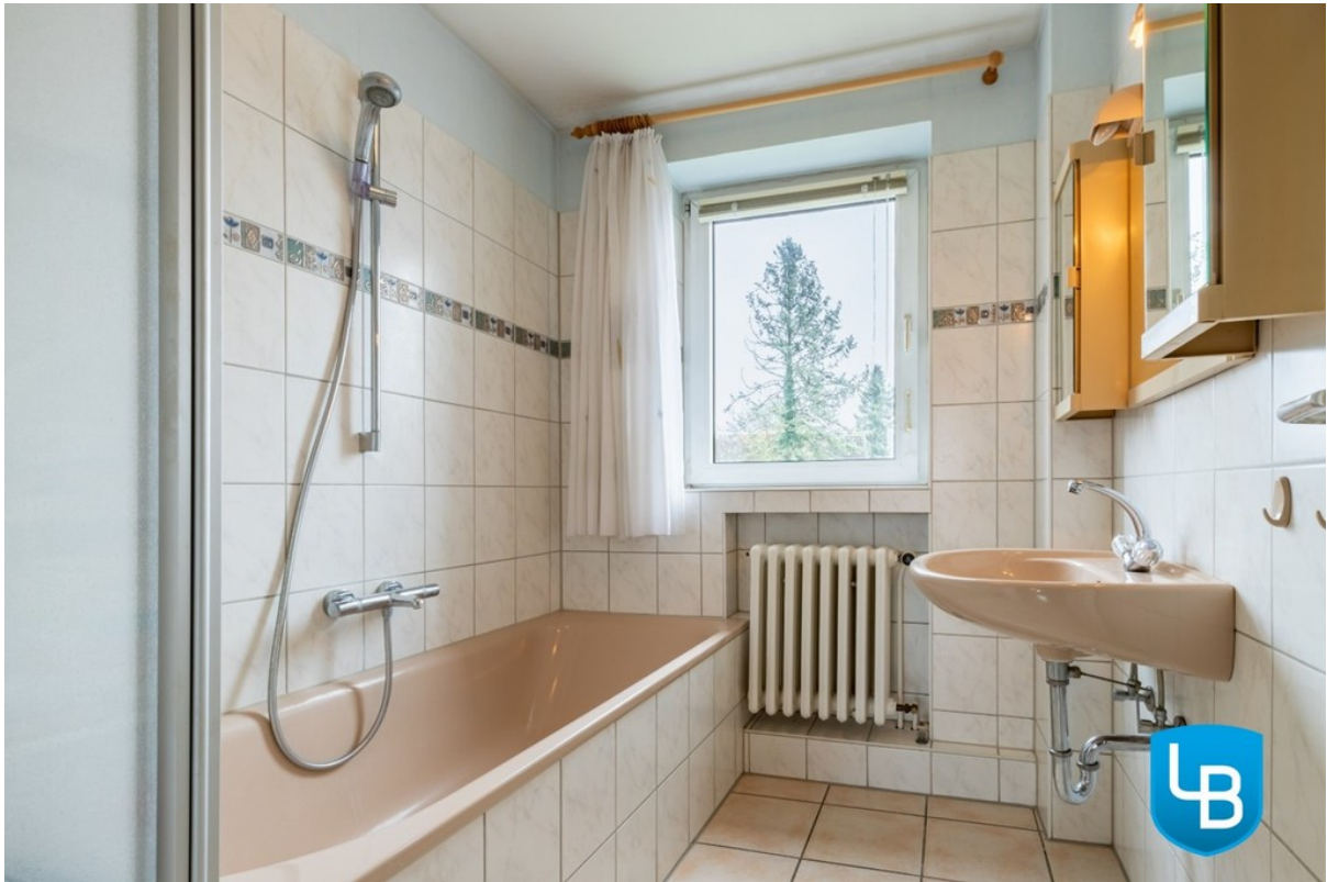
Wannenbad im Dachgeschoss