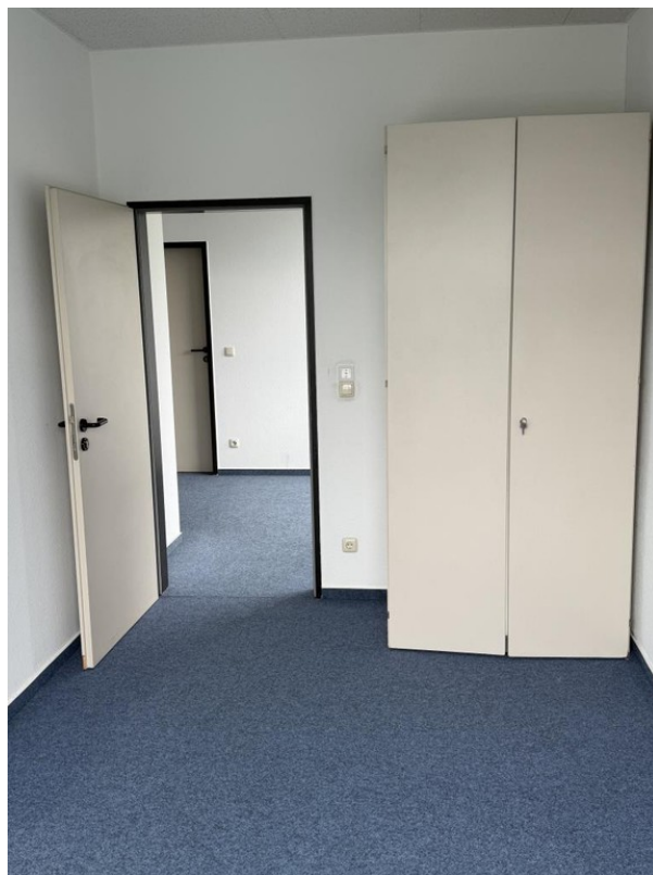
Büro 6 Eingang