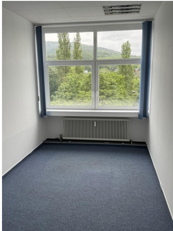
Büro 6 separat zu mieten