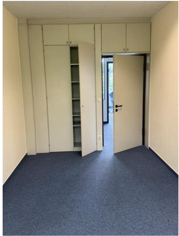
Büro 3 Eingang