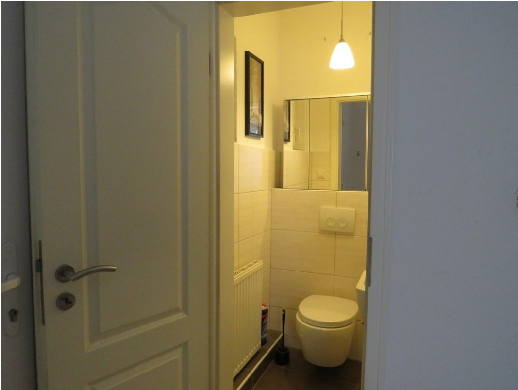
WC Wohnung B