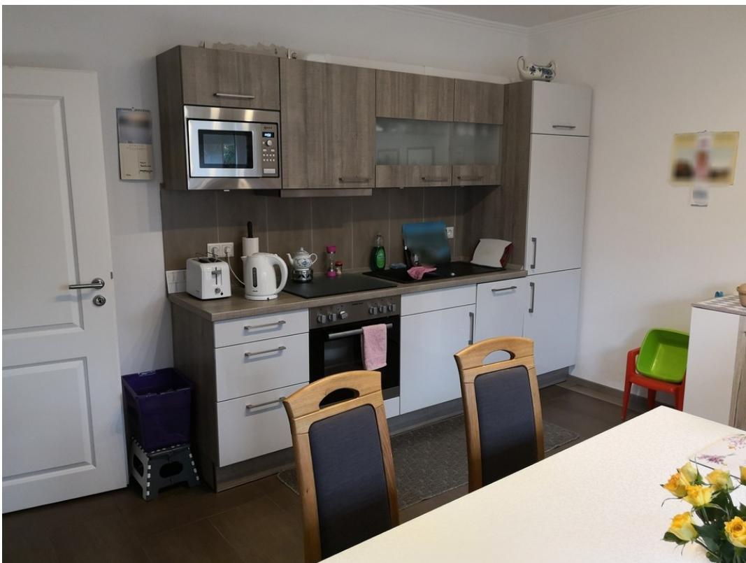
Küche Wohnung C