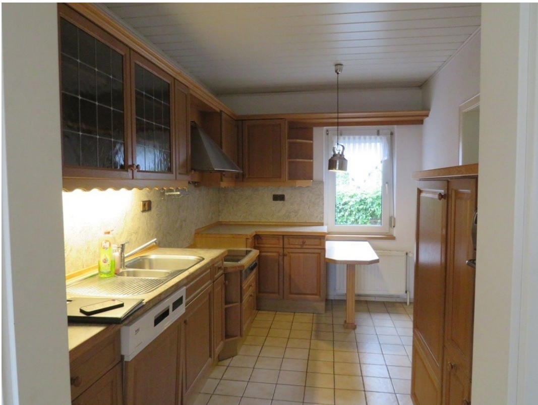
Küche Wohnung B