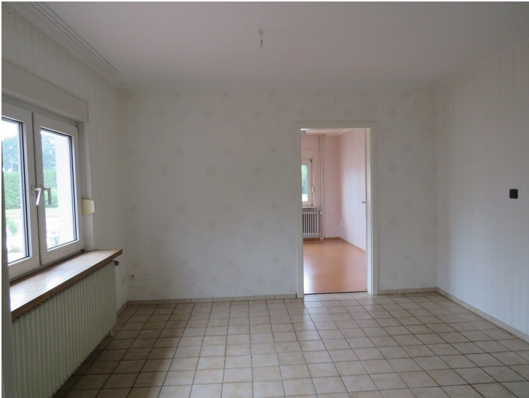
Wohn/Essbereich Wohnung B