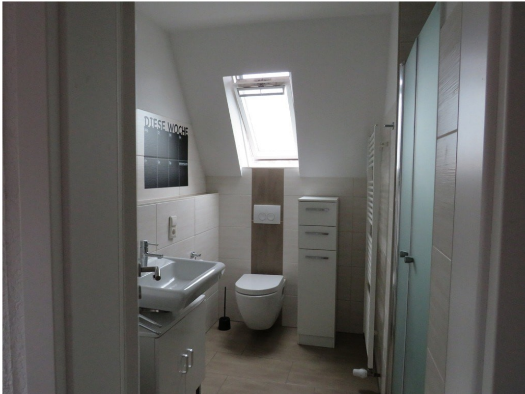
WC Wohnung B