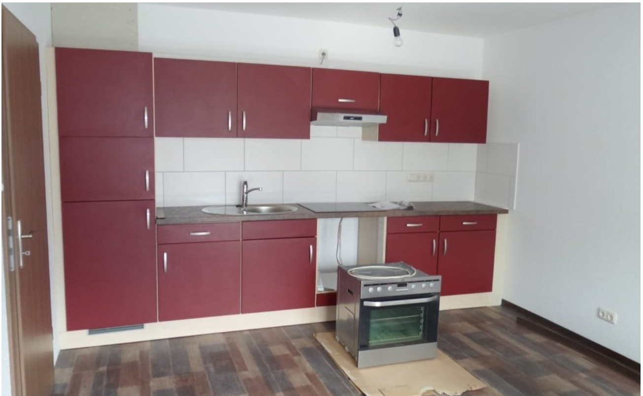
Küche Wohnung A