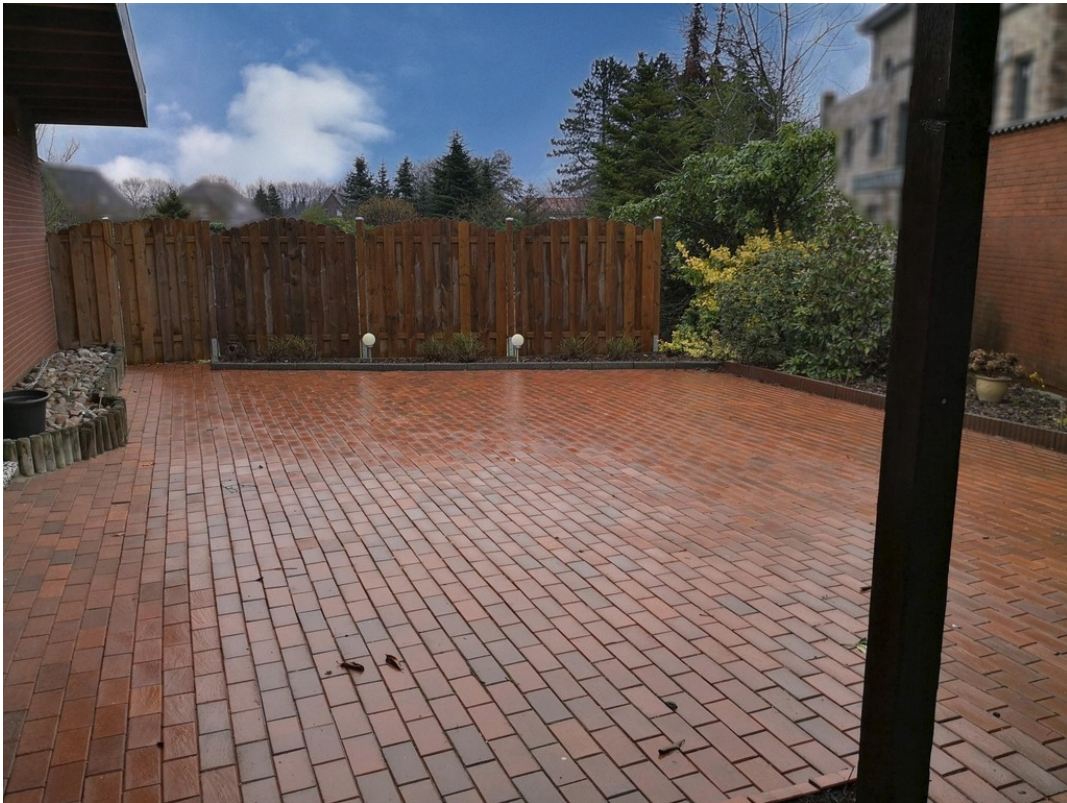
Terrasse Wohnung C