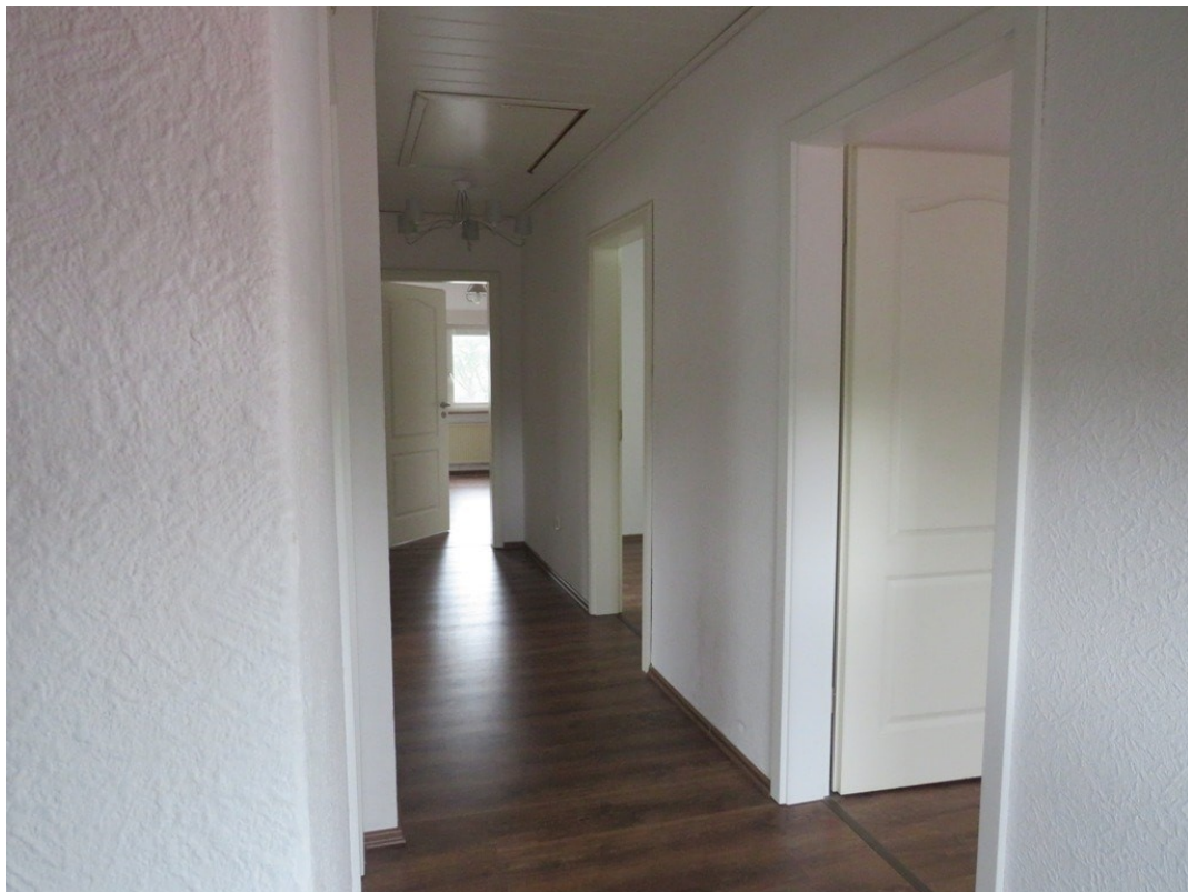
Flur Wohnung B