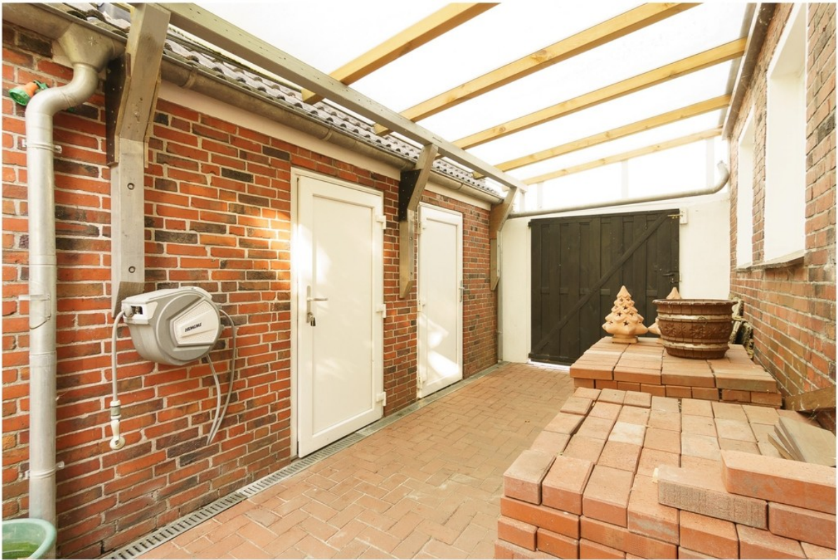
Überdachung zwischen Haus & NG