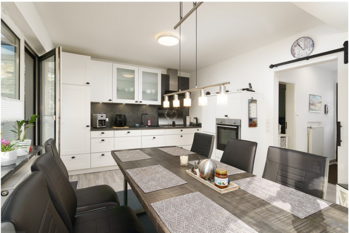
Essbereich mit Terrassenzugang