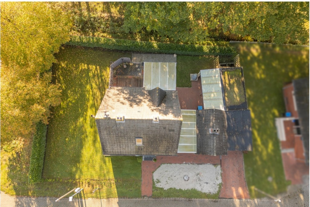
Objekt von oben