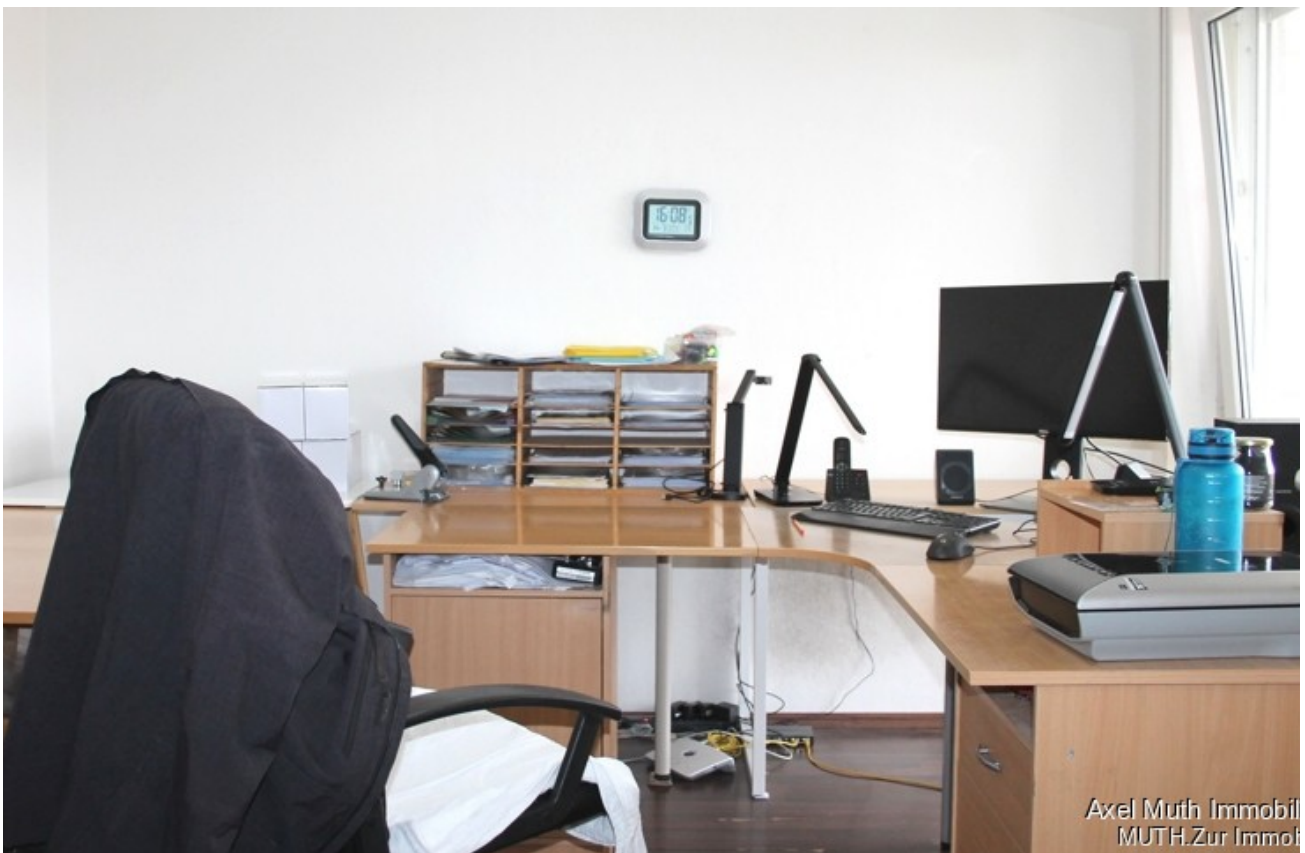
Büro mit Balkonzugang