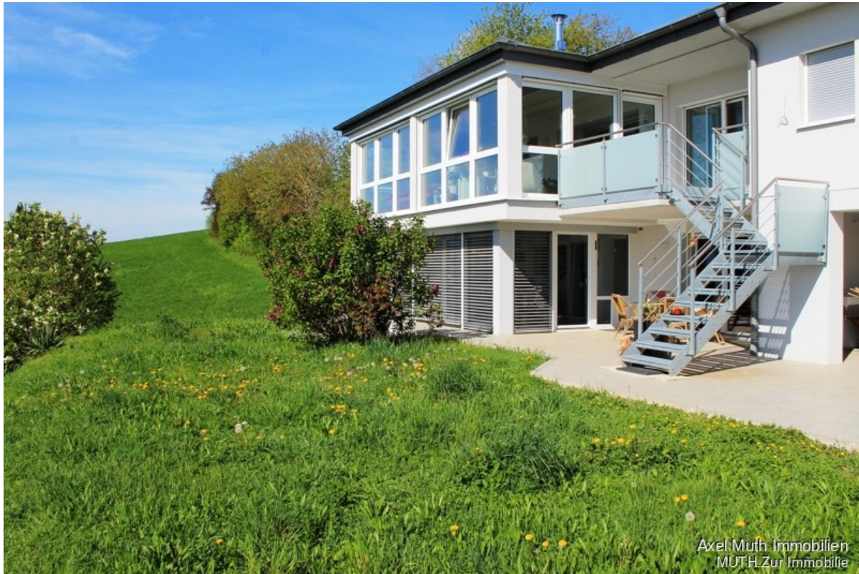
Zwei erstklassige Etagen