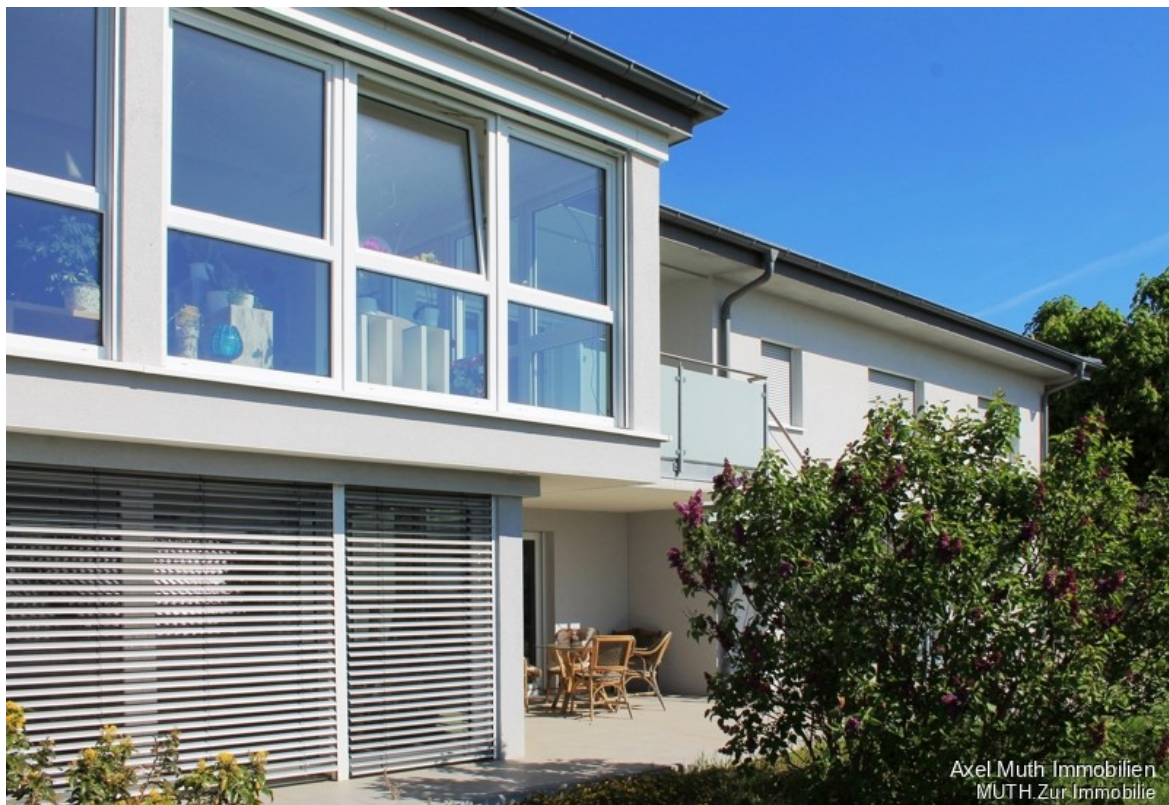
Grosse Fensterflächen auch in