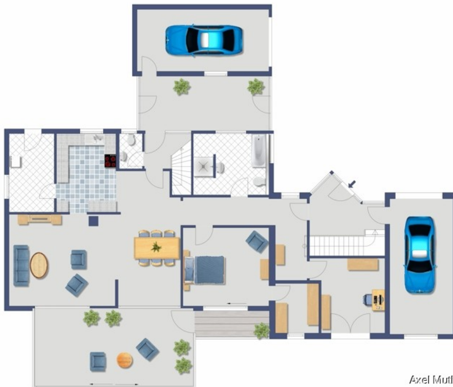
Terrasse bei der Bibliothek