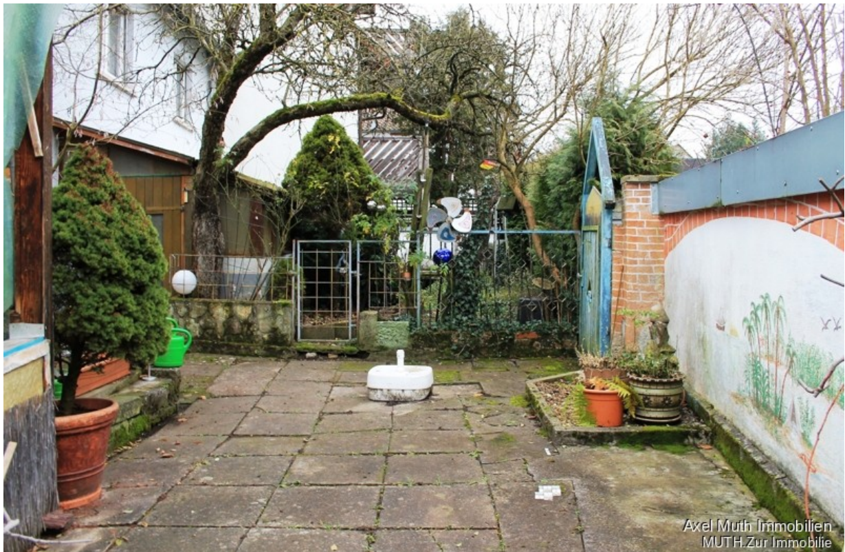
Luftiger und ruhiger Platz