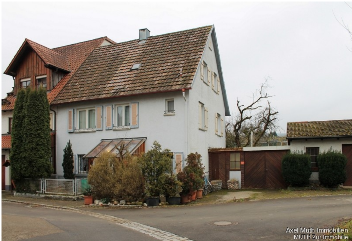
Mit Garagen direkt am Haus