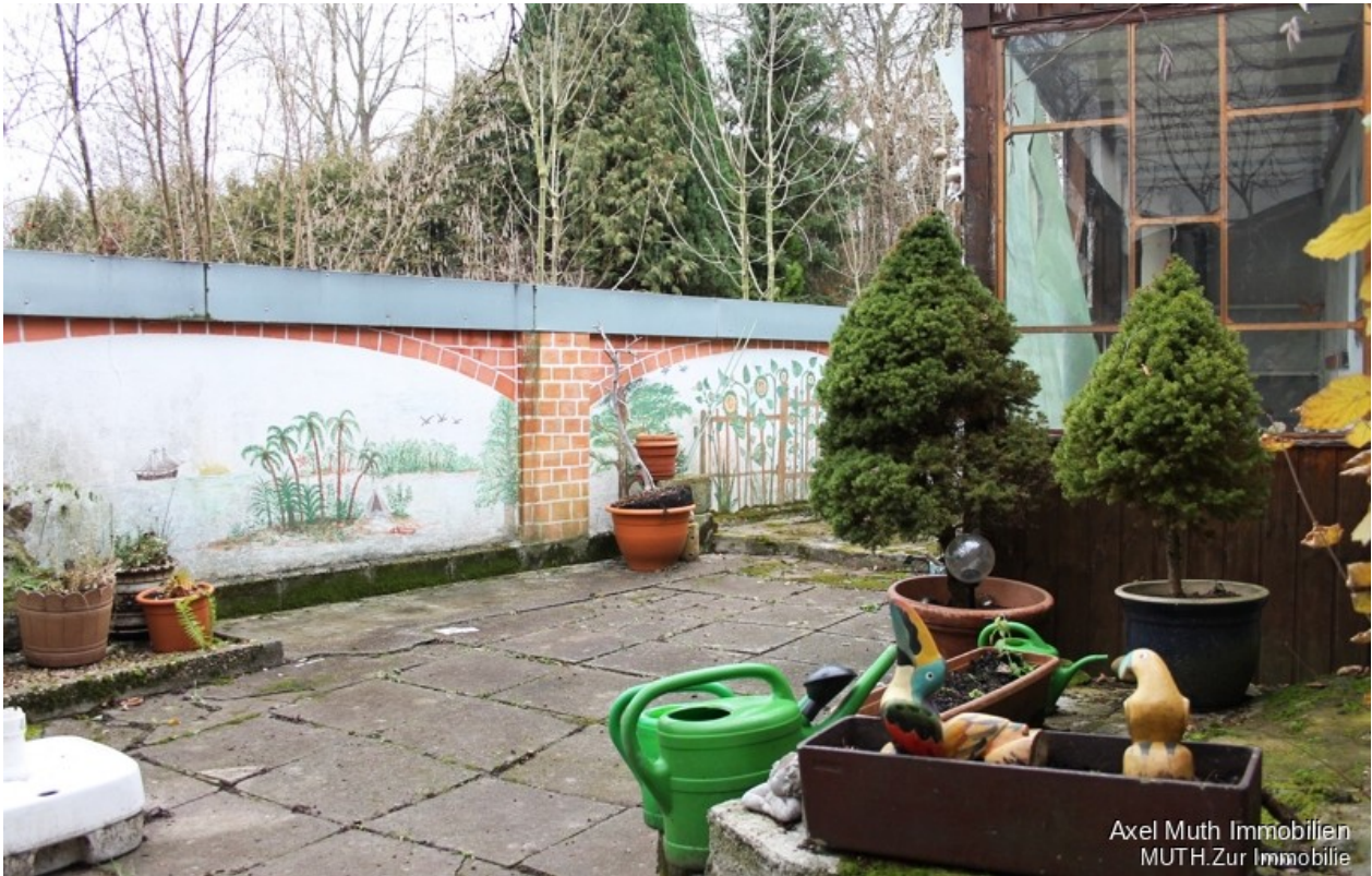
Freisitz hinter dem Haus