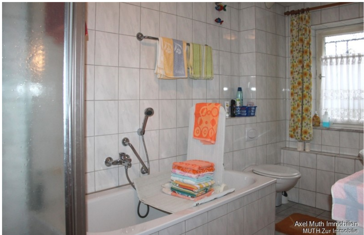
Bad mit Dusche und Wanne