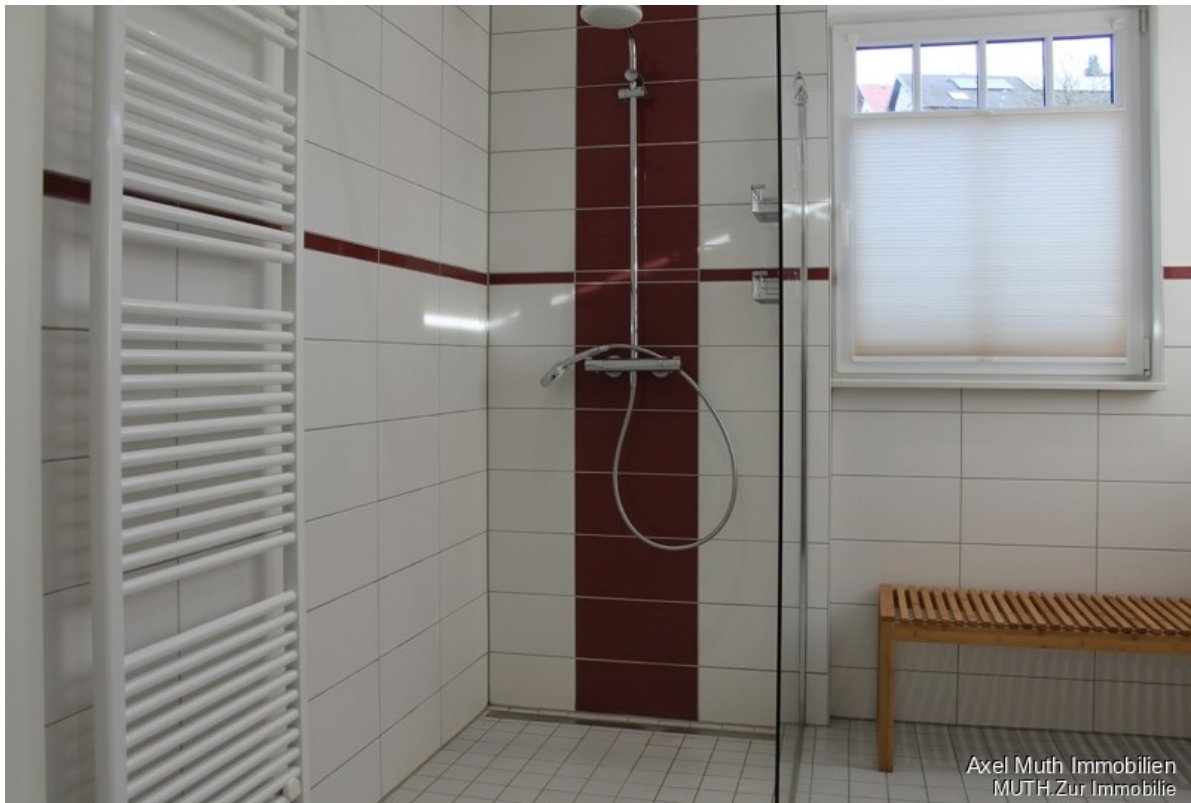
Mit barrierefreier Dusche