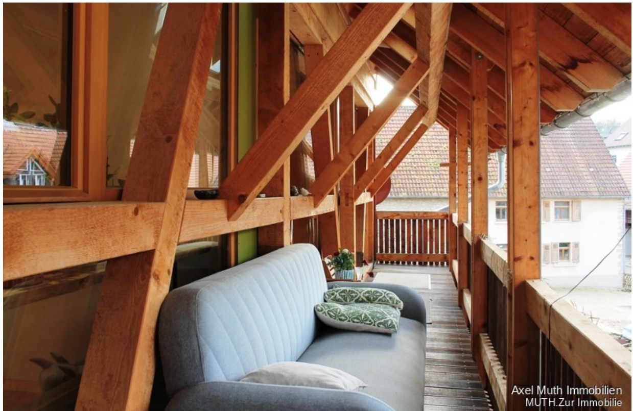
Veranda mit Ausblick