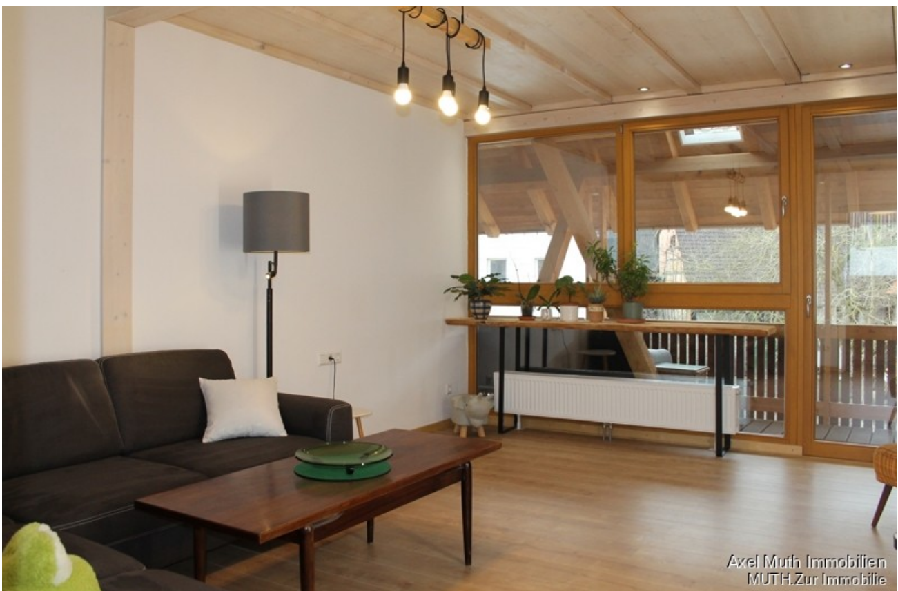
Wohnzimmer mit Veranda