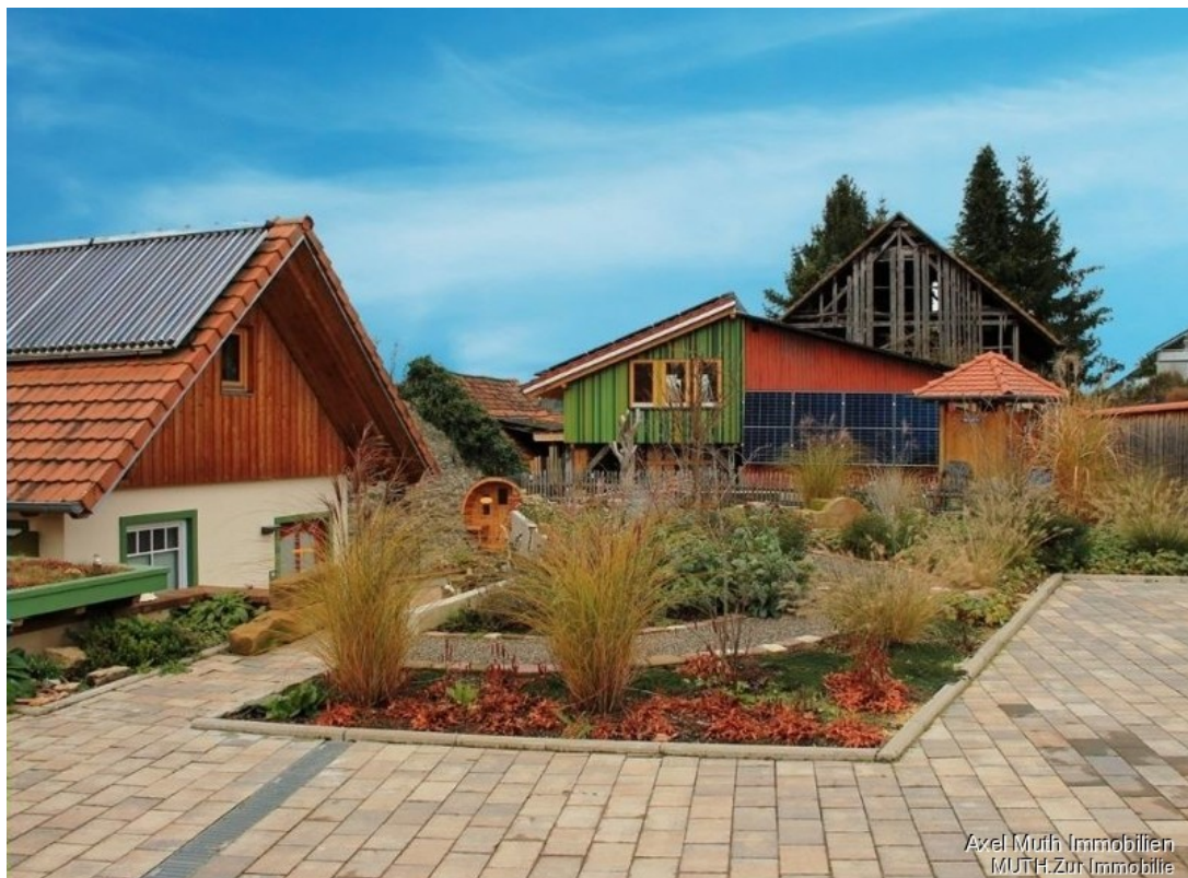
Haus mit Staudengarten