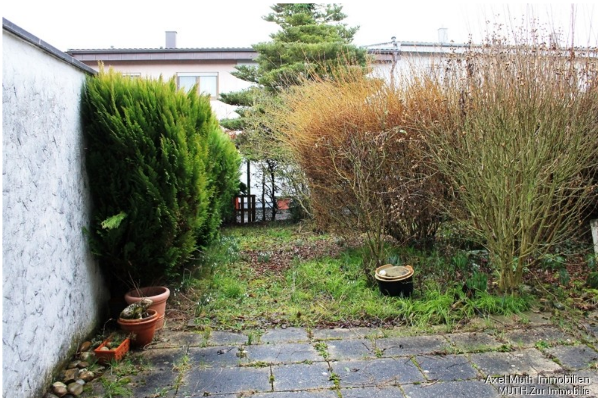
Terrasse mit Garten