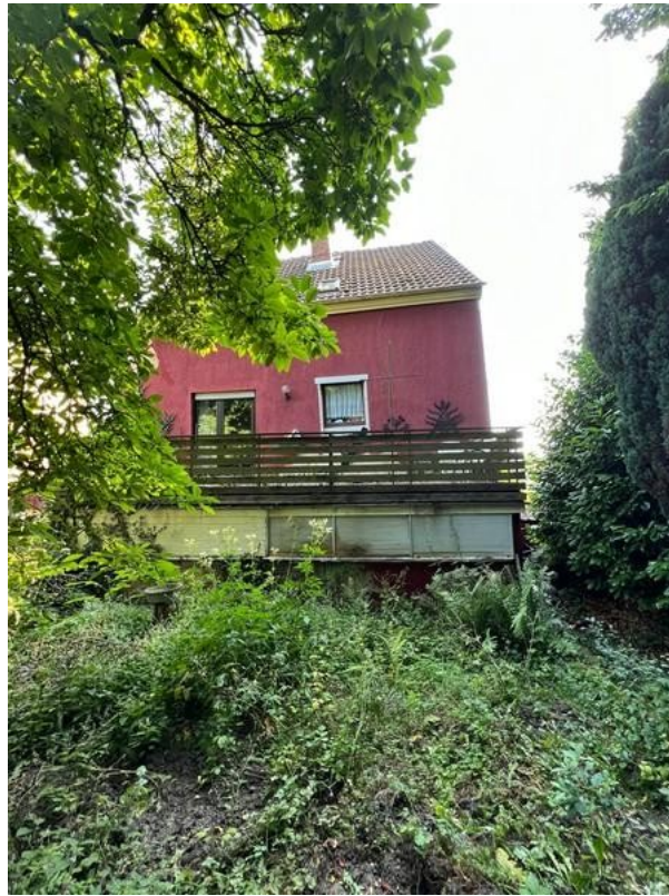
11 Garten tg. Haus