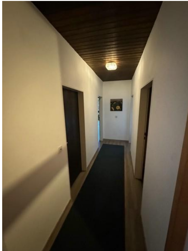
7 Flur im DG