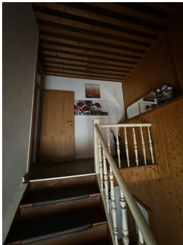
6 Innentreppe zum DG