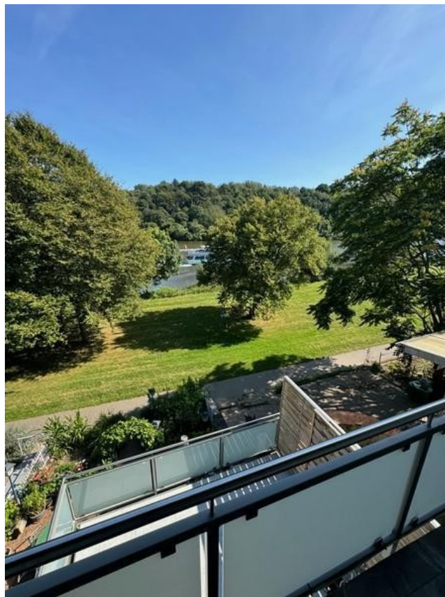
1 Blick zur Mosel vom Balkon