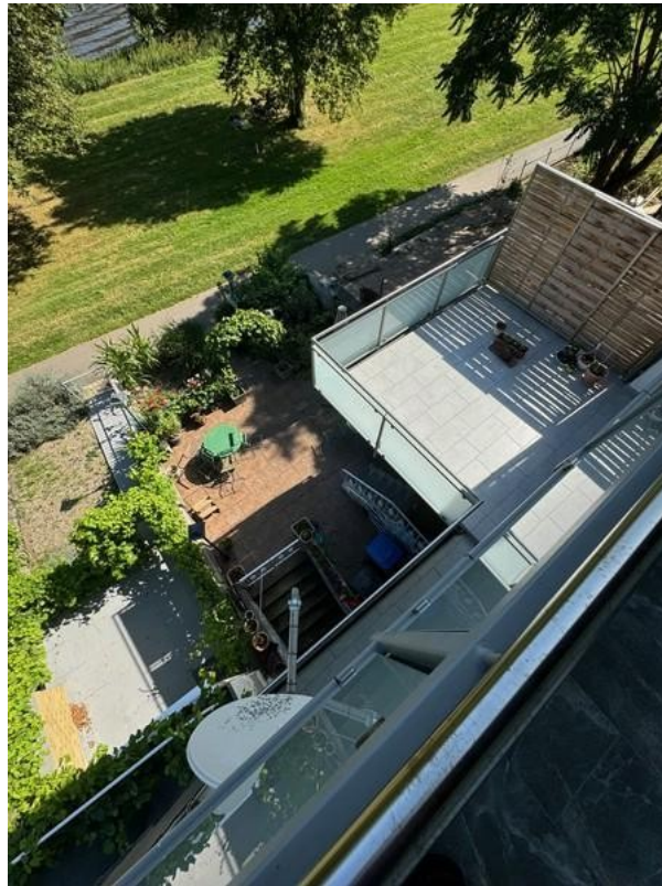
4 Blick zum Balkon OG und Terr