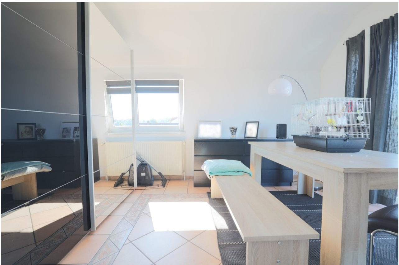
Essplatz im Wohnbereich