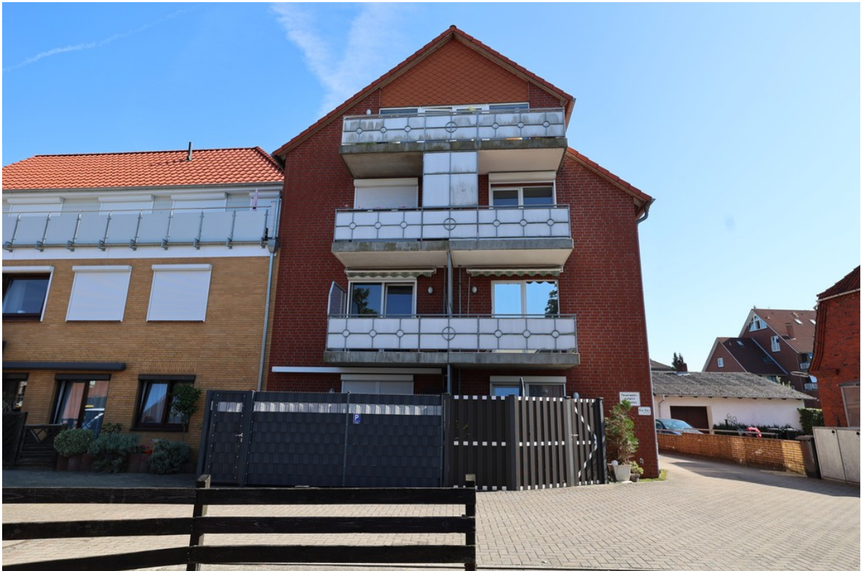
Hausansicht von der Straße