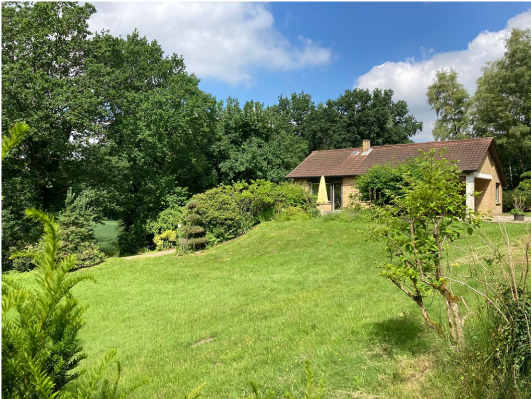
Erhöhte Lage Privatsphäre