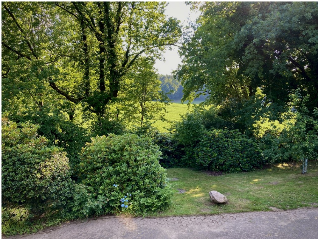
Ihr Blick in die Ferne