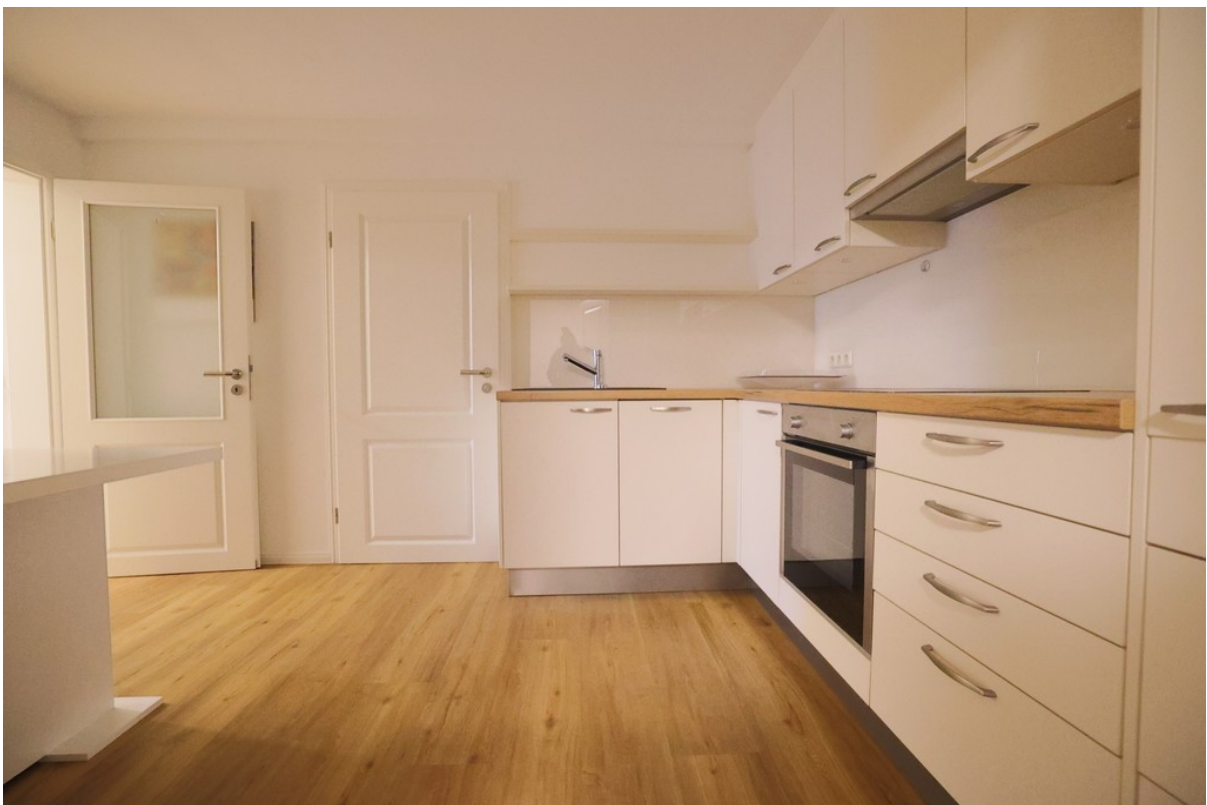
Küche im UG