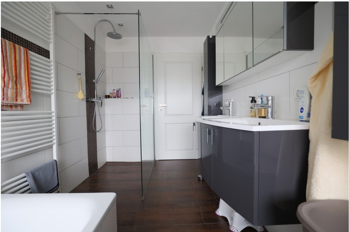
Badzimmer mit Dusche und Badew