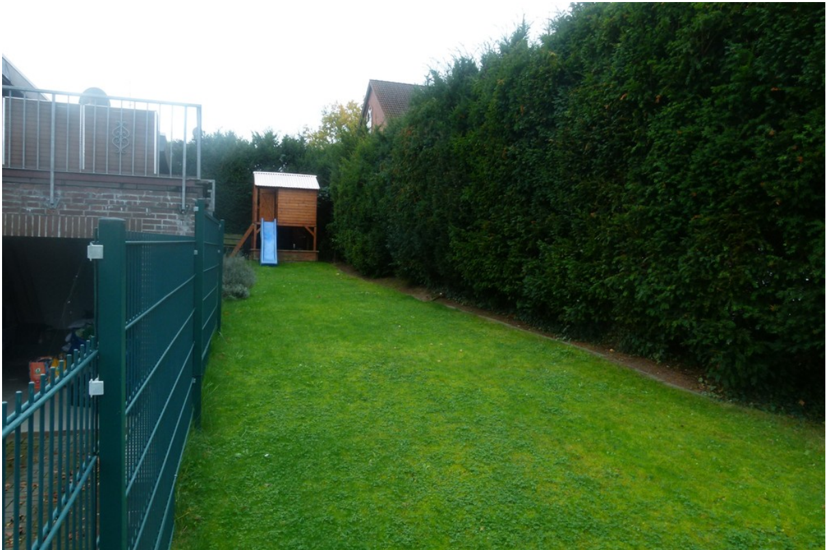
Blick in den Garten