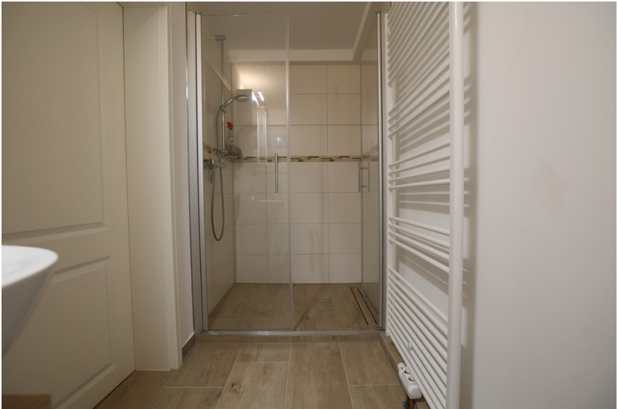
Duschbad im UG