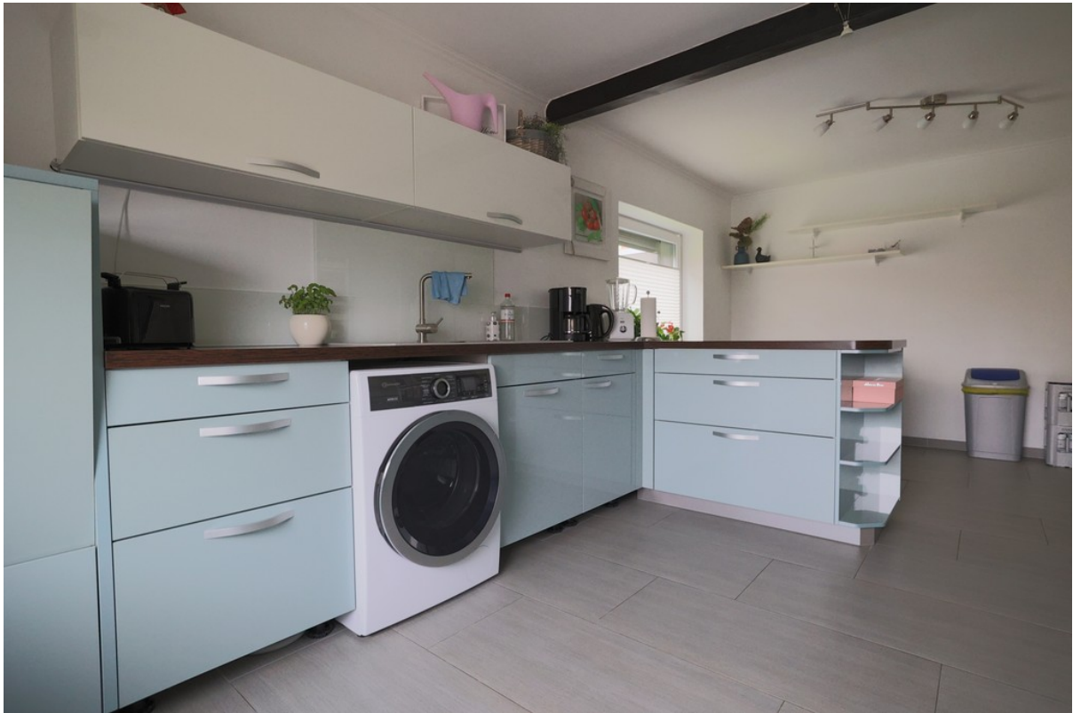
Küche mit Eßplatz