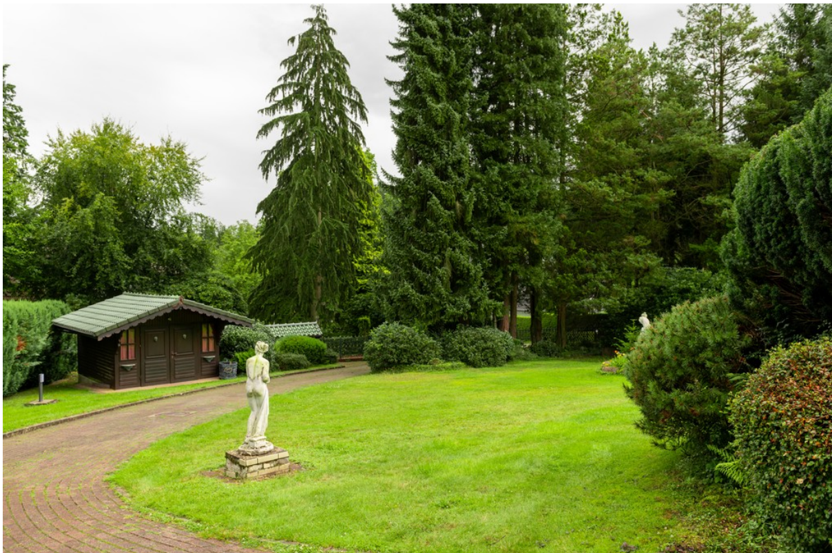
Auffahrt mit Garten