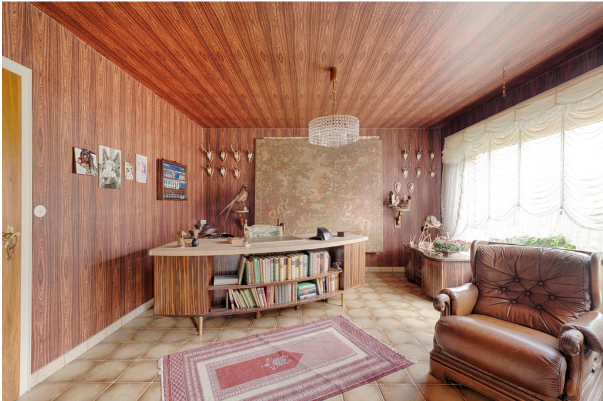
Büro mit Anbindung zum Wohnbereich