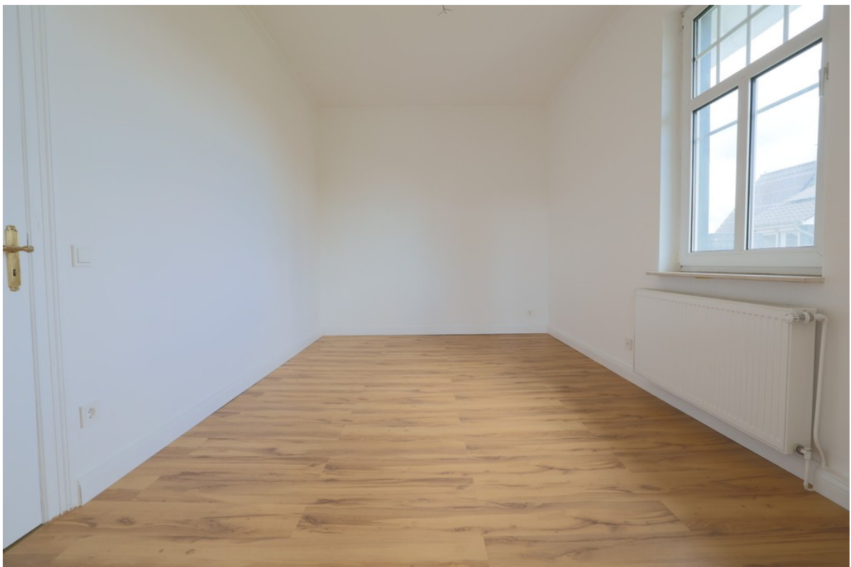
Zimmerbeispiel im Obergeschoss