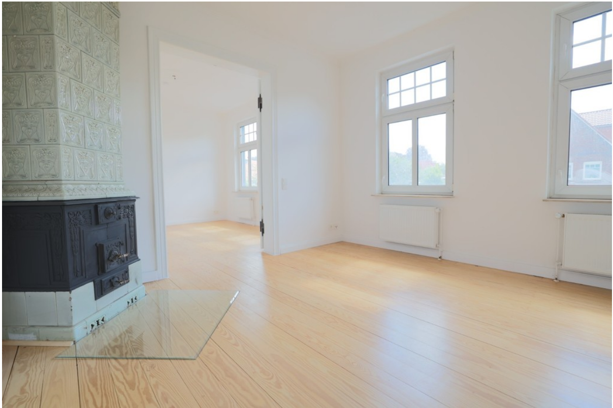
Schöner, heller Wohn/-Essbereich