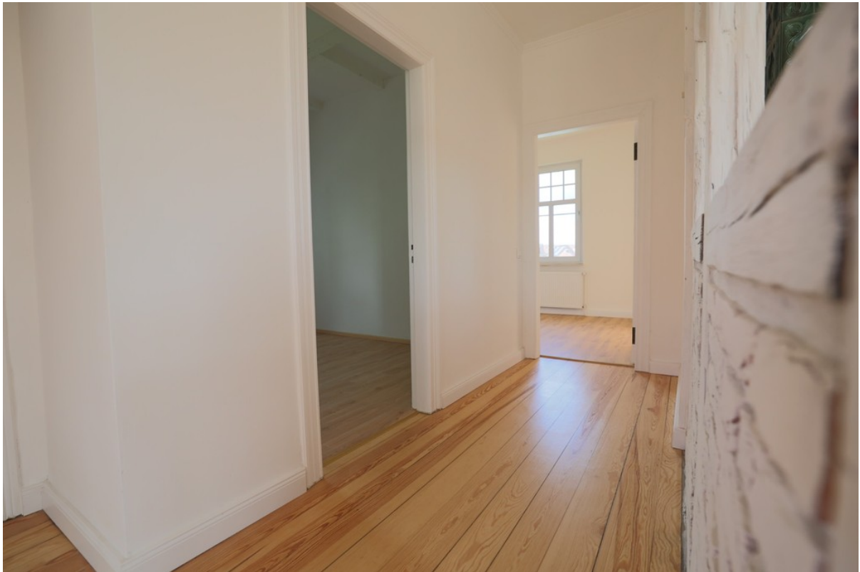
Flur im Obergeschoss