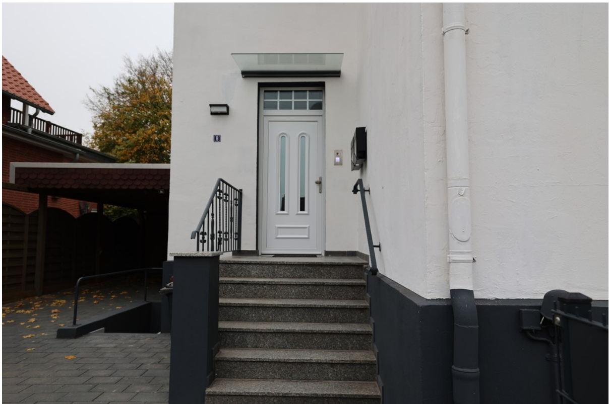
Hauseingang mit neuer Eingangs