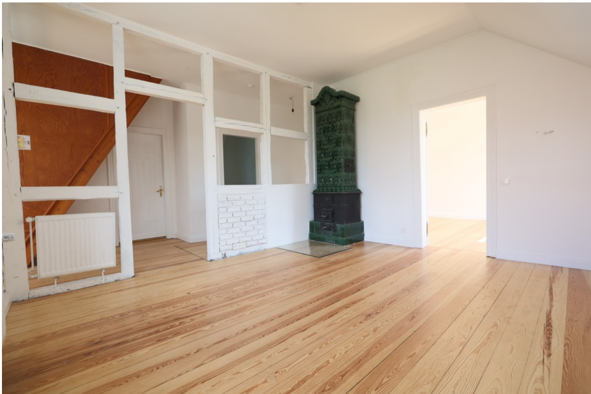
Großzügiger und heller Wohn-/E