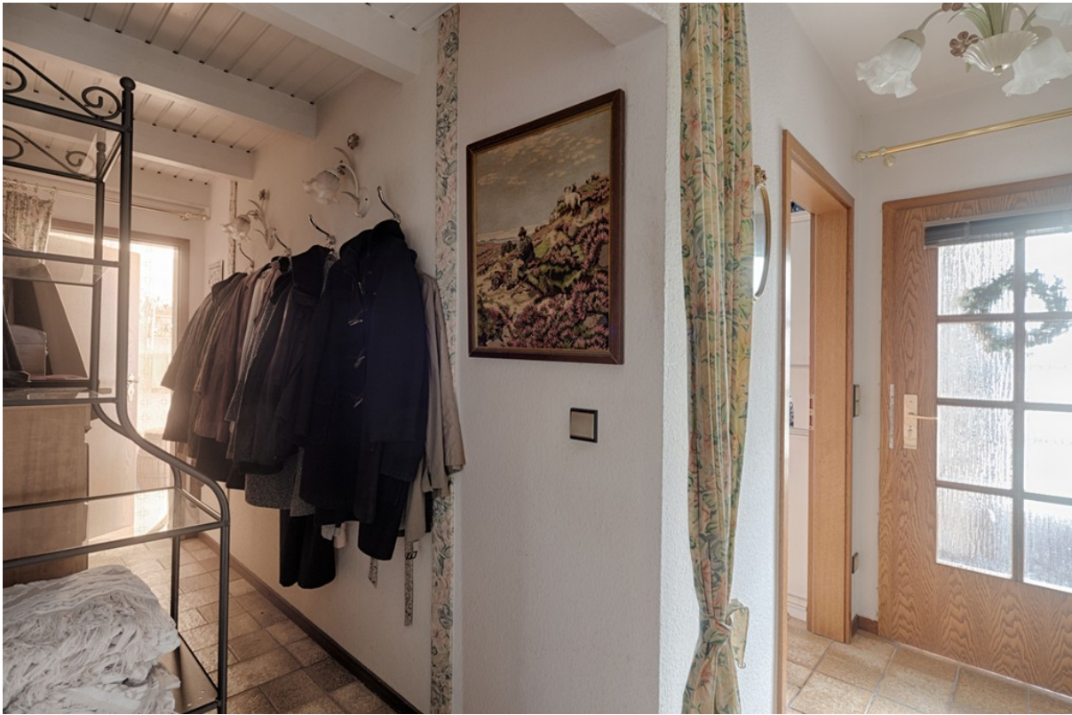
Eingangsbereich und Garderobe