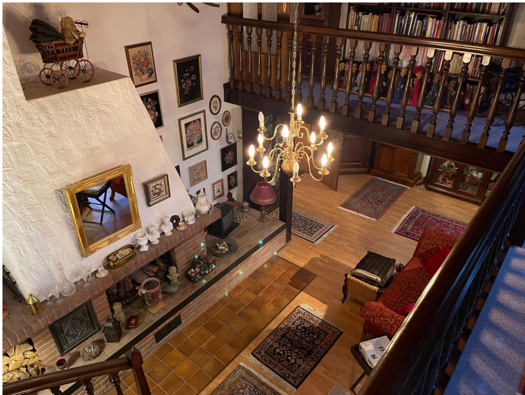
Blick von der Galerie