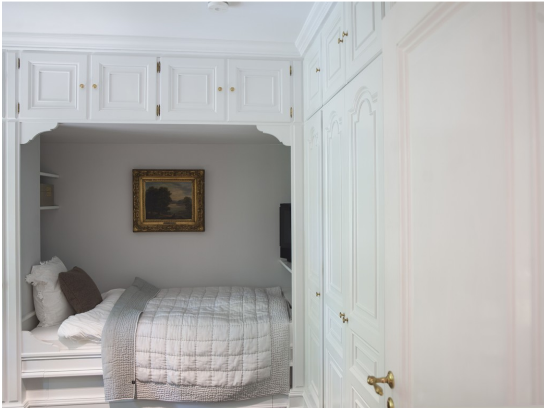
Paradies für kleine Entdecker