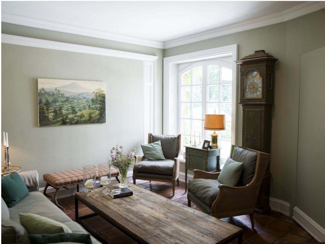
Genügend Raum zur Entfaltung