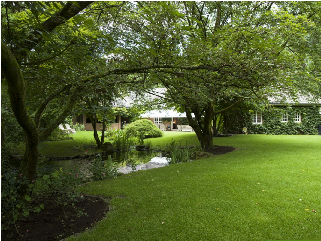
Eingebettet in die Natur