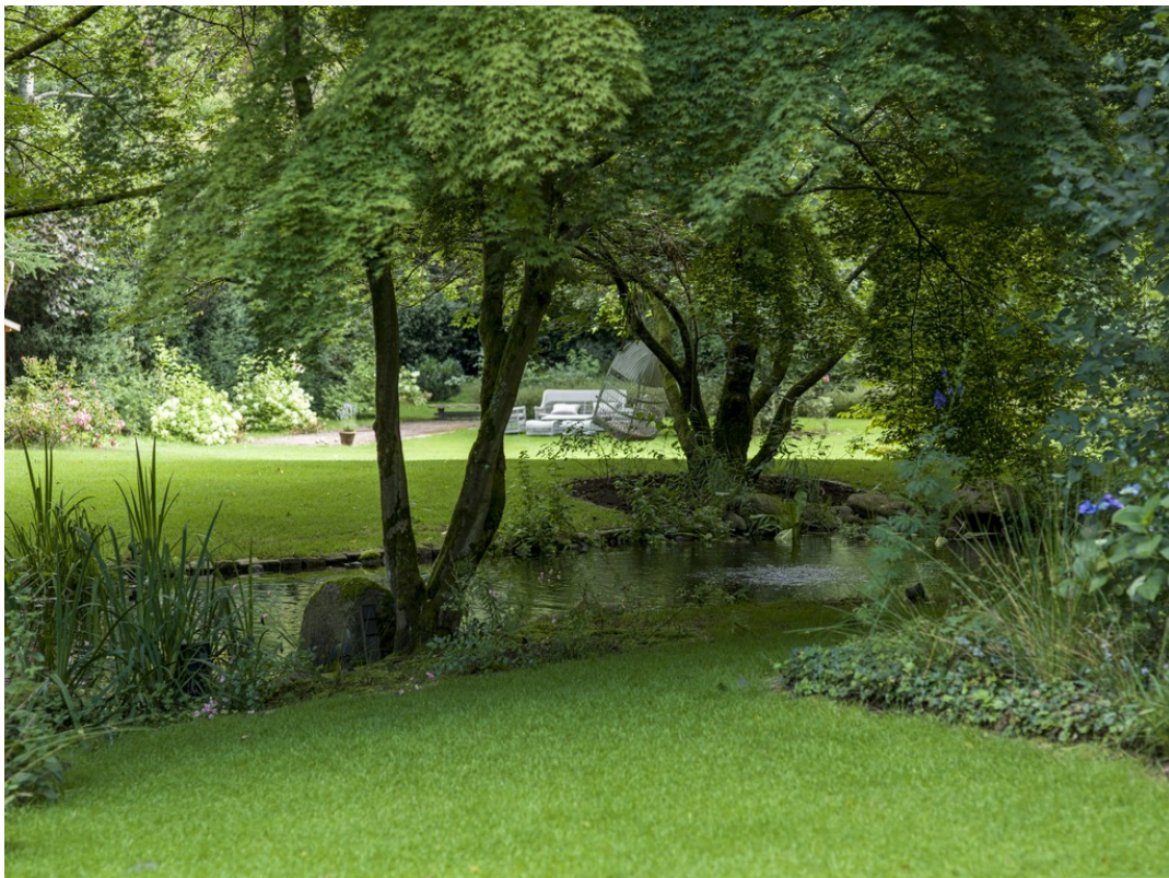
Blick in den Garten mit eigene