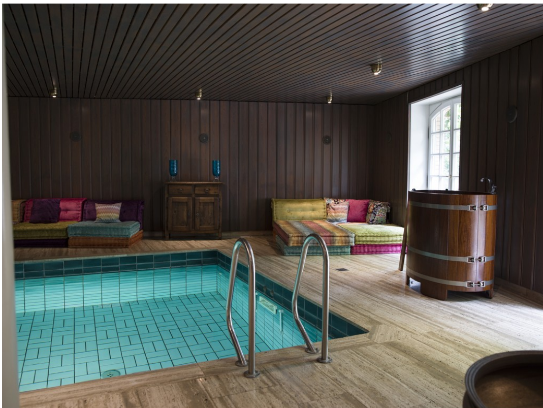
Wellnessbereich im Souterrain