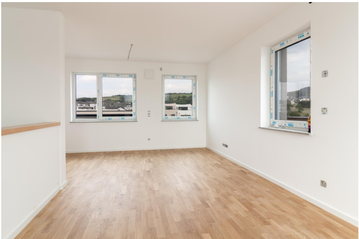
Studio DG 2