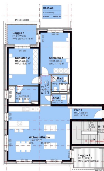
Haus 1 - Wohnung 5, 9, 13