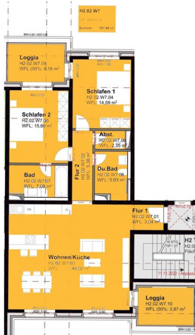
Haus 2 - Wohnung 7, 10