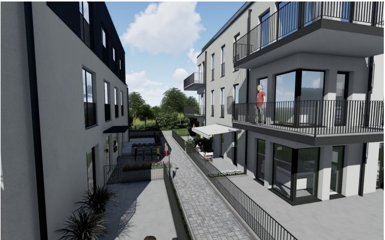
Haus A - C