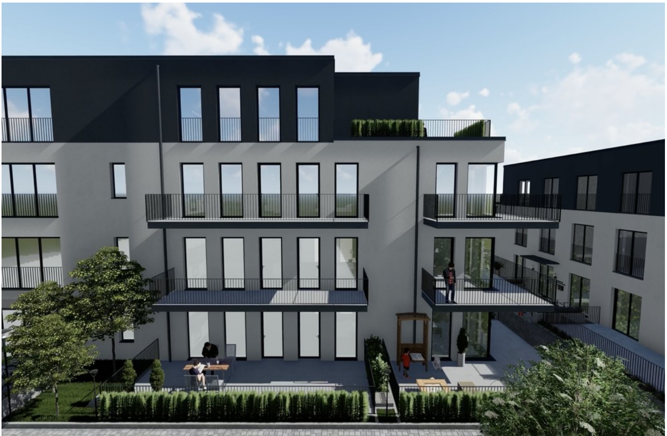
Haus A Eingang 2