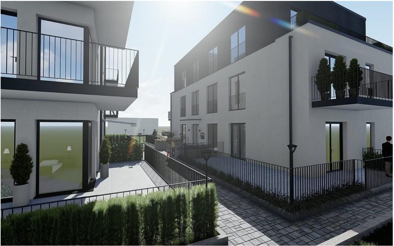
Gebäude A-C Terrassen