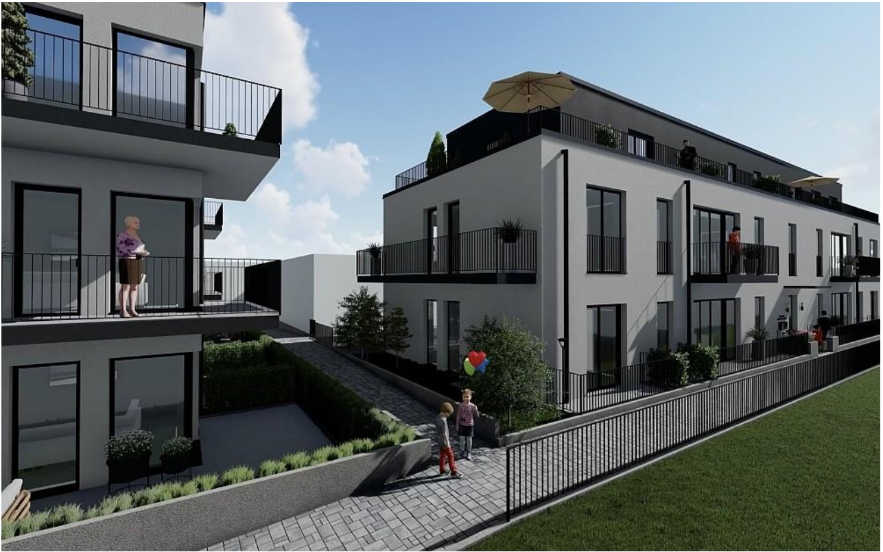
Haus B - A