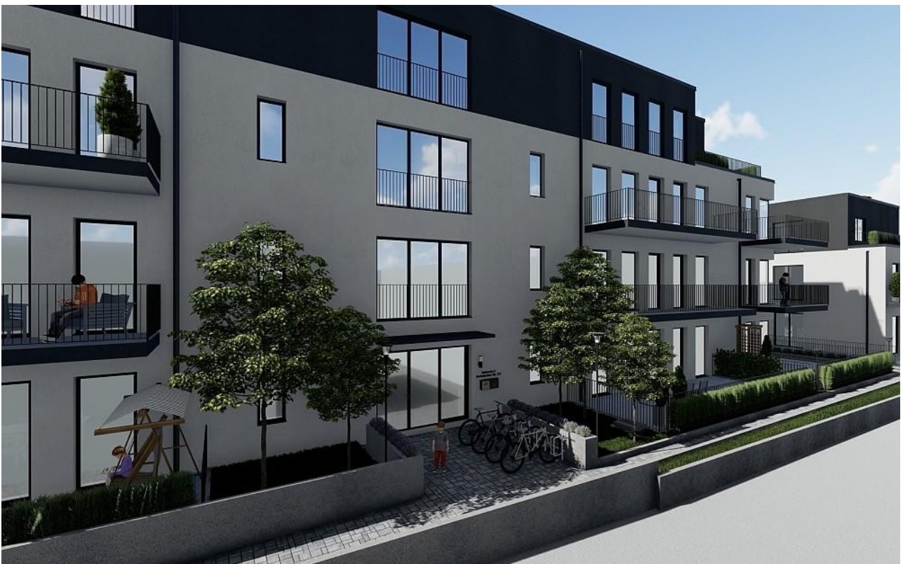
Gebäude A Eingang