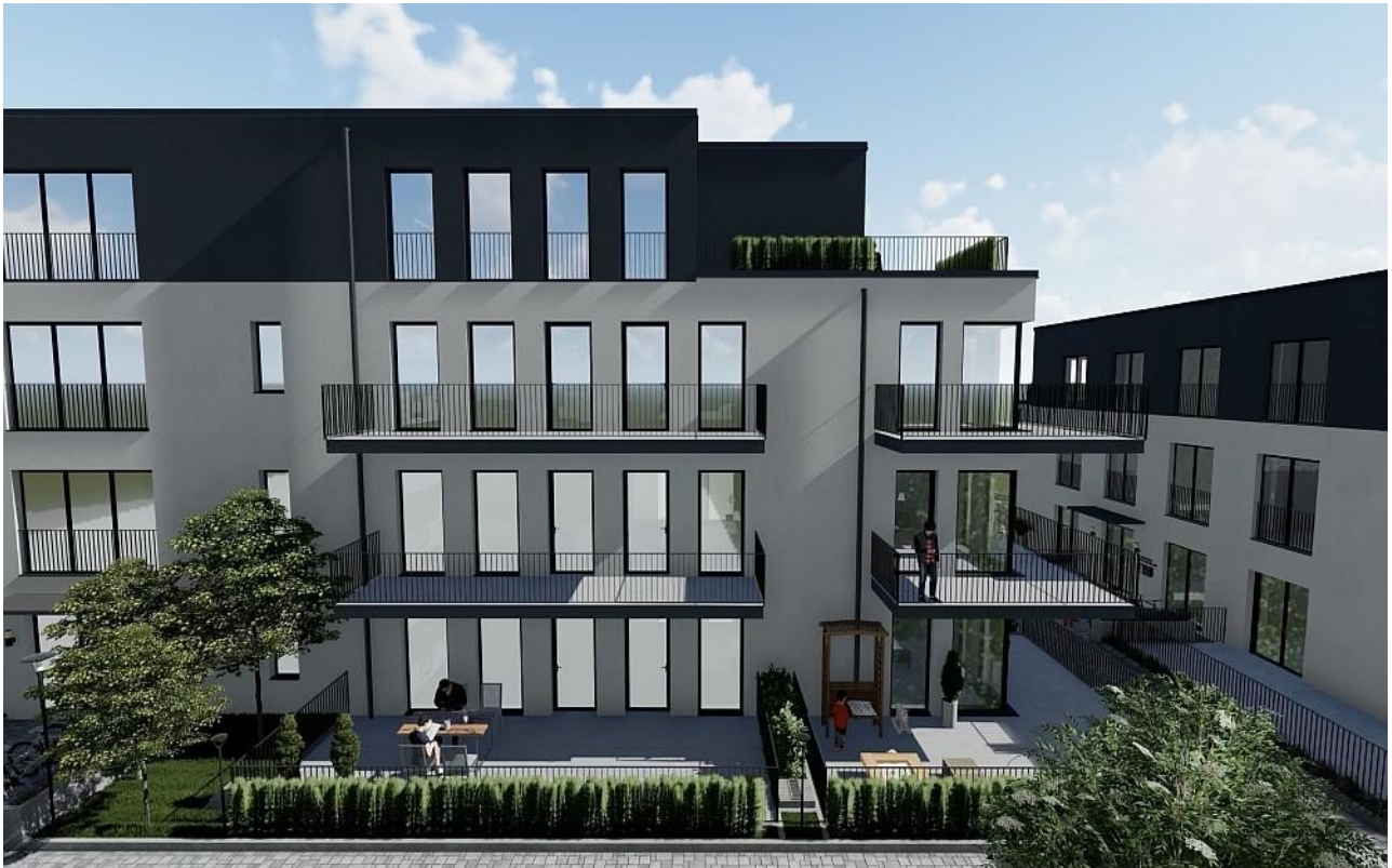
Haus A Eingang 2