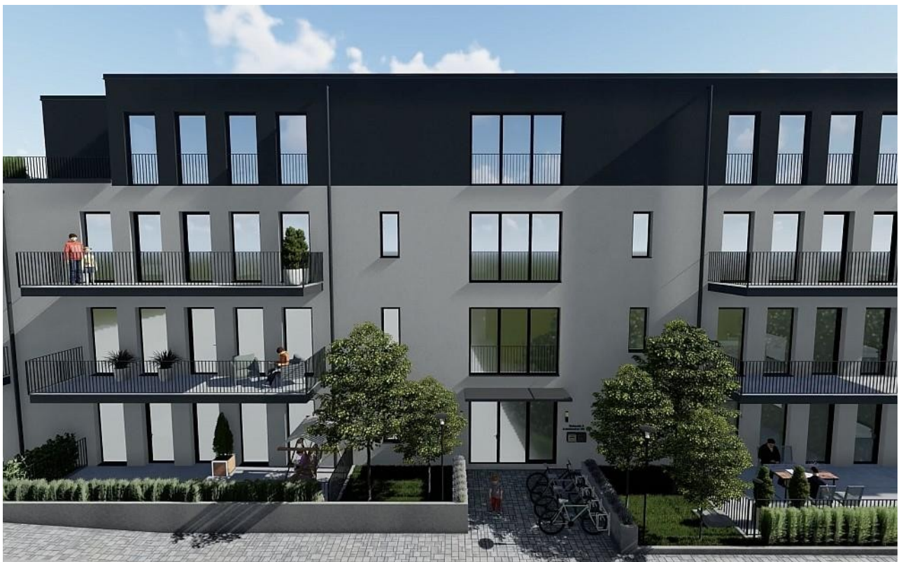
Haus A Eingang 3