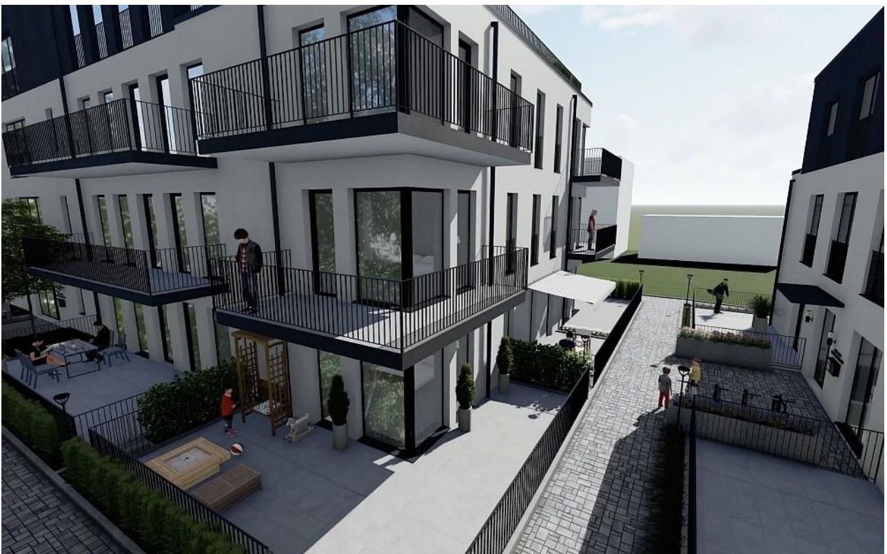
Gebäude A Terrassen