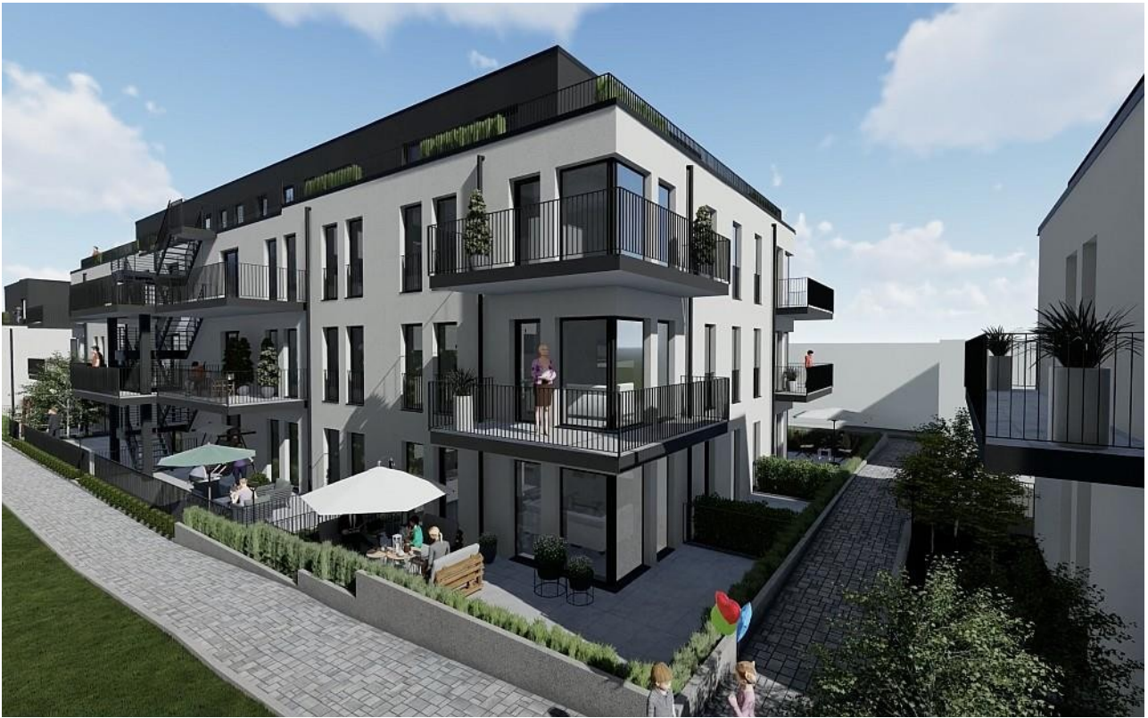
Gebäude A Seitenansicht V