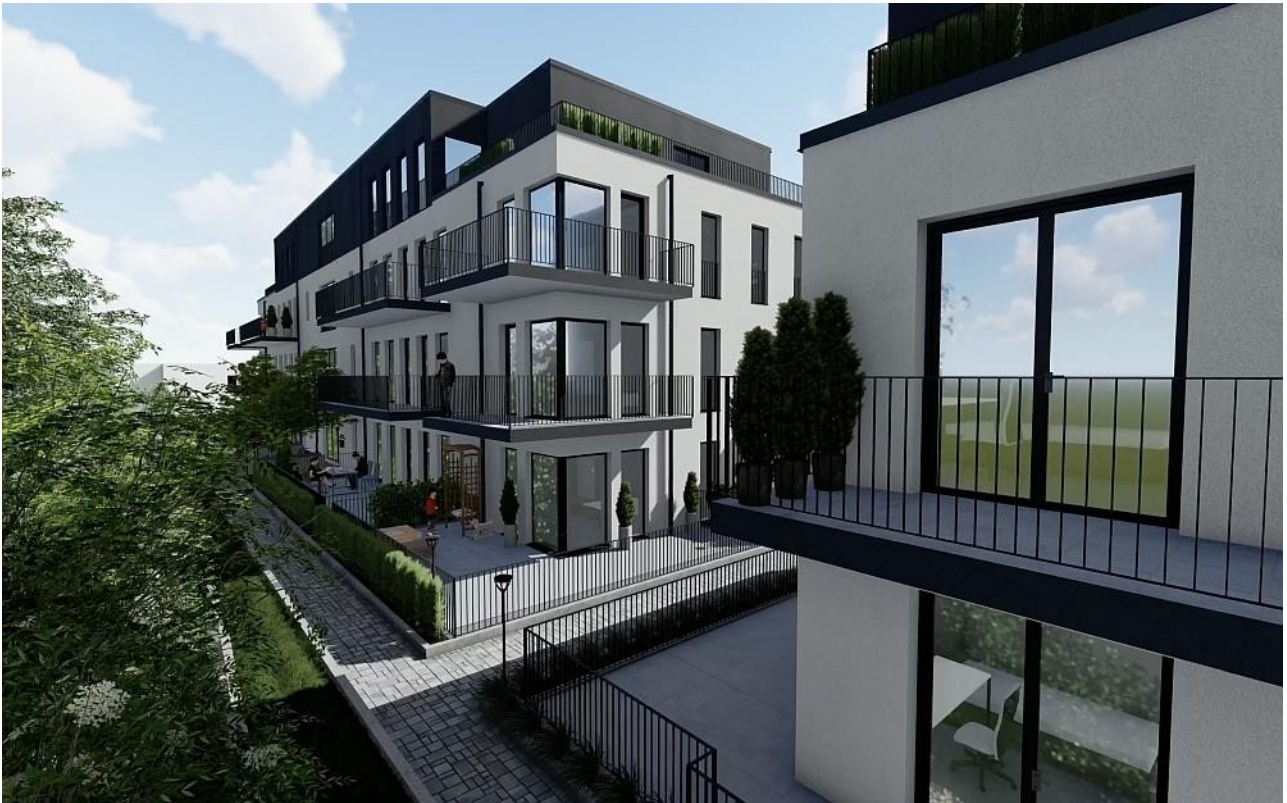
Gebäude A Eckansicht