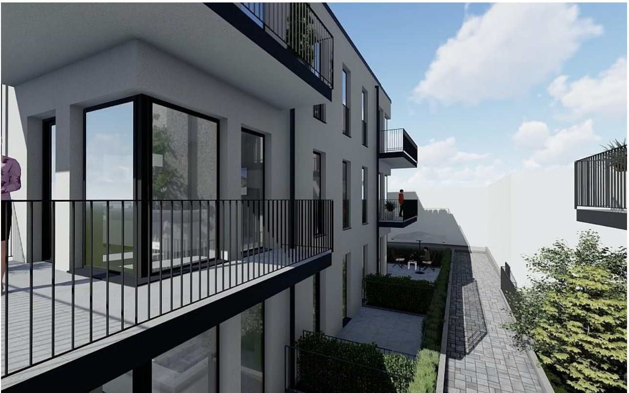
Haus A - Ecke