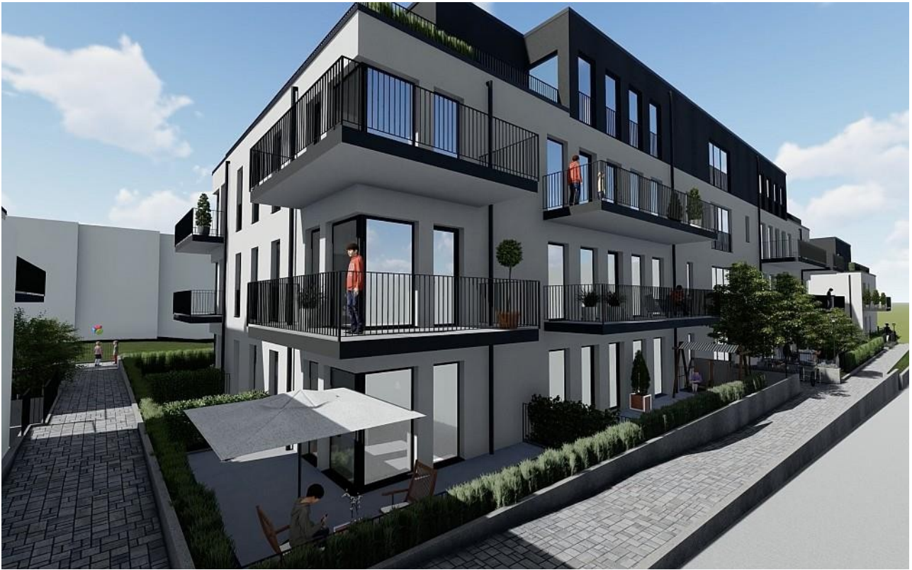
Haus A Seitenansicht Eingang