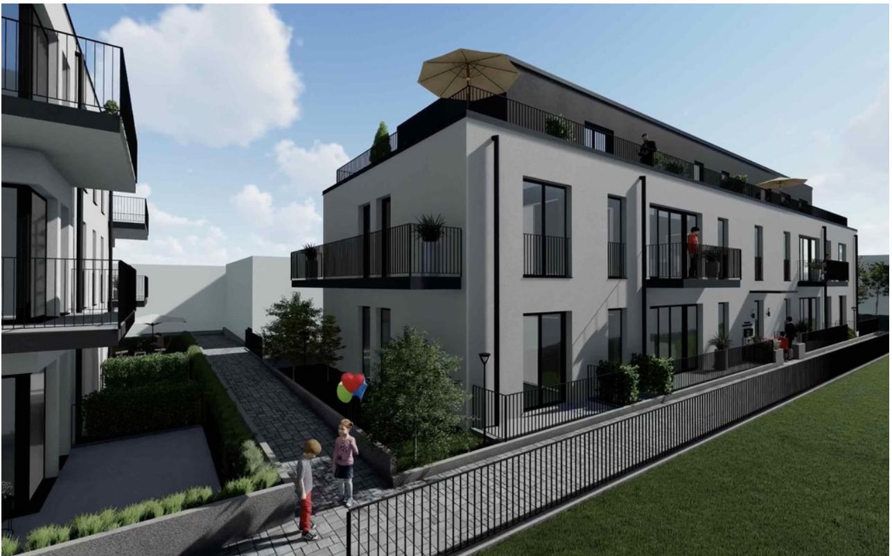
Haus B . Seite