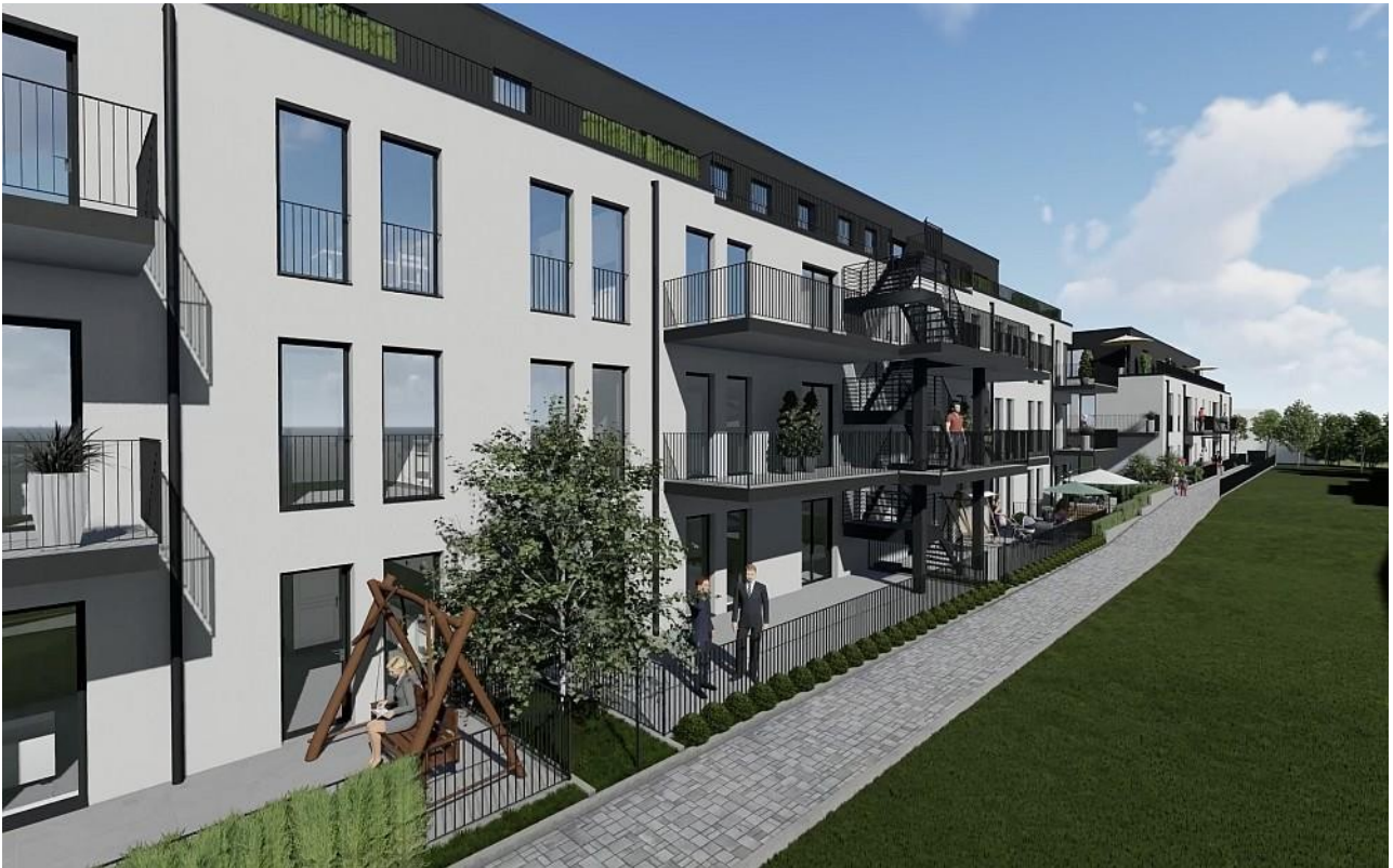
Haus A - B