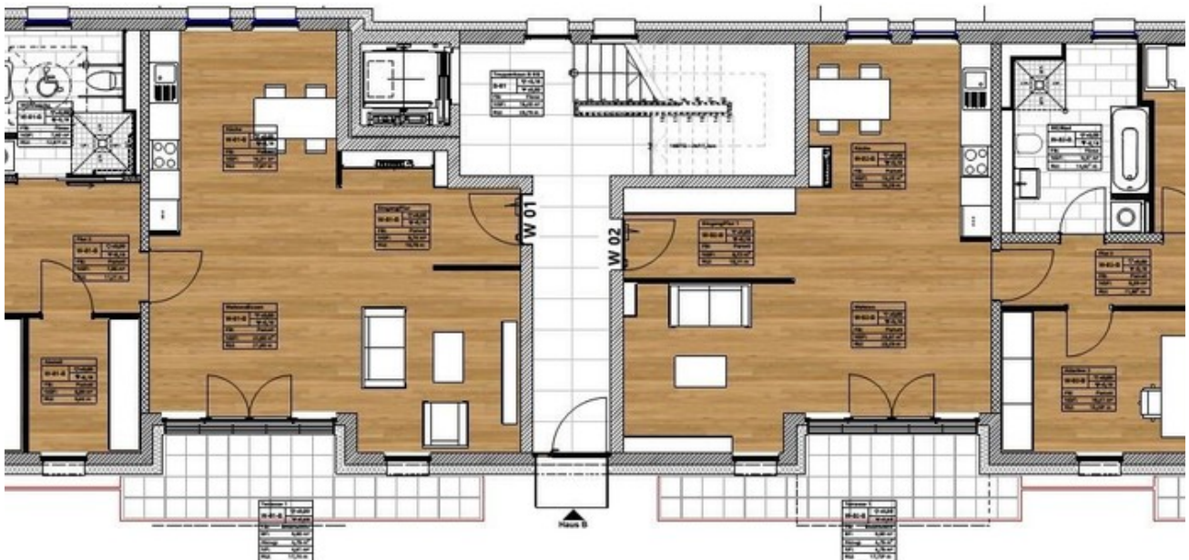
Haus B - Erdgeschoss