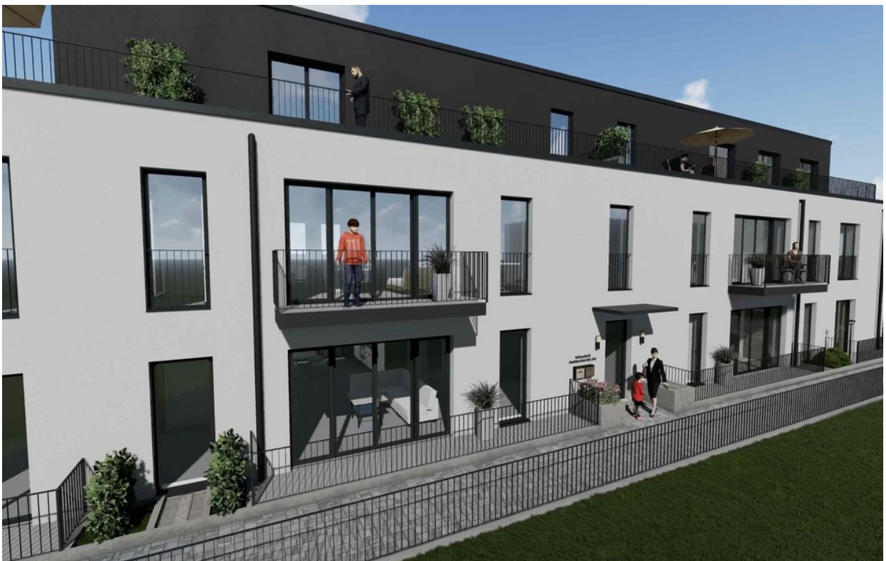
2 Haus B