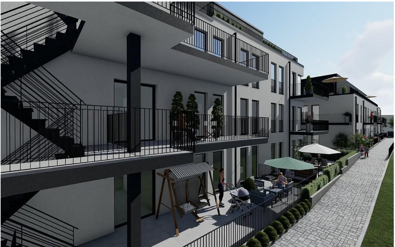
Haus A-B Westen