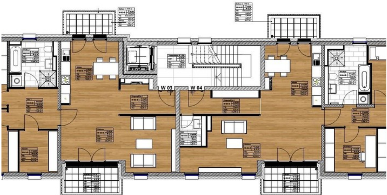
Haus B - 1. Obergeschoss