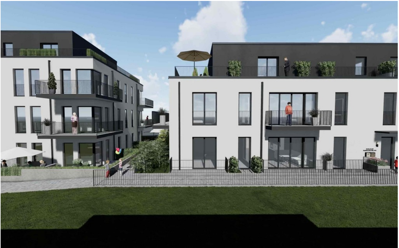
1 Haus B