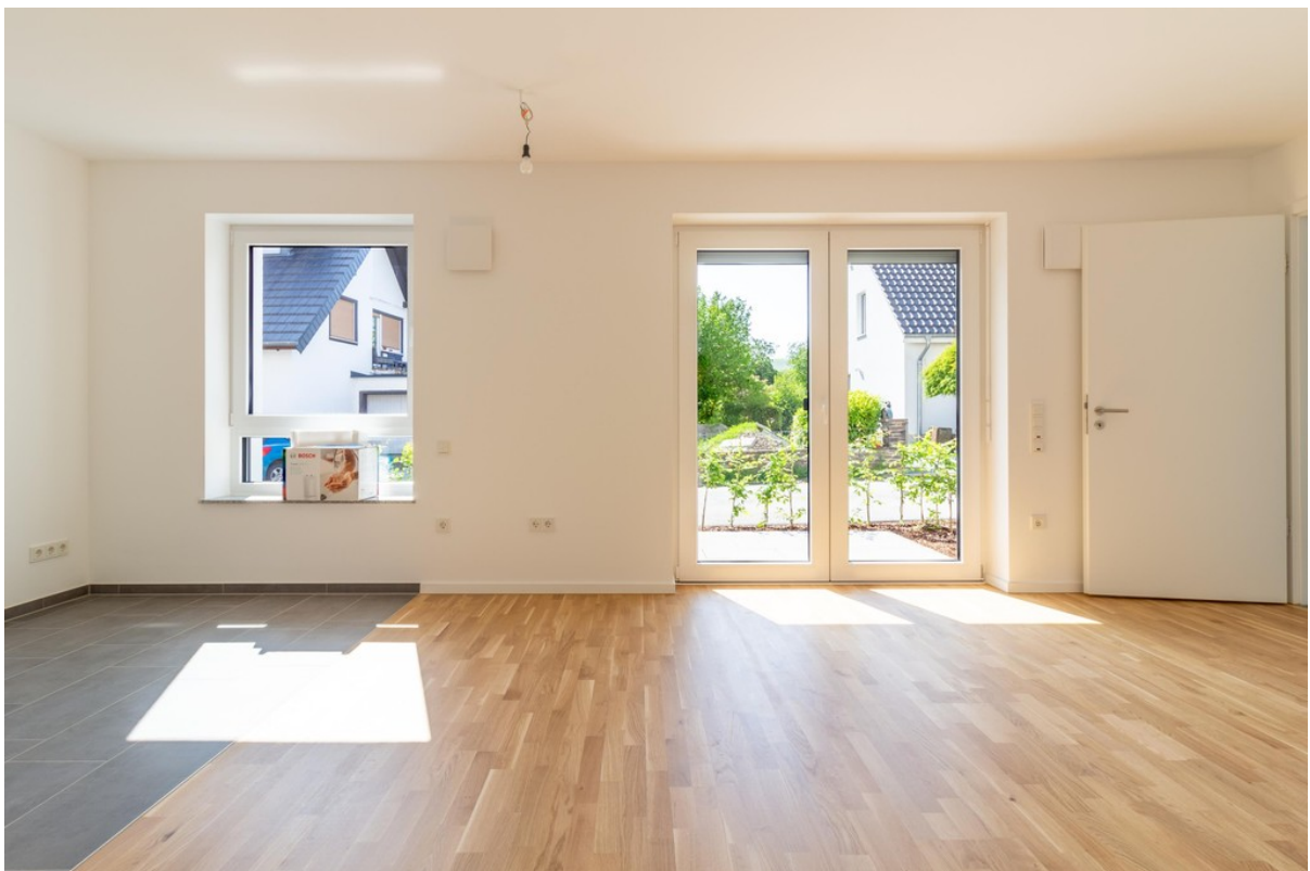
Wohnzimmer / Küche