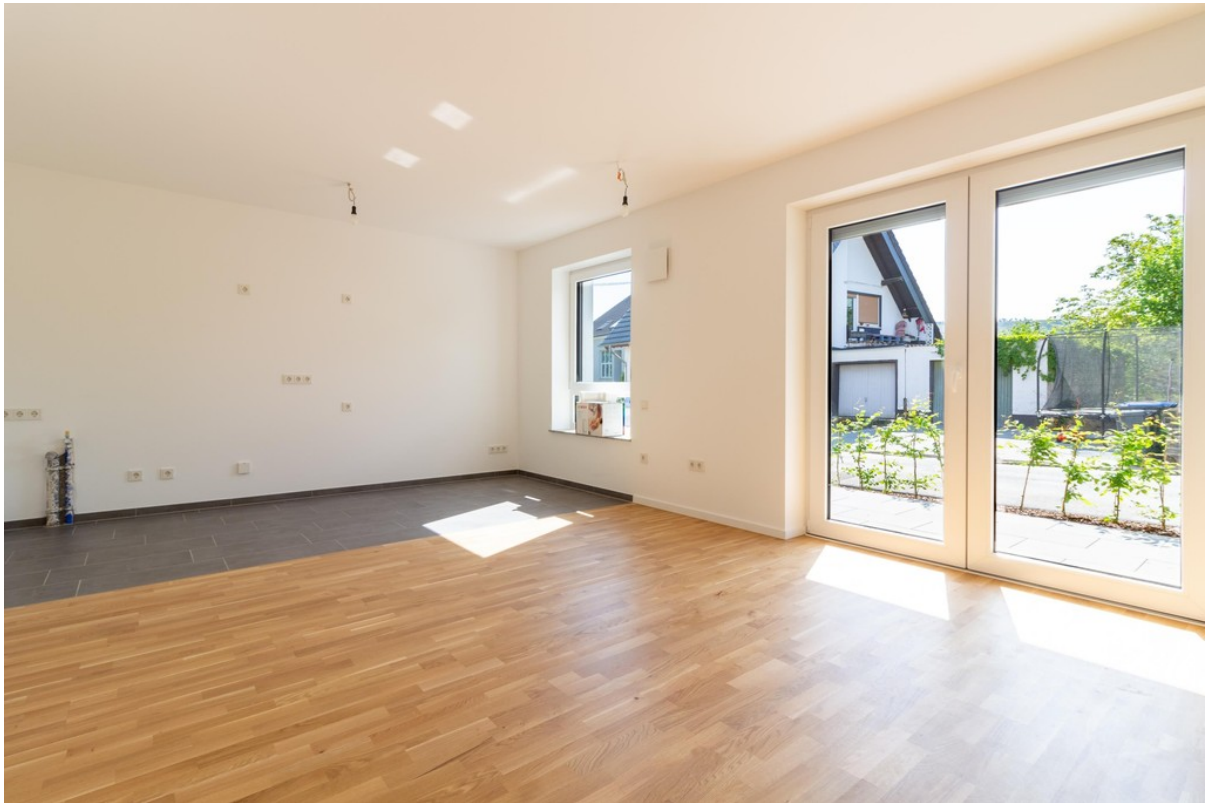
Wohnzimmer / Küche