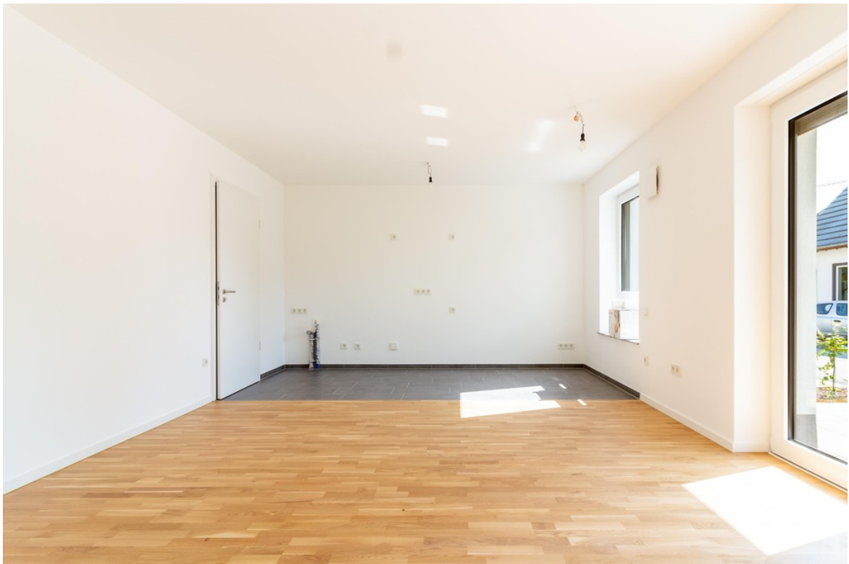
Wohnzimmer / Küche