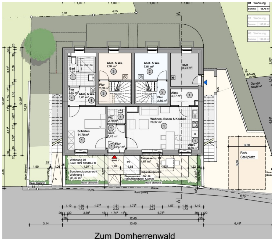
Zum Domherrenwald Erdgeschoss