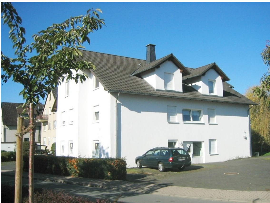
Heise Immobilien - Vermietete