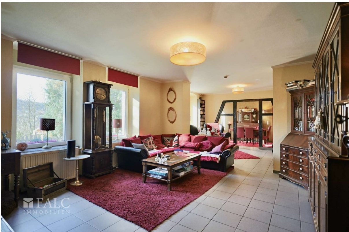
Wohnen WE 2