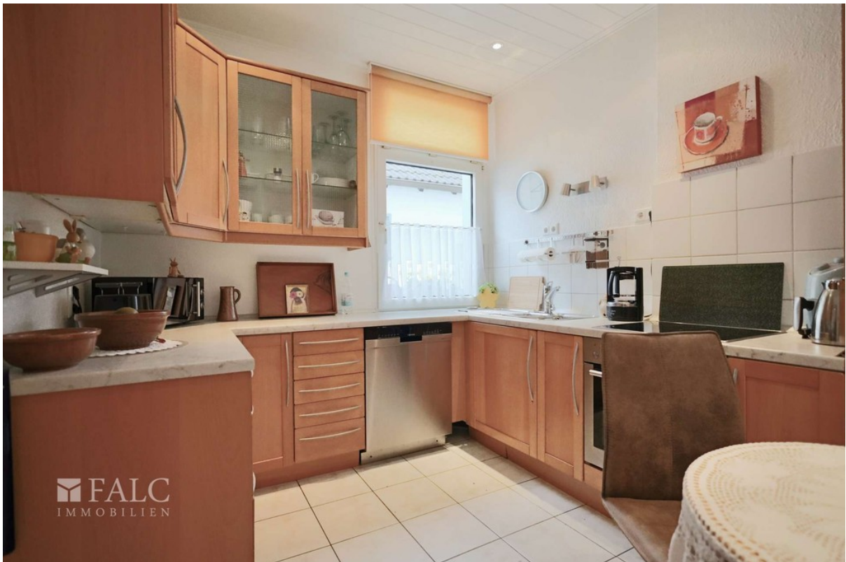
Küche WE 3