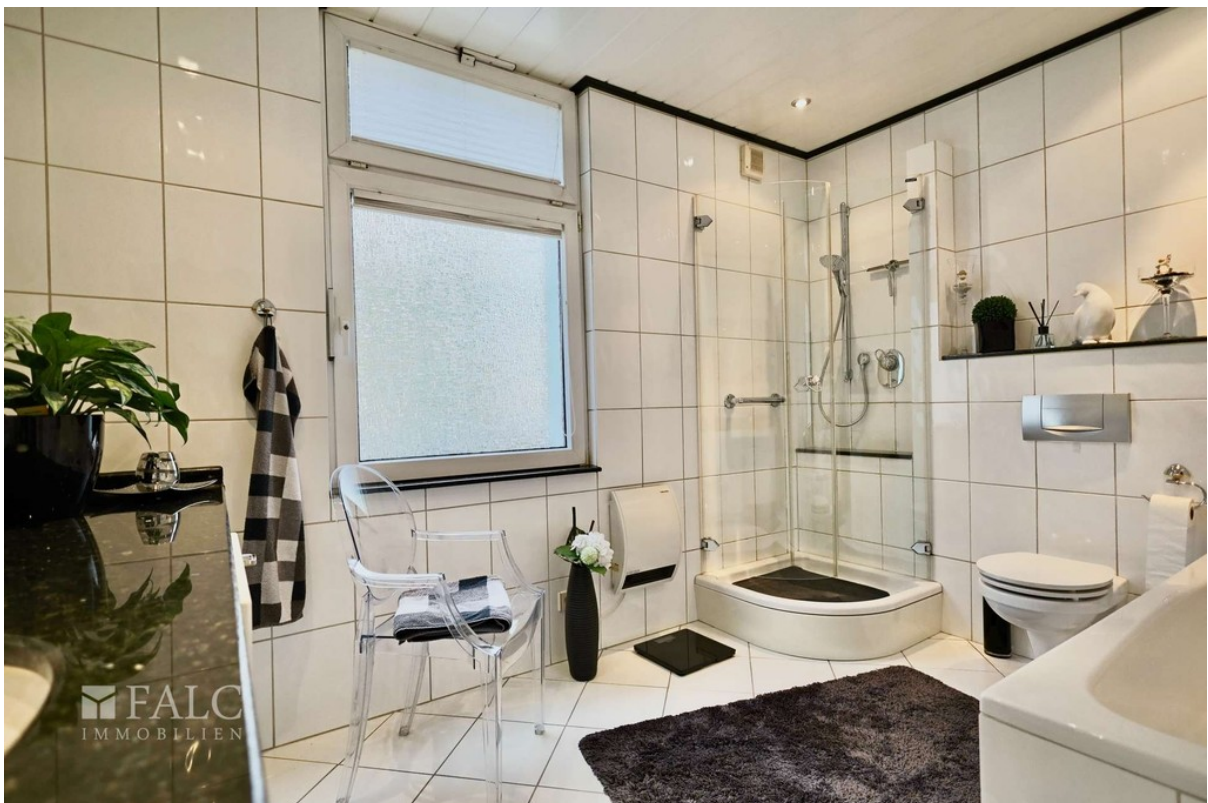
Badezimmer WE 3