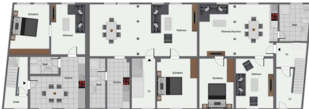
K31-35 1. Obergeschoss