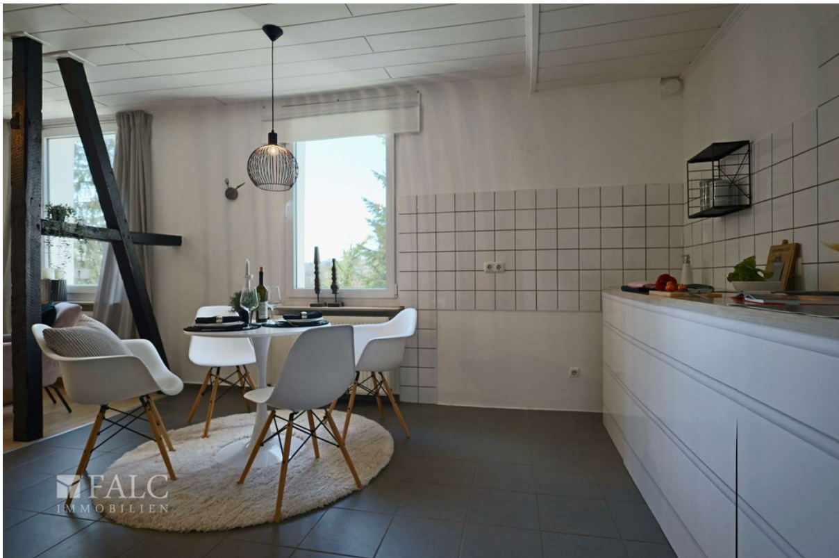
Essen WE 1