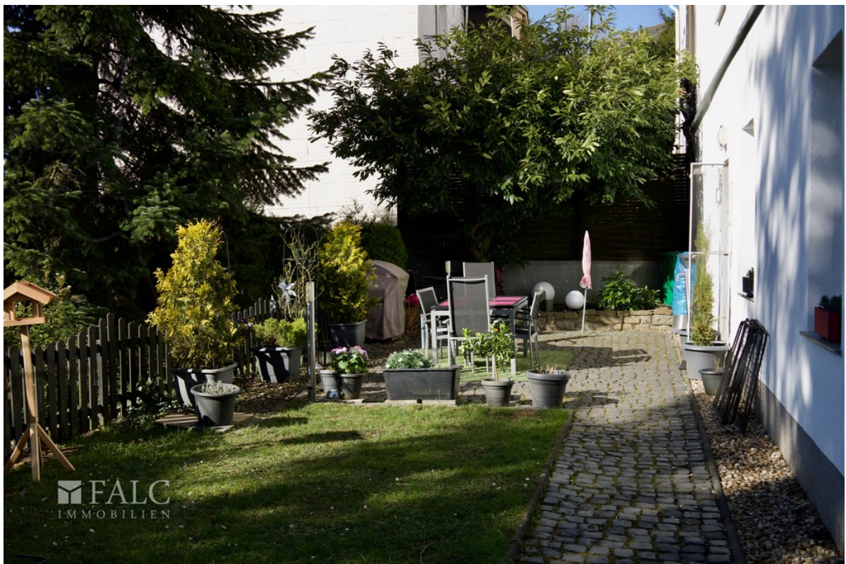
Garten WE 2