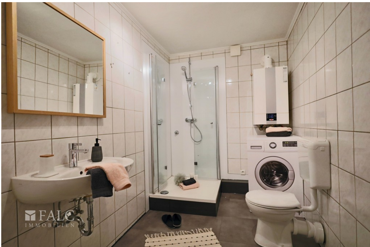
Badezimmer WE 1