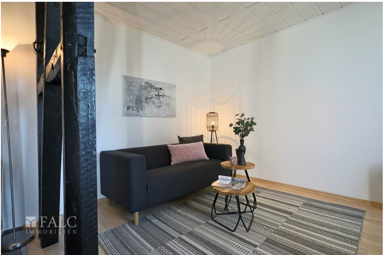
Leben WE 1