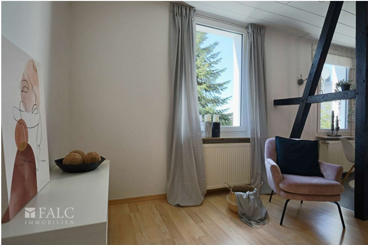
Wohnen WE 1