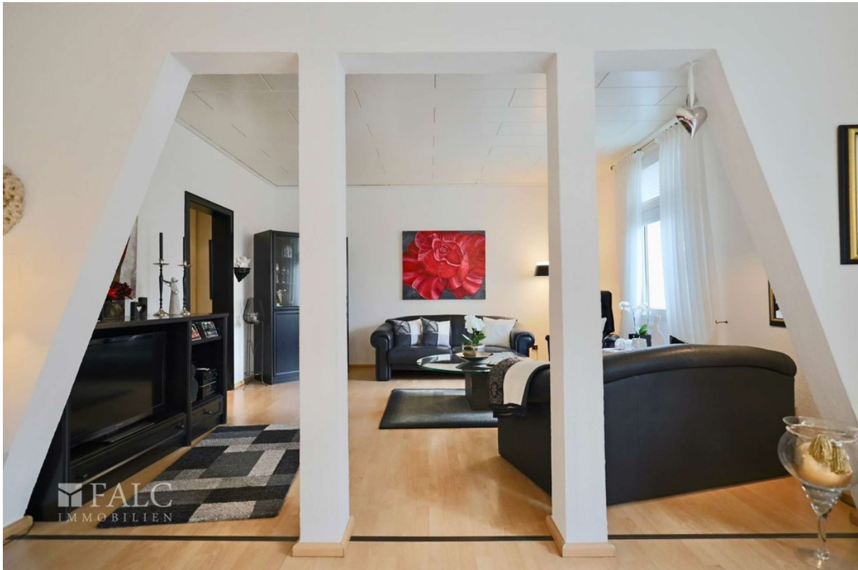
Leben WE 3