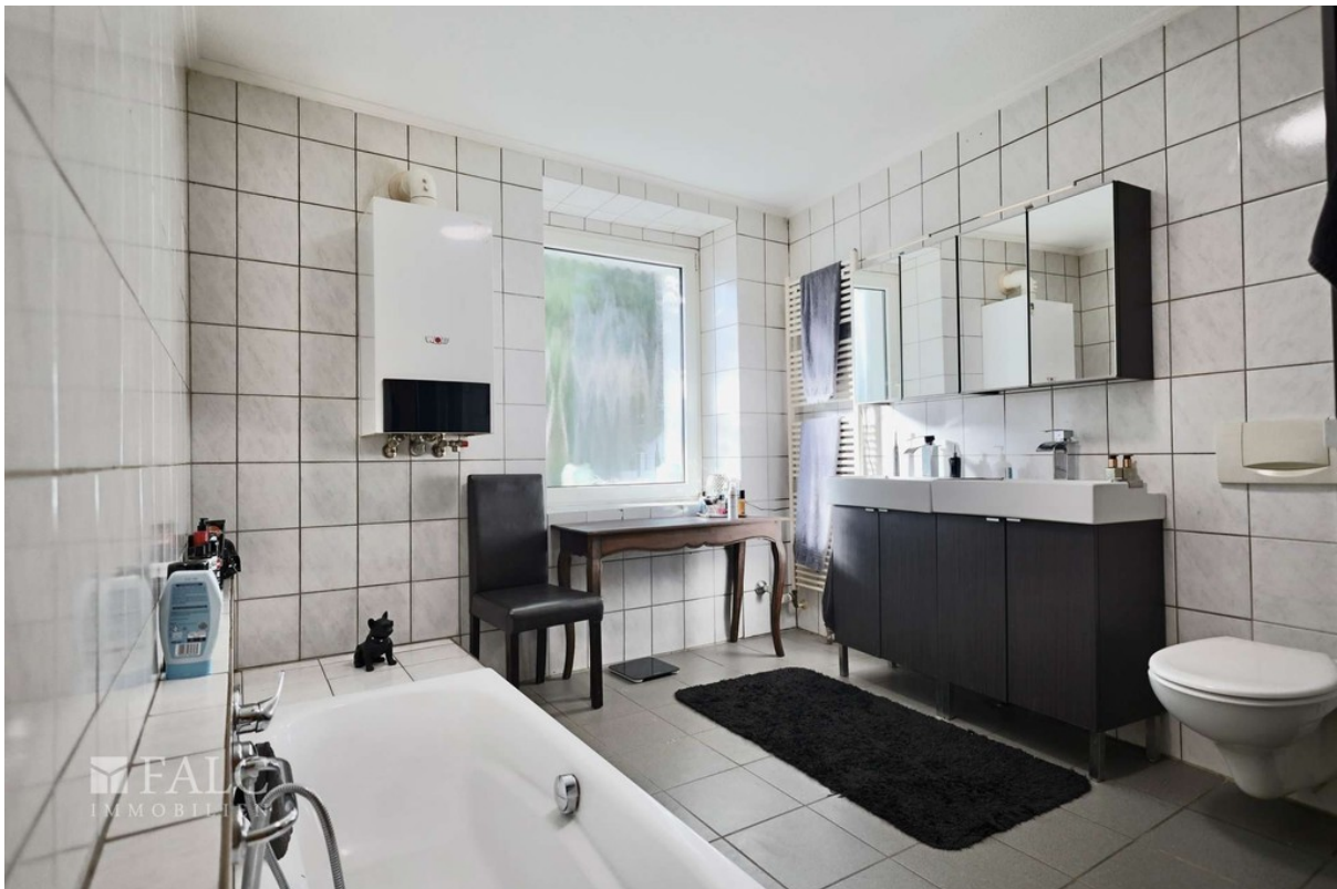
Badezimmer WE 2