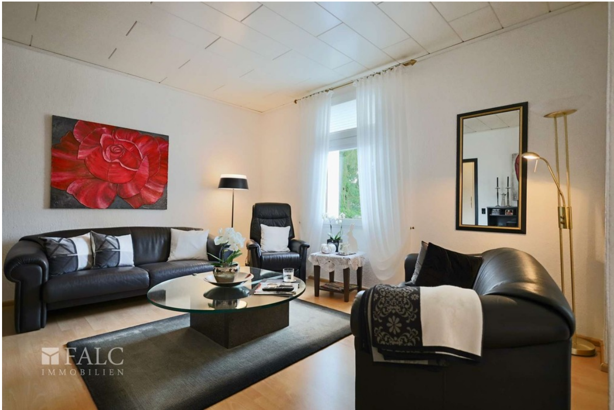
Wohnen WE 3