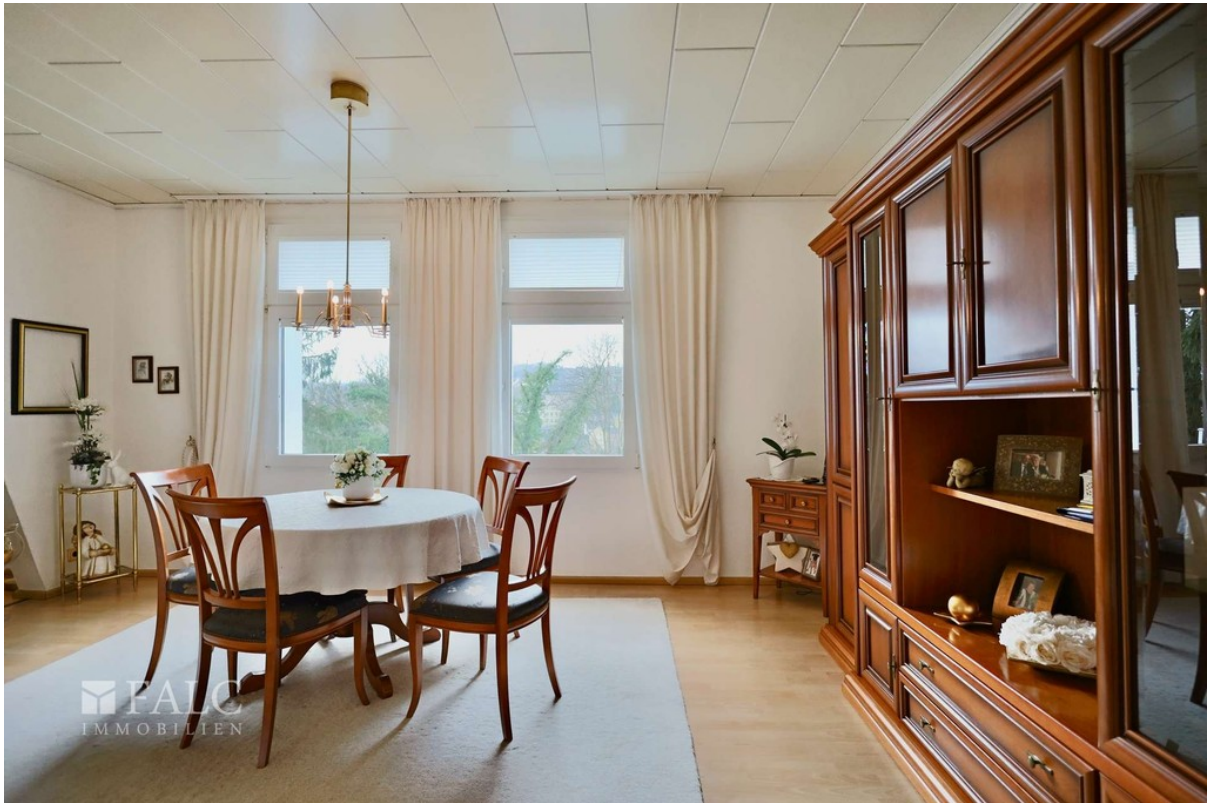
Essbereich WE 3