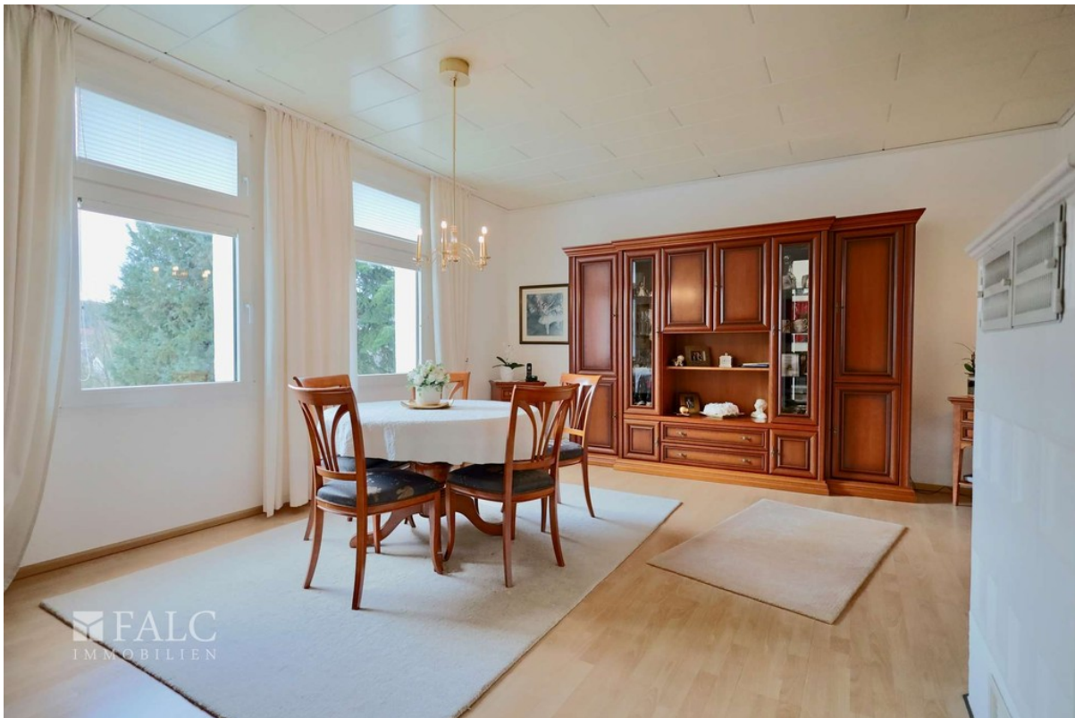
Essen WE 3