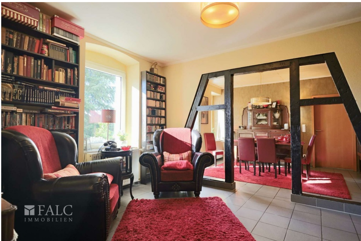
Wohnen WE 2