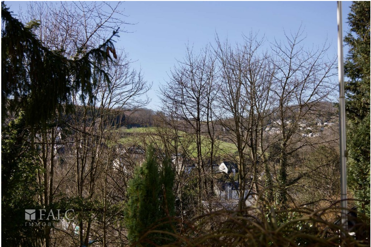
Ausblick WE 2