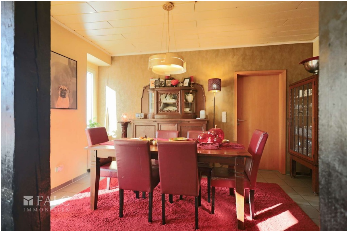
Essen WE 2