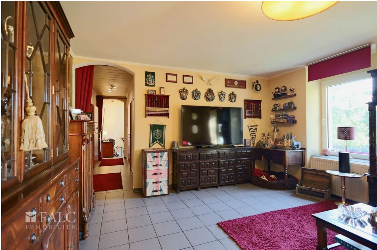
Leben WE 2