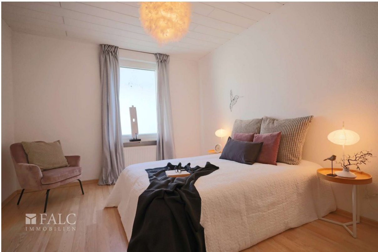
Schlafzimmer WE 1