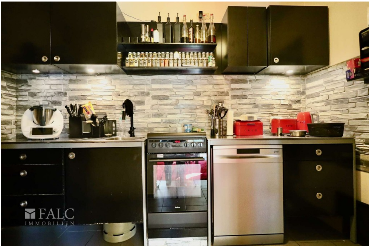
Küche WE 2